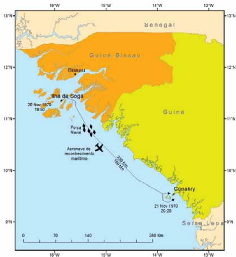
Projeção de força da ilha de Soga para Conacri.

A força de combate foi constituída por 72 militares do Destacamento de Fuzileiros Especiais nº 21 (Marinha Portuguesa), 150 militares da 1ª Companhia de Comandos Africanos (Exército Português), cerca de 150 a 200 elementos da Frente de Libertação Nacional Guineense (FLNG) (elementos de oposição ao regime da Guiné-Conacri), elementos guia da Direção-Geral de Segurança (ex-PIDE), e alguns militares com valências especiais de combate, face à operação a realizar, das forças especiais dos três ramos das Forças Armadas (Fuzileiros, Comandos, Rangers e Paraquedistas). Os elementos revolucionários foram isolados e treinados durante sete meses na ilha de Soga, no arquipéla-