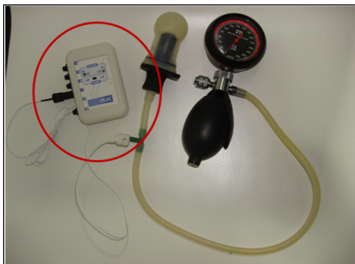
Figura 2 – Unidade de aquisição de biosinais do tipo bioPLUX.