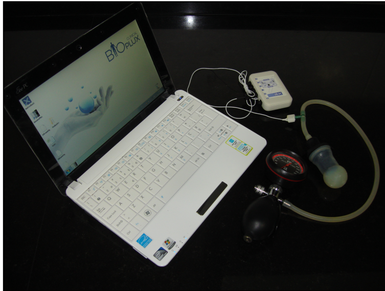
Figura 3 – Computador para onde são enviados os sinais de pressão, via Bluetooth.