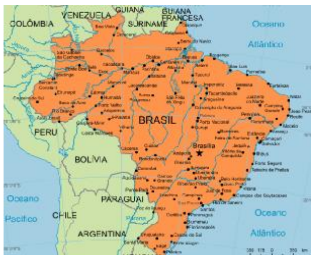
Figura 1 - Posição geográfica do Brasil

A República Federativa do Brasil é o quinto país do mundo em extensão e o maior país da América do Sul. Com dimensões continentais (8 514 876,5 km 2 ) ocupa 47,3% da sua superfície (IBGE, 2008). Com um clima tropical e pouco adverso, ele é ímpar em o seu território ser totalmente habitável, onde o entrave à urbanização e progressão para o interior advém dos seus vastos e importantes recursos naturais. Destacam-se aqui o Pantanal e a Floresta Amazónica 4 , a maior floresta húmida do mundo com uma área superior a 6 milhões de km 2 . Houve uma tentativa de coesão do território ao colocar Brasília numa posição central (Mattos, 1990: 26), mas essa integração física necessita de redes de transporte e comunicações eficazes.