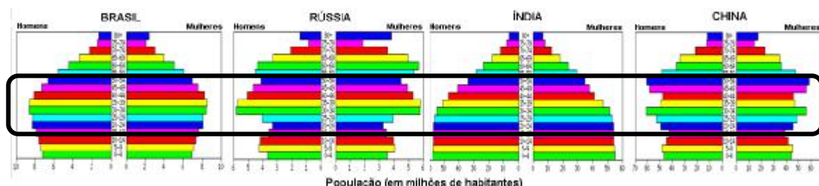
Tabela 1 - População dos BRIC em 2020

A evolução da população em idade activa (após os 15 anos) estimada para 2020 (tabela 1) perspectiva uma elevada produtividade que beneficiará a economia do país, comparável à dos demais BRIC (NationMaster, 2009).