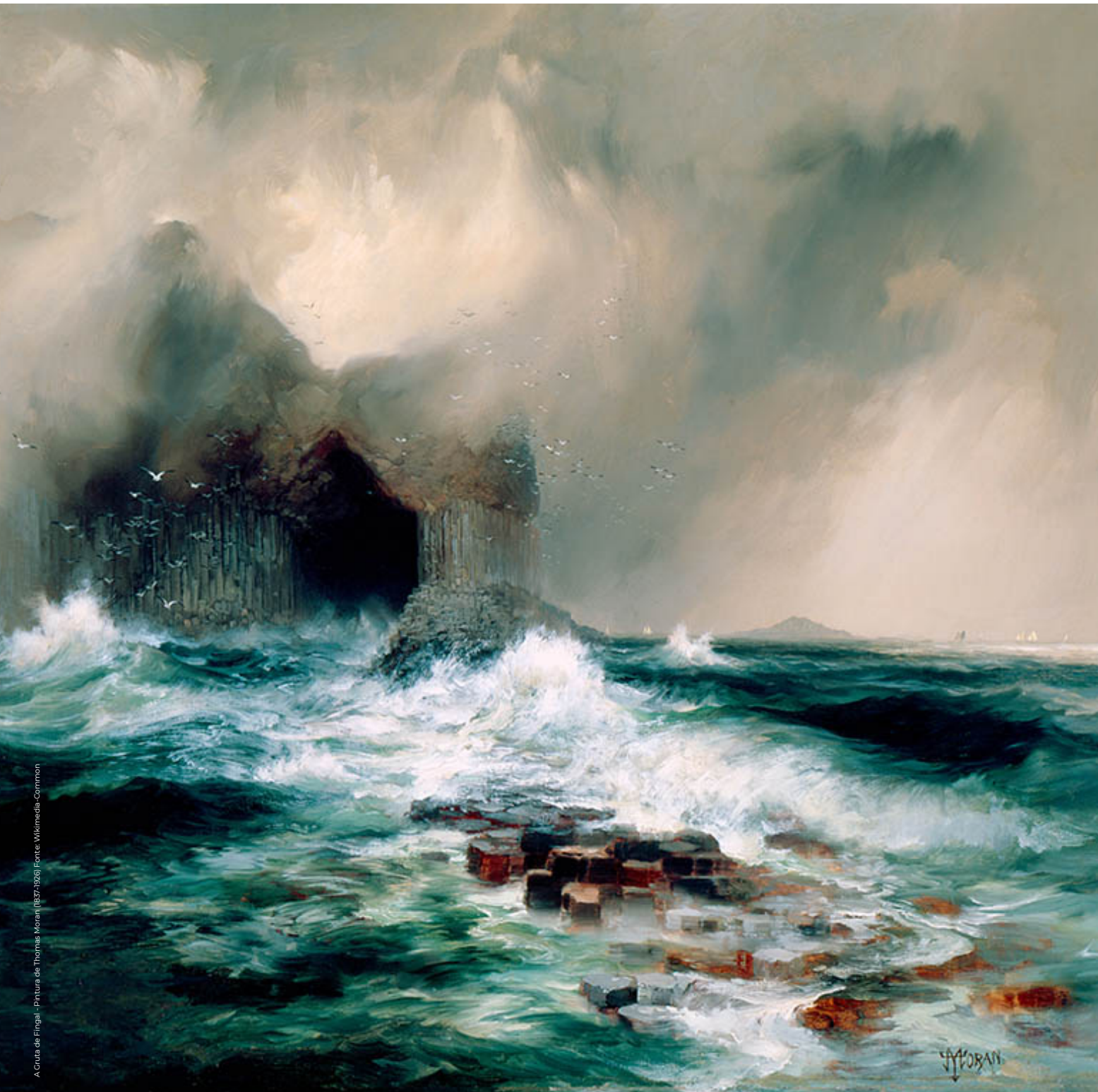
A Gruta de Fingal - Pintura de Thomas Moran (1837-1926)