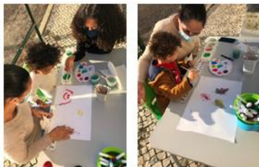
Figura 3 - Participação das Famílias na atividade

Foi referido sempre que a família poderia ser a mãe, o pai e o irmão, como também a avó/avô, a tia/tio, primos e até os próprios animais de estimação. Durante todo o momento em que as famílias e as crianças se encontravam a fazer a atividade, houve o cuidado de as acompanhar, para que não surgissem dúvidas, ao mesmo tempo que ia conversando com elas.