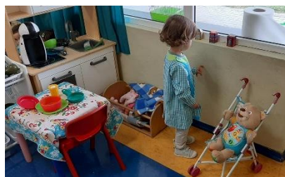
Figura 1 - Apropriação dos objetos trazidos pelas crianças

Esta atividade foi bastante significativa para as crianças, uma vez que trouxeram os seus objetos e os puderam partilhar com os amigos, e também para as famílias, que se viram envolvidas no dia a dia das crianças, tornando o momento num espaço de exploração dos vários objetos para as crianças, sobretudo numa altura em que não podiam entrar dentro da instituição, devido à pandemia.