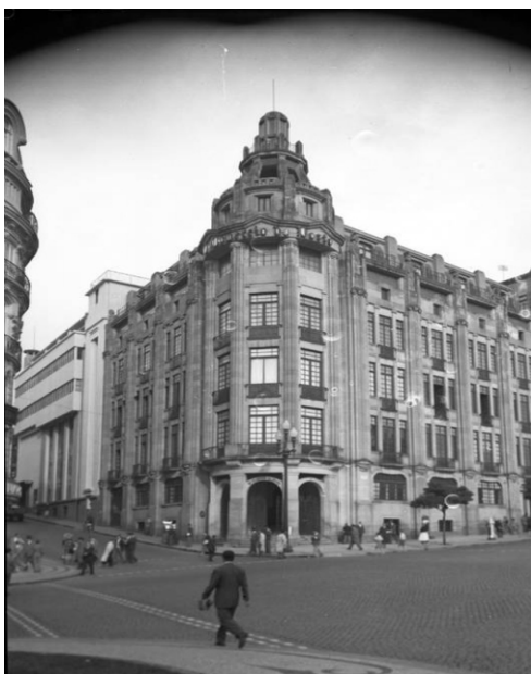
Figura 1. Teófilo Rego. Edifício do Jornal O Comércio do Porto , c. 1953. Arquivo Teófilo Rego, Museu Casa da Imagem - Fundação Manuel Leão. PT-FML-TR-COM-459-001.

conciliou desejo criativo e ofício. Um percurso feito também quer de uma atemporalidade, que julgava encontrar no património edificado da nação 4 , quer de uma vontade de renovação e conciliação entre modernidade e tradição 5 que se vai reflectir, entre outros, nos projectos das Escolas-Tipo Regionalizadas de 1933-35 e nas Pousadas Regionais do Secretariado Nacional de Informação (SNI) de 1939-40.