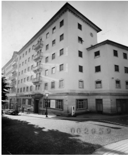
Figura 3. Teófilo Rego. Hotel Infante de Sagres, Porto. Arquivo Teófilo Rego, Museu Casa da Imagem - Fundação Manuel Leão. PT-FML-TR-PES-16-064.

edifício, tirados a horas diferentes do dia. Situada numa rua com um declive relativamente pronunciado, o edifício é marcado por um escalonamento sucessivo de volumes e pelo uso de diferentes materiais numa composição acentuadamente horizontal, aspectos bem enfatizados em ambas as fotografias.