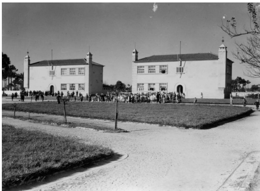
Figura 5. Teófilo Rego. Escola Primária do Bairro de Casas Económicas de Ramalde, Porto. Arquivo Teófilo Rego, Museu Casa da Imagem - Fundação Manuel Leão. PT-FML-TR-PES-16-068.

Não se esgota nestes trabalhos o encontro de Teófilo Rego com a obra de Rogério de Azevedo. Outros edifícios nobres da cidade são motivo do seu olhar. É o caso da antiga Faculdade de Medicina do Porto, hoje Instituto Abel Salazar. Na prova de papel existente no Arquivo Teófilo Rego o edifício aparece isolado de todo o contexto adjacente através de um enquadramento fechado sobre o edifício, tal como já tinha feito para o Edifício do Jornal e na Garagem de O Comércio do Porto .