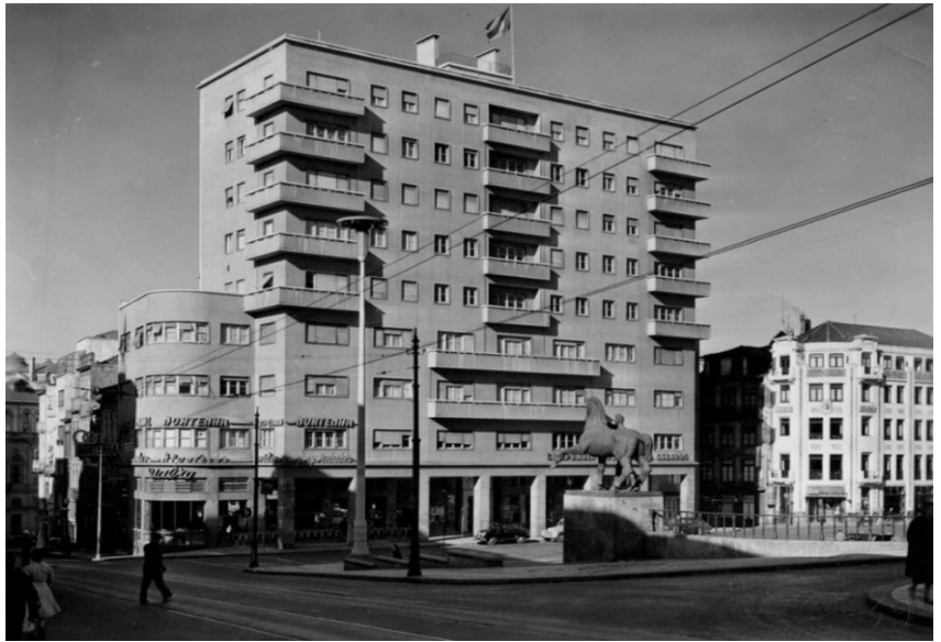
Figura 2. Teófilo Rego. A Praça D. João I, segundo o projecto do grupo A.R.S. arquitectos, já com as estátuas em bronze da autoria de João Fragoso colocadas. Foto posterior a 1957. Arquivo Teófilo Rego, Museu Casa da Imagem - Fundação Manuel Leão. PT-FML-TR-PES-16-066.

provavelmente trabalhado, dramatiza a imagem enquanto a luz modela de forma clarificadora toda a riqueza formal da composição dos alçados.