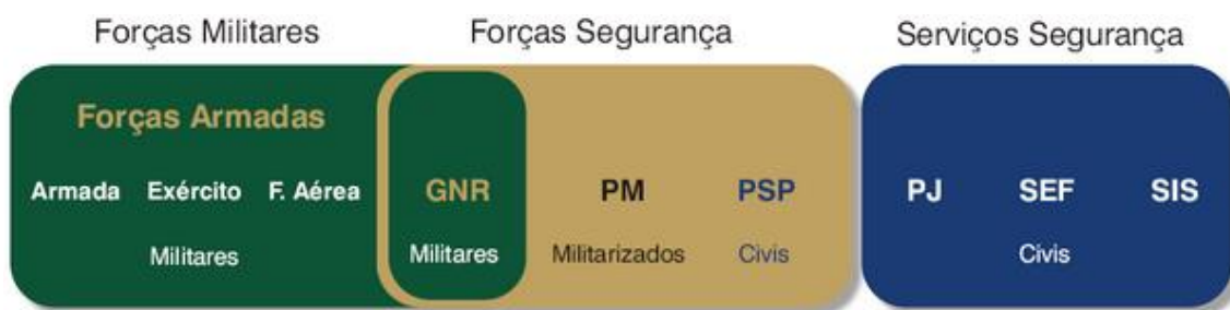
Figura n.º 1 - Enquadramento da GNR no sistema de forças nacionais

Definida na sua própria LOGNR como sendo “(...) uma força de segurança de natureza militar, constituída por militares organizados num corpo especial de tropas e dotada de autonomia administrativa” 35 . Desta forma, fica vincado que a nível da natureza das FSS portuguesas, que a GNR é uma força peculiar, visto ser a única força de segurança de natureza e organização militares, mas ao mesmo tempo se inserir nas forças de segurança. Este último aspeto torna-se uma mais-valia, uma vez que a GNR está apta a “cobrir (...) todo o espectro das diversas modalidades de intervenção das Forças Nacionais” (Branco, 2010, p.242).