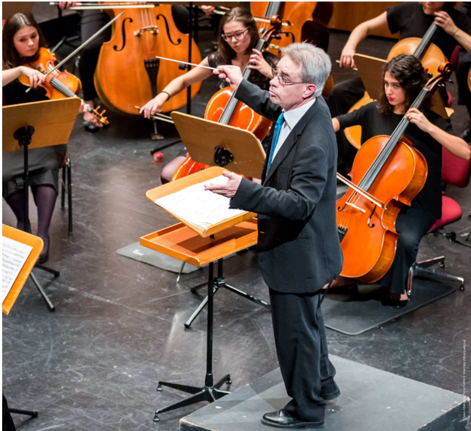
Jean-Marc Burfin e OAM