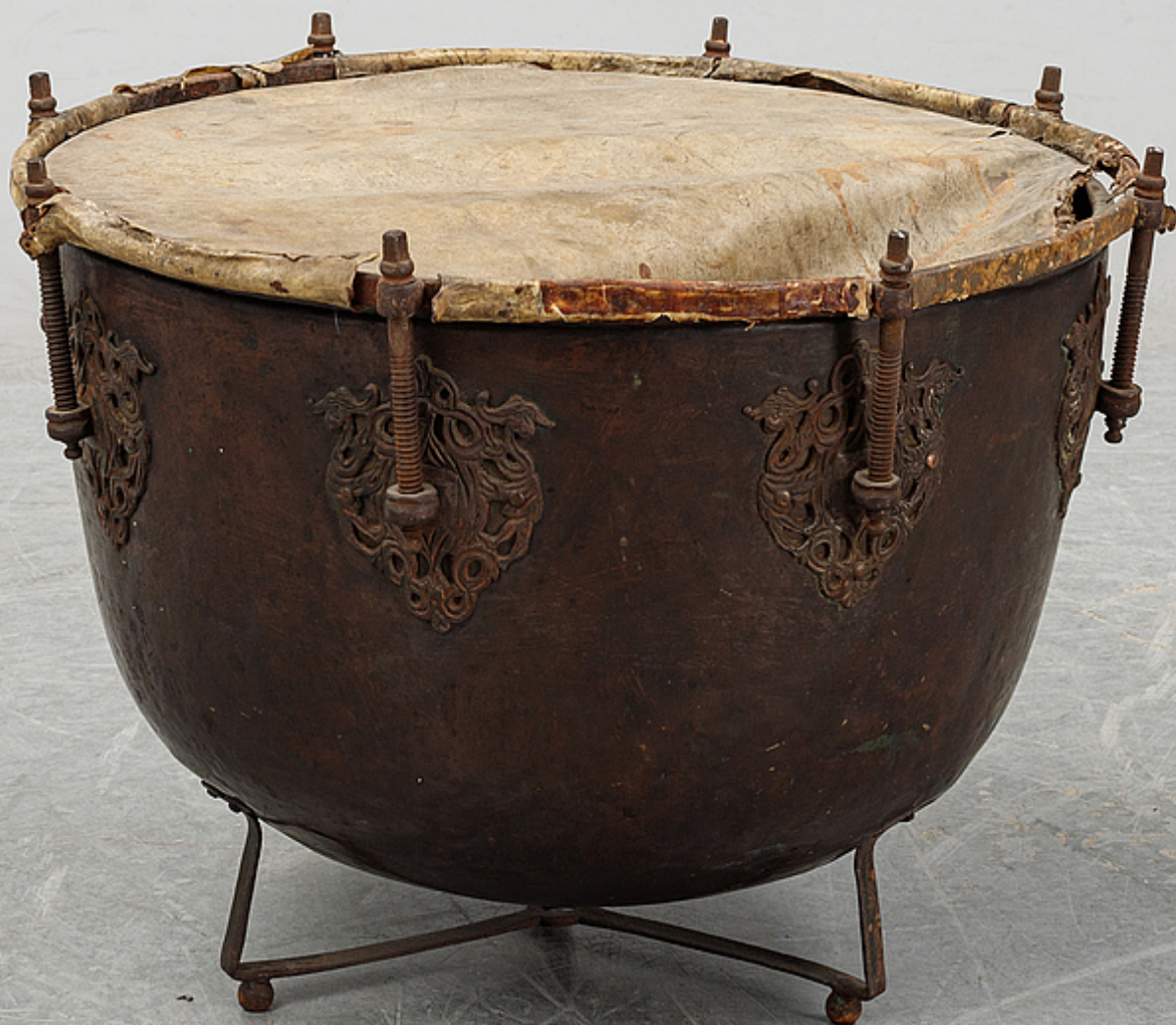
Timpano - Séc. XVIII