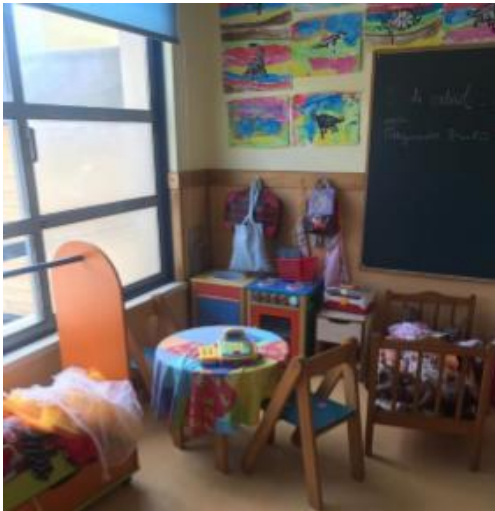
Figura 2 - Área do faz de conta/casa das bonecas