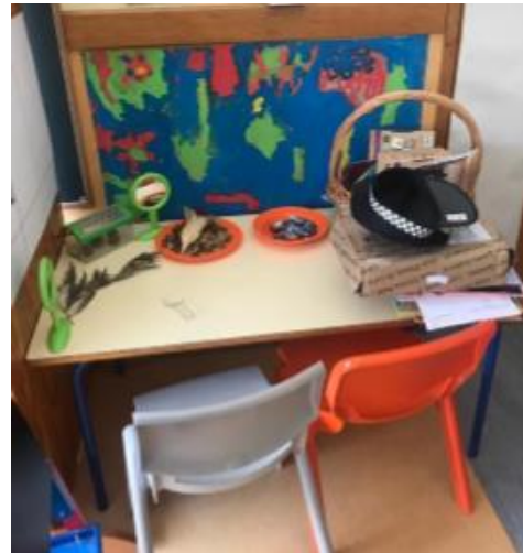
Figura 3 - Área das Ciências

Ao dispor das crianças podemos encontrar ainda na sala uma estante com fantoches e uma mesa dos projetos que dispõe de materiais que as crianças vão levando para o Jardim de Infância relacionados com os projetos a decorrer.