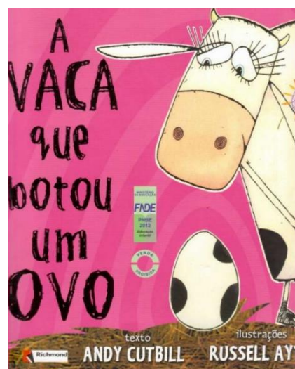
Figura 7- Capa do livro “A Vaca que botou um ovo”

A segunda intervenção que selecionei para apresentar surgiu devido à aproximação da época festiva da Páscoa, em conversa com a minha colega de estágio e com a educadora cooperante, onde chegámos à conclusão de que não queríamos deixar passar este dia em branco, mas que não queríamos apresentar às crianças uma história comum do coelho da Páscoa e, após algum tempo de pesquisa, encontrei na internet uma história de título “A Vaca que botou um ovo”. Apesar da história estar escrita em Português do Brasil esta foi adaptada por mim e as crianças apenas viam as imagens da história que lhes íamos mostrando projetadas. Em seguimento desta atividade preparámos uma caça aos ovos e construámos com as crianças um cesto em forma de dinossauro (projeto que estavam a desenvolver ao longo do ano) para levarem para casa com ovos da Páscoa. Em anexo apresento a planificação desta atividade. (ANEXO 2)