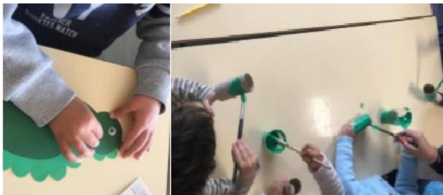
Figura 8 - Construção do cesto dos ovos da Páscoa

A terceira e última atividade que seleccionei para descrever surgiu espontaneamente, enquanto as crianças brincavam na área da biblioteca e viram um novo livro que estava exposto na biblioteca da sala (Fig. 9), tendo as crianças pedido para conhecer aquela história na “Hora do Conto”. Na semana seguinte planeei uma pequena atividade posterior à “Hora do Conto” que seria o reconto da história que tinham ouvido. Nessa semana as crianças tinham falado com a educadora sobre Origamis e pensei num reconto da história em ponto grande, decorada com Origamis em forma de barco realizados pelas crianças. Em anexo apresento a planificação desta intervenção. (ANEXO 3)