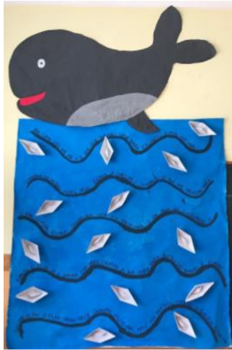
Figura 10 - Reconto da história "O Regresso da Baleia"

Ao longo deste estágio contei outras histórias durante a “Hora do Conto” que foram marcadas apenas com pequenas ilustrações realizadas pelas crianças depois da audição da história. Com estas intervenções percebi que as rotinas são de extrema importância para o quotidiano das crianças e que a leitura nem sempre estava presente nos dias daquelas crianças, pois muitas delas não estavam habituadas a escutar e a aproveitar o momento de descontração e aprendizagem. Com a minha prática retirei também alguns ensinamentos, nomeadamente que as histórias têm de ser muito apelativas e que a forma como são contadas também, que é necessário dar algum ênfase à forma como se lê a história para as crianças e muitas vezes é necessário fazer algumas adaptações do texto, pois este pode tornar-se muito complexo para as mesmas. Se colocasse em prática hoje em dia todas estas intervenções teria feito uma melhor preparação da leitura e da forma como a interpretaria, pois nas minhas primeiras intervenções não tinha preparado a leitura o suficiente e isso acabou por se tornar num ponto negativo da minha autoavaliação no decorrer do estágio.