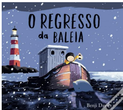
Figura 9 - Capa do livro “O Regresso da Baleia”

A terceira e última atividade que seleccionei para descrever surgiu espontaneamente, enquanto as crianças brincavam na área da biblioteca e viram um novo livro que estava exposto na biblioteca da sala (Fig. 9), tendo as crianças pedido para conhecer aquela história na “Hora do Conto”. Na semana seguinte planeei uma pequena atividade posterior à “Hora do Conto” que seria o reconto da história que tinham ouvido. Nessa semana as crianças tinham falado com a educadora sobre Origamis e pensei num reconto da história em ponto grande, decorada com Origamis em forma de barco realizados pelas crianças. Em anexo apresento a planificação desta intervenção. (ANEXO 3)