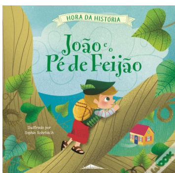
Figura 5 - Capa do livro "João e o Pé de Feijão"

Assim sendo, após conversar com a educadora sobre esta experiência, planeei a atividade e os momentos com algum detalhe. Introduzi o tema através de uma conversa com os alunos sobre a visita e posteriormente lancei a ideia da plantação do feijão, à qual as crianças mostraram desde logo bastante interesse. Antes da experiência de plantar o feijão, sentei os alunos na área do tapete e contei-lhes a história "João e o Pé de Feijão". Em anexo apresento a planificação da atividade. (ANEXO 1)