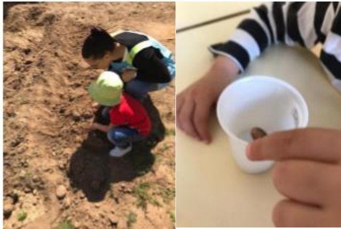
Figura 6 - Semear um feijão

A segunda intervenção que selecionei para apresentar surgiu devido à aproximação da época festiva da Páscoa, em conversa com a minha colega de estágio e com a educadora cooperante, onde chegámos à conclusão de que não queríamos deixar passar este dia em branco, mas que não queríamos apresentar às crianças uma história comum do coelho da Páscoa e, após algum tempo de pesquisa, encontrei na internet uma história de título “A Vaca que botou um ovo”. Apesar da história estar escrita em Português do Brasil esta foi adaptada por mim e as crianças apenas viam as imagens da história que lhes íamos mostrando projetadas. Em seguimento desta atividade preparámos uma caça aos ovos e construámos com as crianças um cesto em forma de dinossauro (projeto que estavam a desenvolver ao longo do ano) para levarem para casa com ovos da Páscoa. Em anexo apresento a planificação desta atividade. (ANEXO 2)