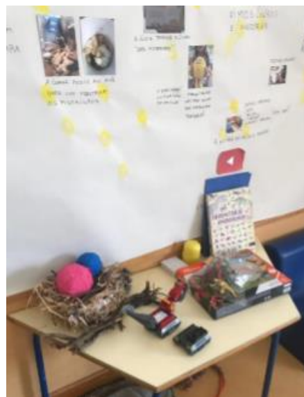
Figura 4 - Mesa dos Projetos

Ao dispor das crianças podemos encontrar ainda na sala uma estante com fantoches e uma mesa dos projetos que dispõe de materiais que as crianças vão levando para o Jardim de Infância relacionados com os projetos a decorrer.