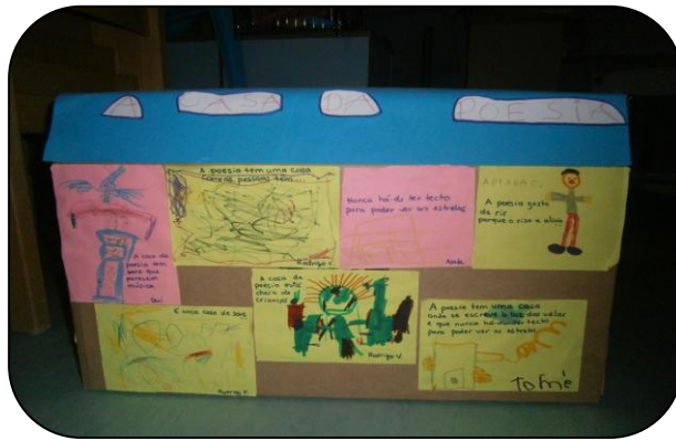
Figura 7 – A casa da poesia construída pelas crianças