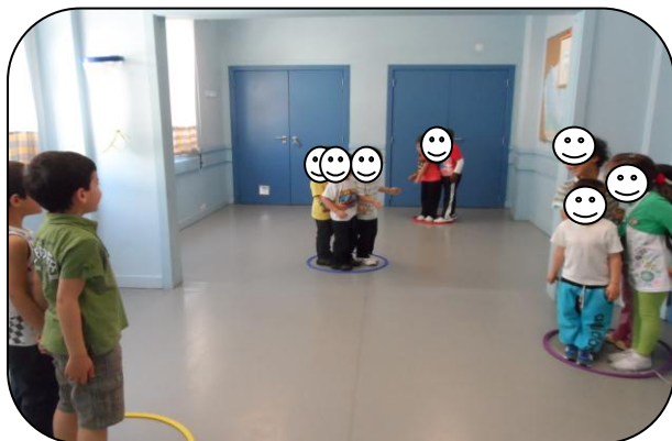
Figura 5 – Crianças distribuídas pelos arcos

raciocínio lógico em todos os momentos. Inicialmente cada criança estava dentro de um arco e a pouco e pouco ia-se tirando um arco, no final todas as crianças tinham de estar num só arco. Neste jogo as crianças ajudavam-se, chamando umas pelas outras, mostraram entusiasmo, interajuda e respeito pelos colegas e regras do jogo. Mais uma vez o grupo mostrou a grande cumplicidade existente entre si.