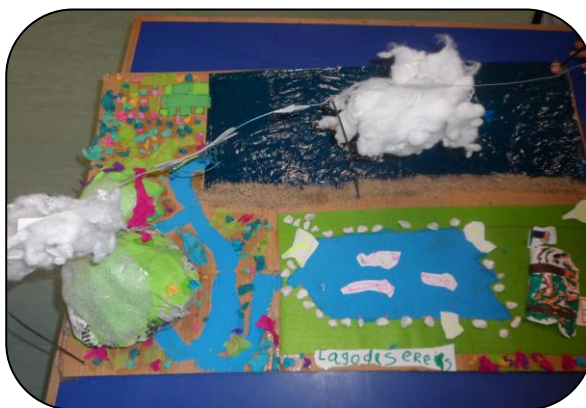
Figura 2 – Maquete do ciclo da água

Outra atividade significativa, que as crianças aderiram de forma positiva foi a recitação do poema da água. Nesta atividade as crianças puderam explorar a poesia,