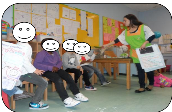
Figura 1 – Comunicação da maquete do ciclo da água

A atividade referida em primeiro lugar, no âmbito da problemática desenvolvida, não se baseou numa atividade única e isolada, foi a construção da maquete do ciclo da água e teve a duração de várias sessões. Nesta atividade tentou-se essencialmente promover o interesse das crianças no seu processo, assim como a cooperação e relação entre os pares, o desenvolvimento da linguagem foi visível durante a comunicação da maquete ao grupo. Nesta atividade o grupo representou e criou uma paisagem em que o ciclo da água esteve visível em formato tridimensional. As crianças partilharam as suas ideias, escutaram, questionaram e argumentaram perspetivas diferentes das suas, respeitaram a opinião dos outros, mostrando cooperação e companheirismo. As crianças mais velhas ajudaram os mais novos mostrando um enorme sentido de respeito e responsabilização, as crianças mais novas tiveram uma voz mais ativas, mostrando segurança no que faziam e diziam.