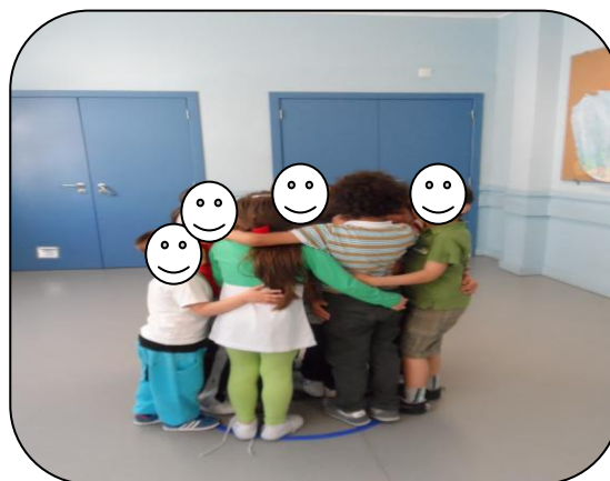
Figura 6 – Crianças num só arco

Outra atividade escolhida, foi uma atividade que corresponde à área da linguagem oral e escrita, que pretende dar a conhecer às crianças a beleza da poesia, para que estas se familiarizem com esta forma de literatura, esta descoberta é muito importante para a formação do indivíduo.