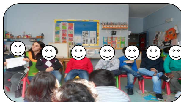
Figura 4 – Recitação do poema

Uma atividade significativa que mostrou a cooperação, o companheirismo, o respeito foi o jogo da ilha, uma atividade de expressão motora que incluía dança e interajuda e