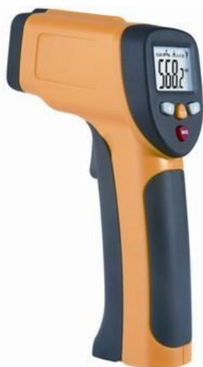
Figura 6 – Termómetro infravermelhos usado para controlo das temperaturas dos postos de frio.

O objetivo do trabalho consiste na análise das não-conformidades, que foram verificadas na realização das auditorias aos diferentes tipos de estabelecimentos.