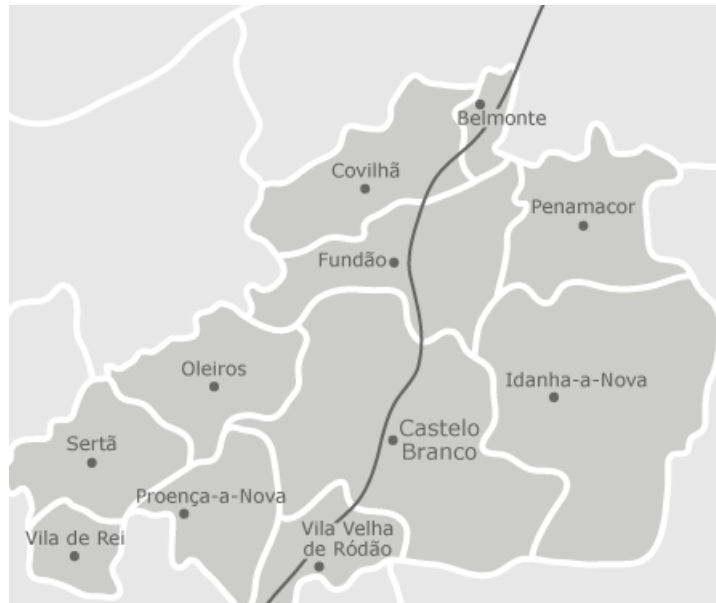
Figura 4 – Mapa do Distrito de Castelo Branco

No Distrito de Castelo Branco os clientes da empresa distribuem-se pela cidade de Castelo Branco, Fundão, Covilhã, Penamacor, Idanha-a-Nova e Vila Velha de Ródão.