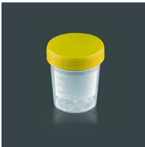
Figura 3 – Copos para recolha de amostra de água.

Formação profissional - realização de ações de formação em higiene e segurança alimentar, por formadores certificados. Estas ações contêm programas a definir, após uma avaliação de necessidades de formação do quadro de pessoal adstrito às diferentes áreas. Estas são desenvolvidas com o objetivo de melhorar os seus conhecimentos ou formação de base.