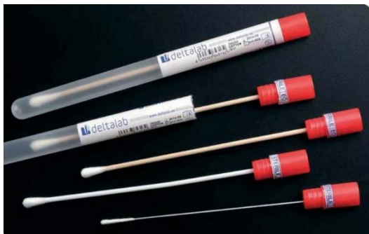
Figura 2 – Zaragoas usadas para recolha em superfícies e mãos de manipulador