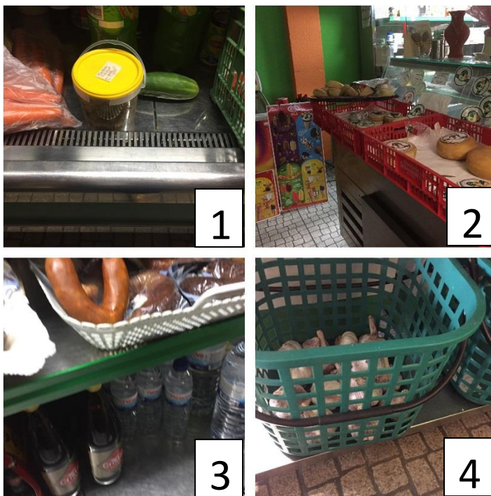
(1) Produto alimentar embalado e sem rótulo (2 e 3) Produto sem rótulo (4) Produto alimentar, venda a granel, sem identificação e preço

No que diz respeito às mercearias, os incumprimentos mais elevados, encontram-se na limpeza de equipamentos e das instalações.