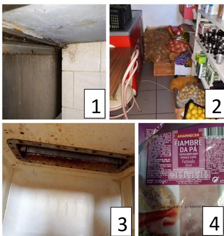
(1) Falta de limpeza e higienização; (2) Produtos alimentares em contacto com o chão; (3) Interior de micro-ondas com alguma falta de higienização; (4) Produto fora do prazo de validade.

Através das auditorias realizadas aos restaurantes e dos resultados apresentados das check-list, podemos concluir que os tópicos que merecem mais atenção estão relacionados com a higiene pessoal, com a zona de armazenamento a frio e com a limpeza de equipamentos e instalações. Estes resultados estão relacionados, também, com o facto de as pessoas não estarem qualificadas para certas funções que desempenham e por não terem formação nessas áreas.