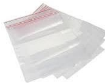
Figura 1 – Sacos esterilizados para recolha de produto alimentar.