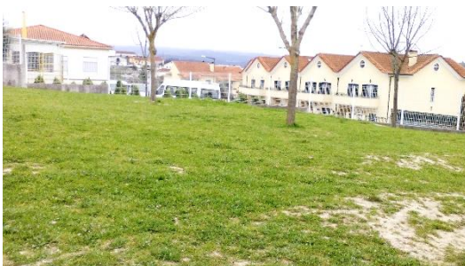
Figura 27: Relva sítio onde mais gosta de brincar.