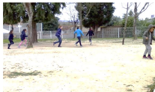
Figura 26: Sítio onde gosta de correr à volta das árvores.