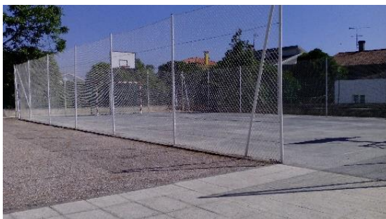
Figura 18: Campo de futebol que a criança fotografou, referindo gostar muito de brincar neste sítio com os amigos.