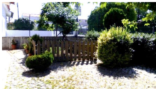
Figura 14: Horta do JI, sítio onde gostava de brincar.

Estagiária – Pois temos de ter cuidado. E há alguma coisa que mudavas no Jardim-de-infância ou algo que querias que não têm?