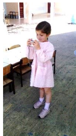
Figura 12: Criança a fotografar os seus locais preferidos para brincar.