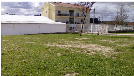
Figura 24: Relva.