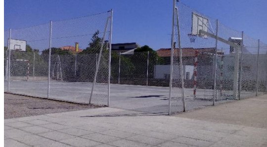
Figura 5: Campo de futebol.

A.5anos – Eu gosto de brincar em todo o lado, gosto de ir para a casinha fazer comer e deitar-me na cama.