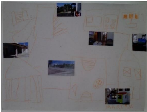
Figura 40: Desenho feito por uma criança de JI. O percurso dos sítios onde mais gosta de brincar.