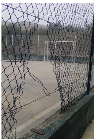
Figura 32: Campo de futebol.