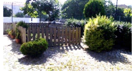
Figura 11: Horta do JI, a criança gostava de mudar este espaço.