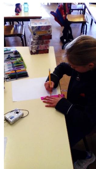
Figura 37: Criança de 1.º Ciclo a desenharem os locais preferidos para brincar, no momento do percurso.