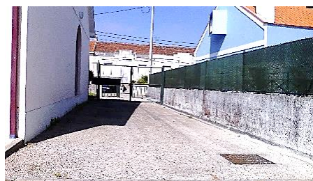
Figura 9: Sítio que gostava de brincar mas não pode.

C. 5anos – Não posso brincar no telheiro, porque agora alguns dias os meninos da primária fazem ensaios e não podemos brincar lá, não se pode fazer barulho...nem no refeitório.