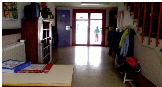
Figura 30: Entrada da Escola.