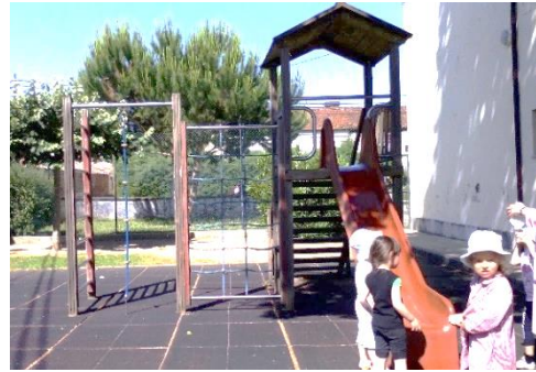
Figura 16: Parque do JI, onde gosta de brincar.

Estagiária – E na sala quando não estás a brincar, estás a fazer o quê?