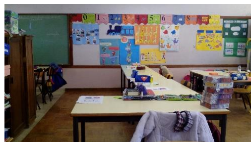
Figura 20: Sala de aula.