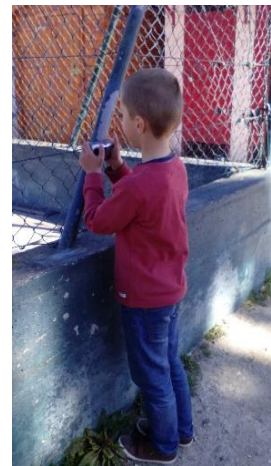
Figura 19: Criança a fotografar o campo de futebol.