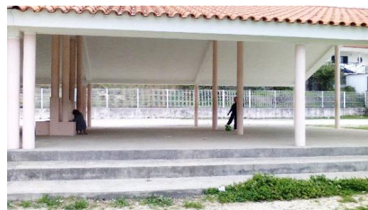
Figura 29: Telheiro.