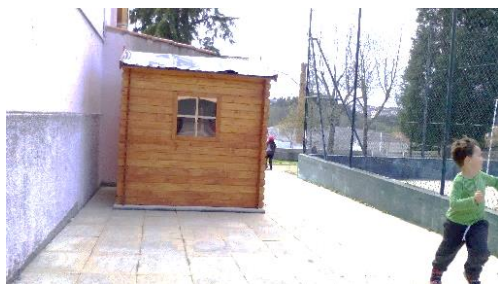
Figura 22: Casinha.