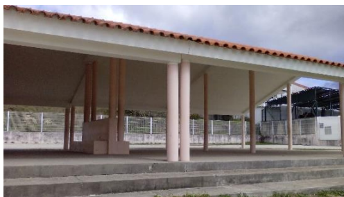
Figura 23: Telheiro.