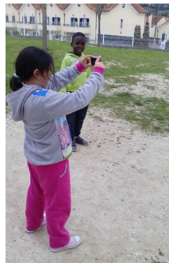
Figura 35: Criança de 1.º Ciclo a fotografar o seu espaço preferido para brincar.