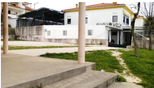
Figura 28: Relva sítio onde gosta de brincar.