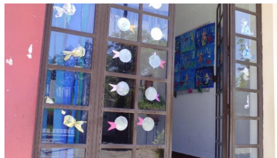
Figura 4: Entrada do Jardim de Infância.