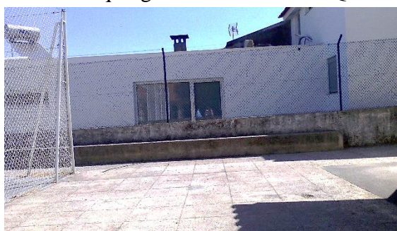
Figura 6: “Picoto”.