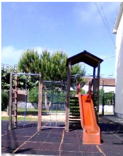
Figura 1: Local preferido da M. para brincar.

Os sítios onde M. gosta de brincar no Jardim de Infância (fotografias tiradas pela criança)