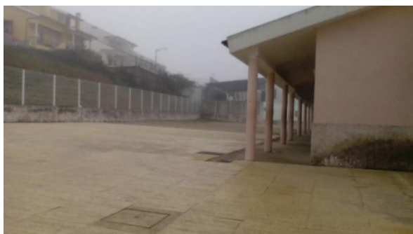
Figura 33: Parte de trás da Escola, onde também joga futebol.