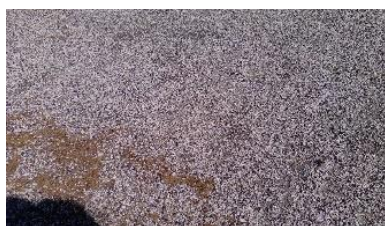
Figura 13: Pedras.