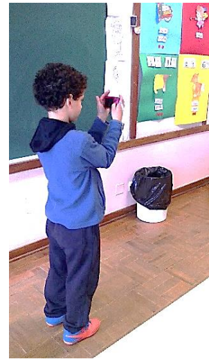
Figura 31: Criança a fotografar a sala de aula.