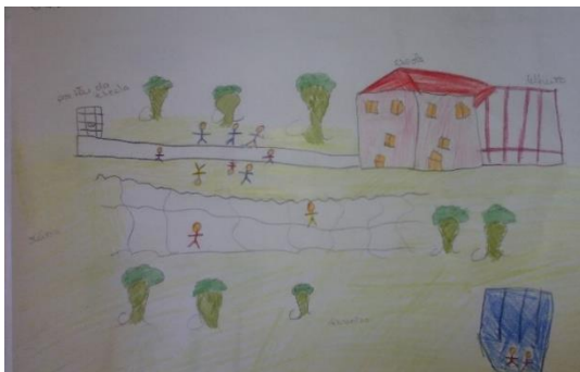
Figura 42: Desenho feito por uma criança de 1ºCEB. Os sítios onde mais gosta de brincar, o exterior.