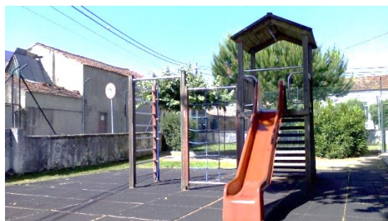
Figura 15: Parque do JI, onde gosta de brincar e gostava de colocar um balancé.