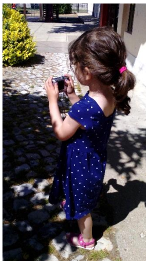
Figura 34: Criança de JI a fotografar os seus espaços preferidos para brincar.