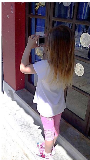
Figura 36: Criança de JI a fotografar os seus espaços preferidos para brincar.