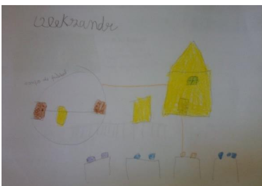
Figura 44: Desenho feito por uma criança de 1ºCEB. Os sítios onde mais gosta de brincar, o exterior.