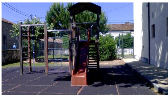
Figura 7: Sítio que o A. referiu gostar de brincar, aquando das visitas guiadas.