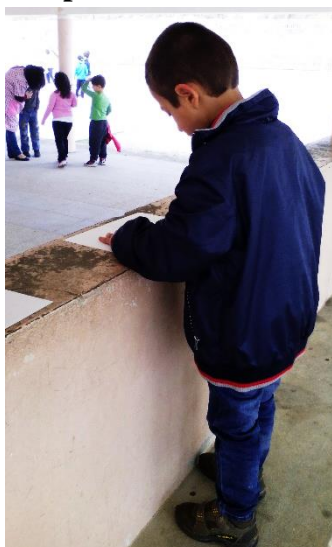
Figura 38: Criança de 1.º Ciclo a desenharem os locais preferidos para brincar, no momento do percurso.