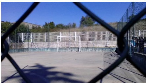
Figura 21: Campo de futebol.