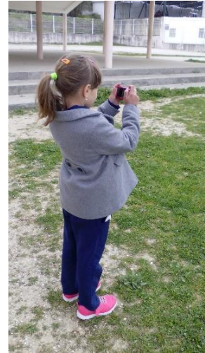
Figura 25: Criança a fotografar o seu sítio preferido para brincar.