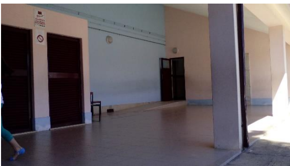
Figura 3: Telheiro da escola de 1.ºCEB, onde brinca em dias de chuva.