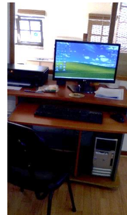
Figura 17: Computador da sala.