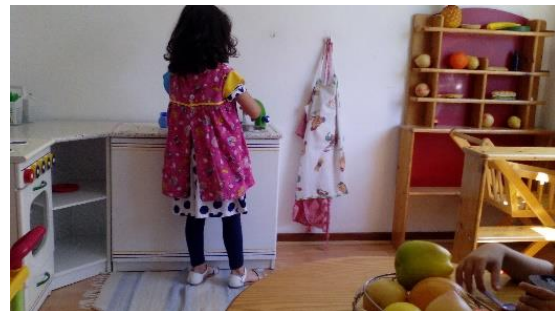
Figura 2: Casinha, local onde a M. gosta de brincar dentro da sala.