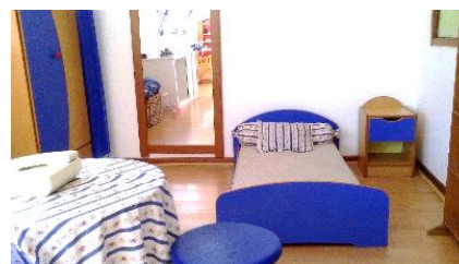
Figura 10: Casinha.