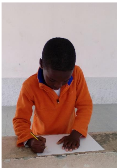
Figura 39: Criança de 1.º Ciclo a desenharem os locais preferidos para brincar, no momento do percurso.