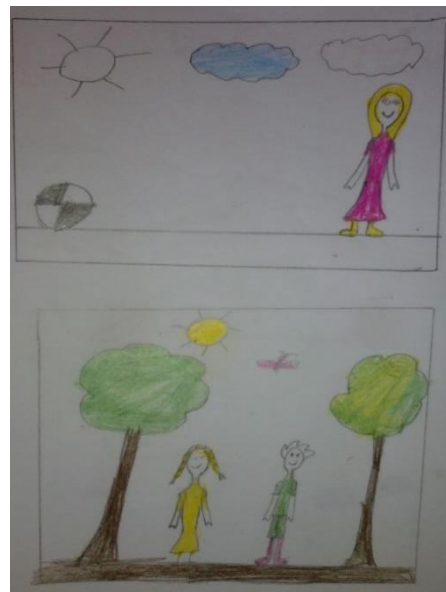
Figura 43: Desenho feito por uma criança de 1ºCEB. Os sítios onde mais gosta de brincar, o exterior.