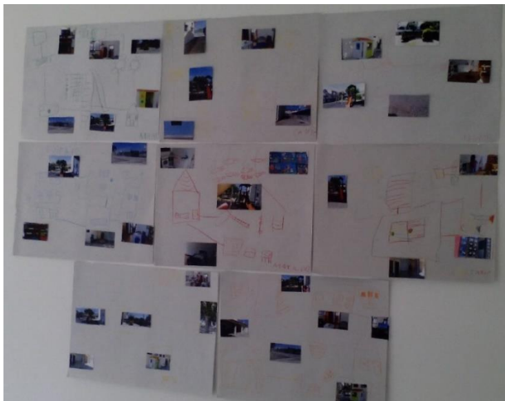
Figura 46: Manta mágica feita em Jardim de Infância