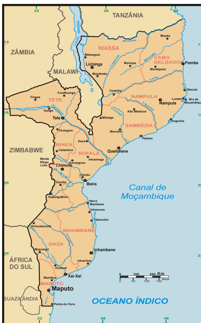
Fig. 1 – Fotografia Aérea de Moçambique.

O rio Rovuma ao norte faz fronteira natural com a República de Tanzânia e ao sul, o rio Maputo. A noroeste encontra-se o Lago Niassa na província de Niassa, que é um dos lago mais profundo do Mundo, com 700m de profundidade, o comprimento é de 560 km e 80 km de largura máxima. Também a oeste faz fronteira com a República de Malawi, Zâmbia, Zimbabwe, Suazilândia e a sul com a República da África do Sul.