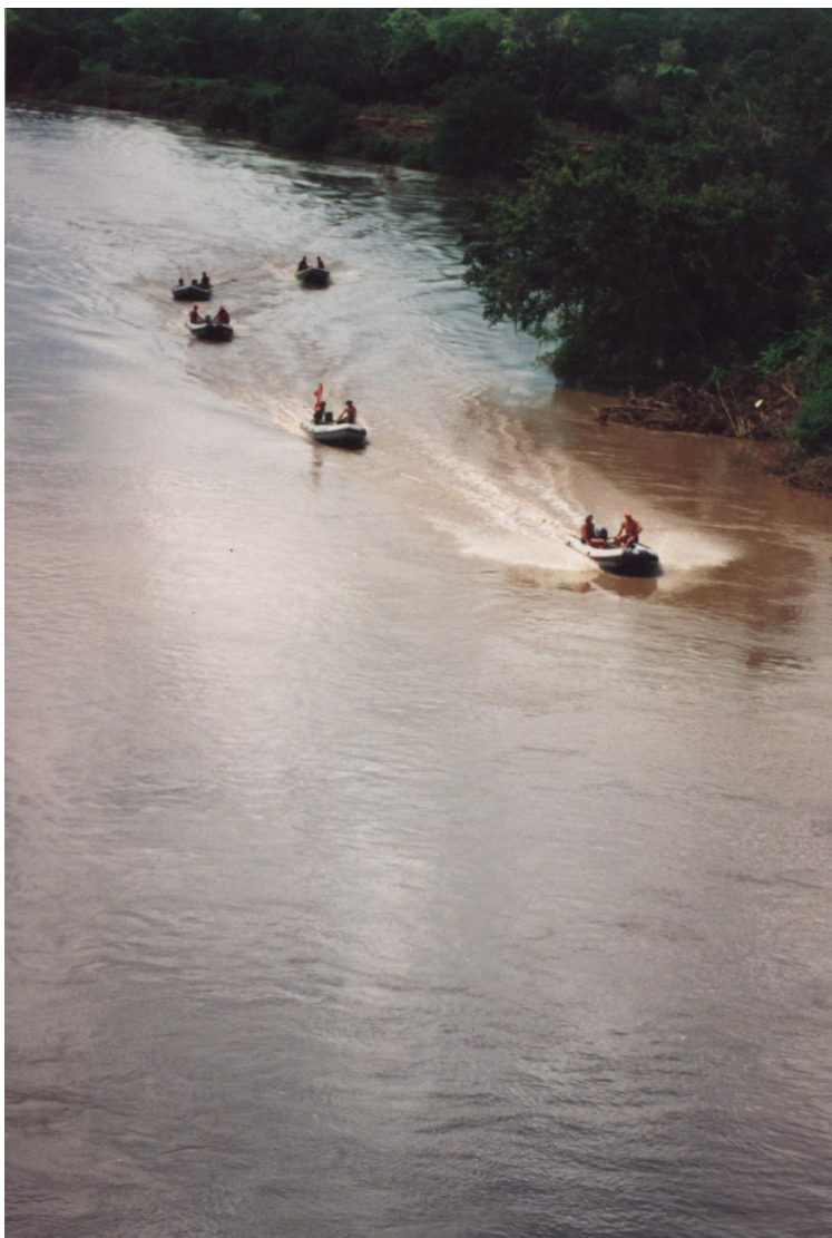
Fig. nº1 - Participação de Fuzileiros Portugueses nas cheias de 2001.

Outros factores de acção incidem sobre as actividades de interesse público que tem merecido reconhecimento não só pelas instituições envolvidas nas realizações conjuntas, mas também da sociedade em geral. Por exemplo: a monitorização de travessias de pessoas e bens nos rios e baías em coordenação com as autoridades marítimas nacionais.