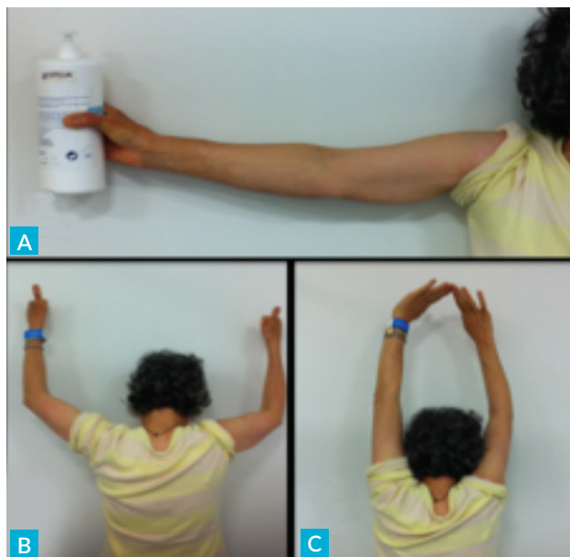
FIGURA 3. Doente após um ano de evolução, com boa amplitude articular e sem queixas algicas.

CONFLITOS DE INTERESSE: Os autores declaram não ter qualquer conflito de interesse na realização do presente trabalho.