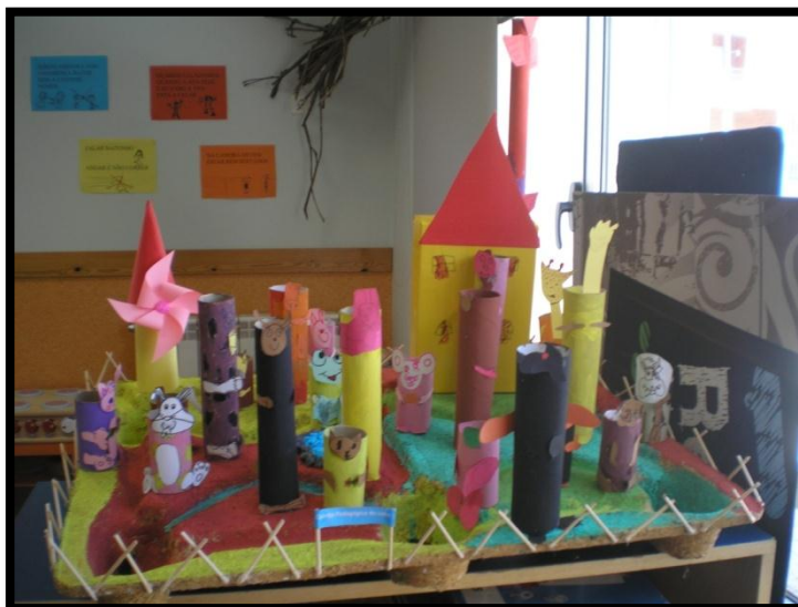
Figura 3 – Quinta Pedagógica do Lobo