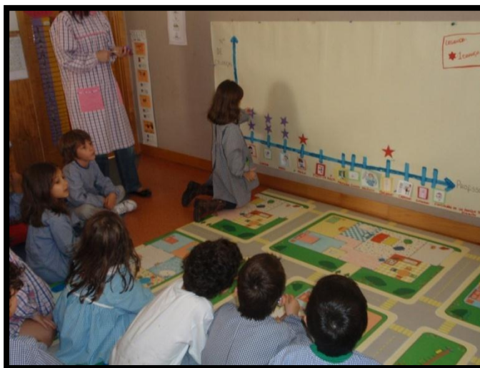
Figura 2 – Construção do gráfico “O que queremos ser quando formos grandes? ”