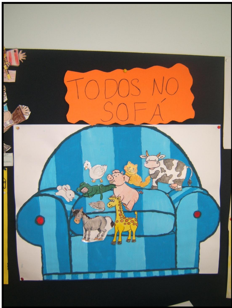
Figura 7 – Hora do Conto “Todos no Sofá”