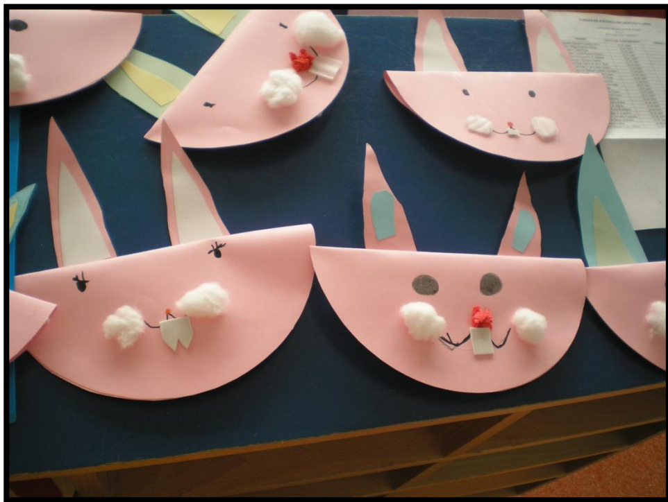
Figura 1 – Prenda da Páscoa