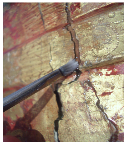
Aplicação com pincel;