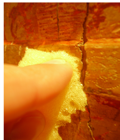
Aplicação de pressão com esponja;