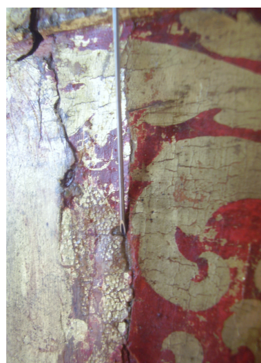
Aplicação com seringa;