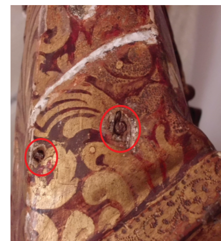
Remoção de óxidos metálicos e aplicação de camada de protecção;