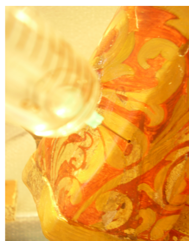
Aplicação com seringa;