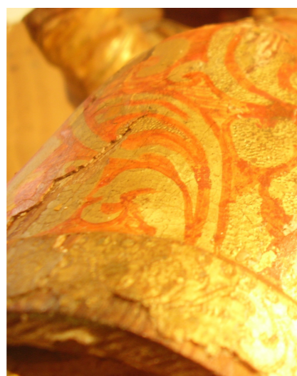
Aspecto após a fixação;