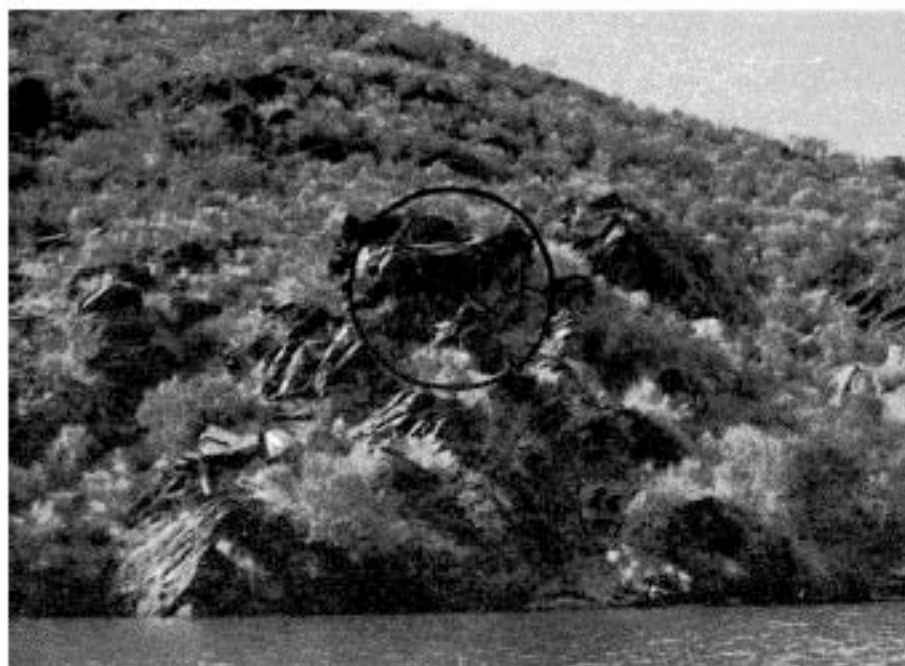
2—O local das gravuras visto do rio Douro.