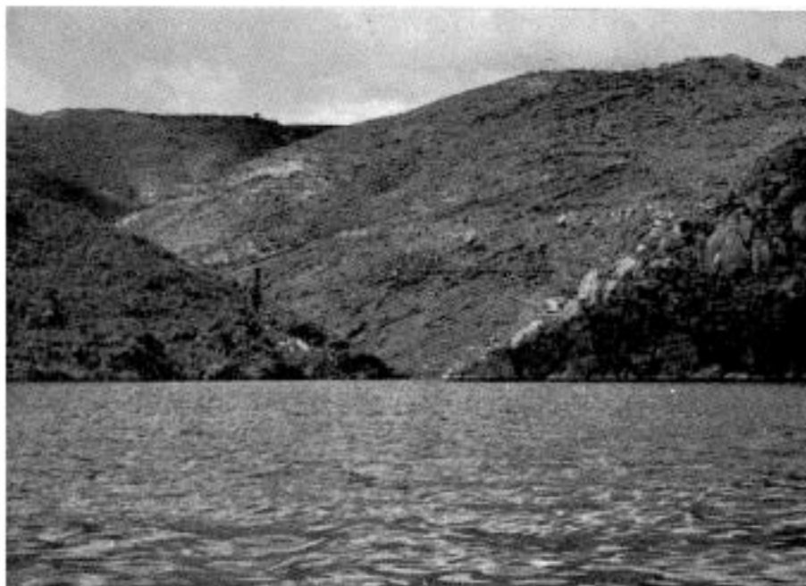
1 — Localização das gravuras, perto da confluência da ribeira de Albugueira com o Douro, vendo-se o vale daquela ribeira e a actual albufeira deste rio.