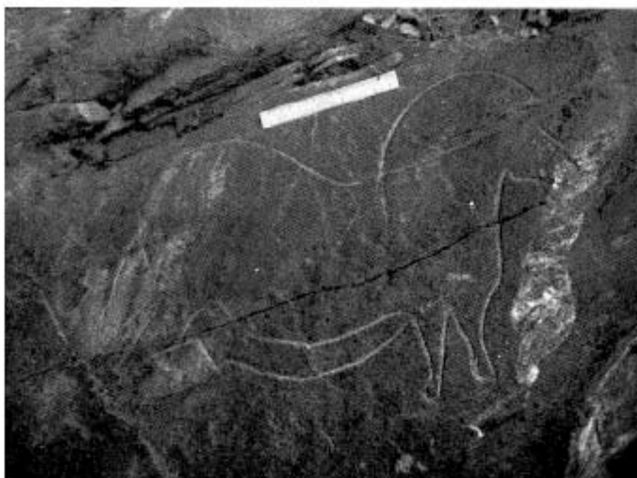
3 — Gravura paleolítica de Mazouco, representando um cavalo (a escala mede c. de 15 cm).