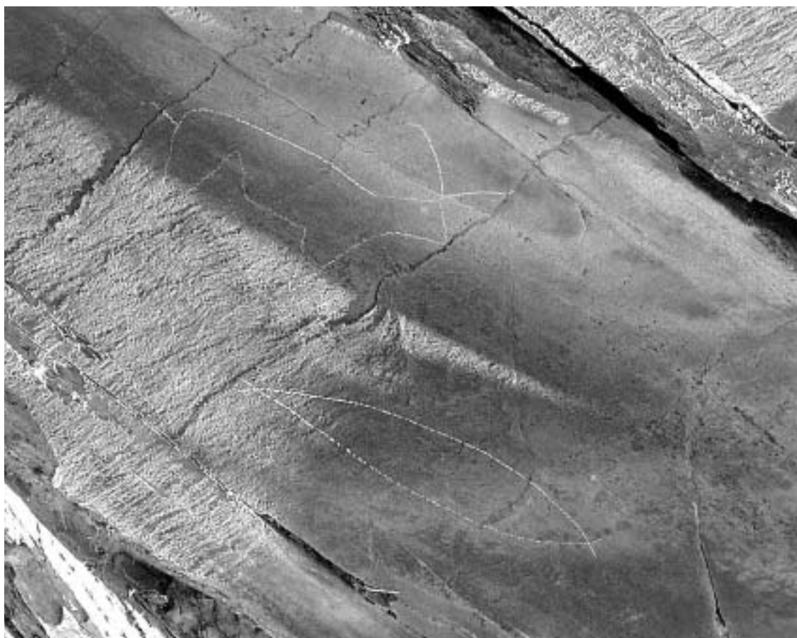
Fig. 9 Motivos “naive” (uma cabra e um peixe) gravados numa superfície xistosa da Penascosa.

Para os parceiros e comunidade locais a ideia de proteger as gravuras é de aceitação algo problemática. Se o desenvolvimento da região é um desiderato em que todos estão de acordo, os diversos meios propostos para o atingir são um pouco mais contraditórios. Os equívocos presentes no processo de criação do PAVC e as promessas governamentais não cumpridas levaram à existência de um clima de desconfiança entre o Parque, apercebido como uma entidade governamental exógena, e a comunidade. Os objectivos do PAVC são, no entanto, claros: protecção e apresentação pública das gravuras. Evidentemente que o fluxo de visitantes gerado pela existência de uma atracção turística como o Parque pode ser, e é já, um importante factor de desenvolvimento, mas nunca poderá ser o único. Do mesmo modo, as funções do Parque não passam pela construção