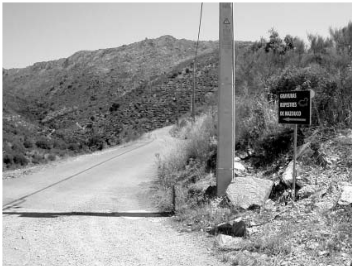
Fig. 8 Estrada de acesso ao sítio de Mazouco.