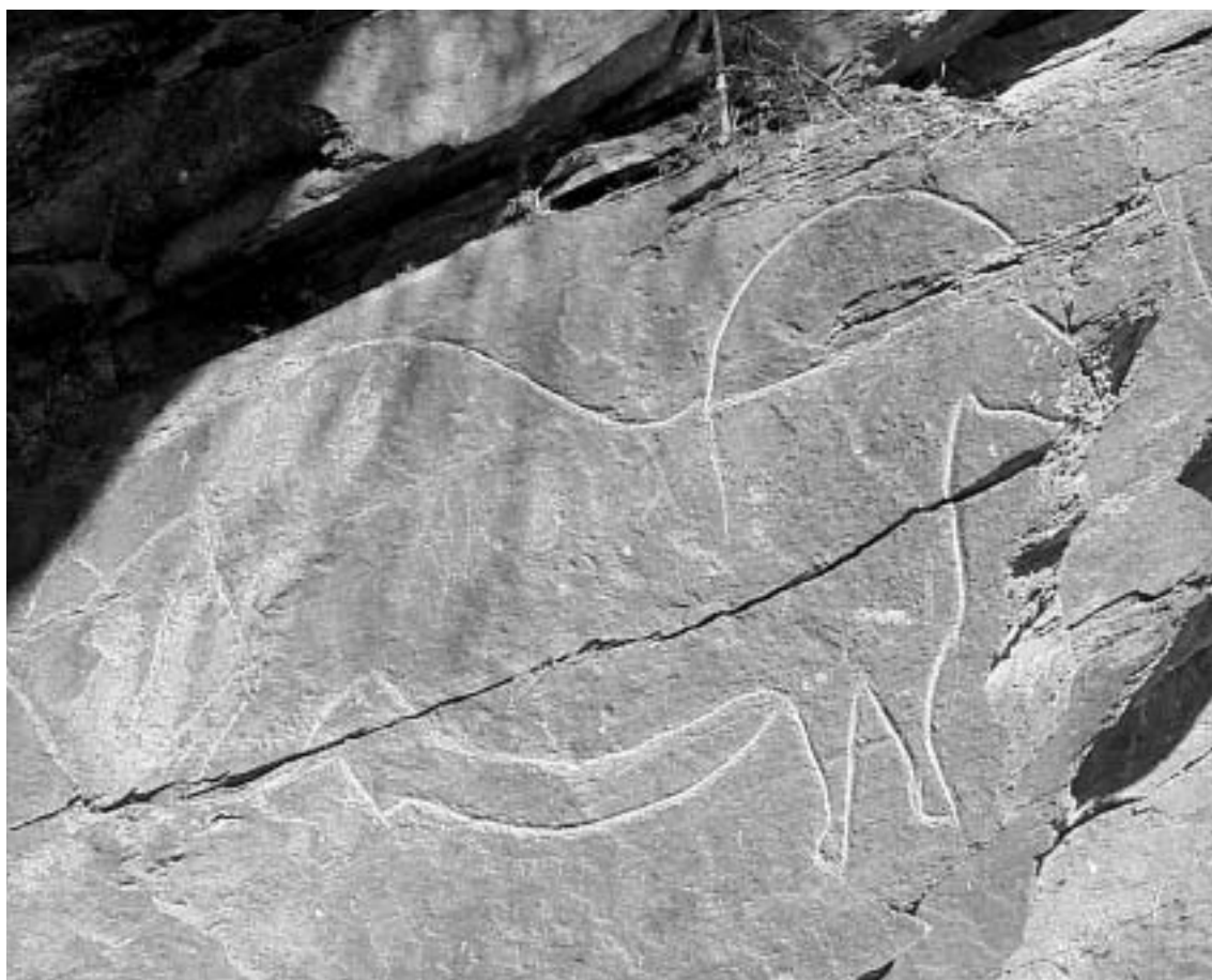
Fig. 11 Presente estado do “Cavalo de Mazouco”. De notar a “brancura” das linhas do motivo, resultado dos reavivamentos contínuos sofridos. De notar também a evidente discrepância entre as linhas do Cavalo e os traços de outra figura paleolítica, menos “renovada”, situada em frente da cabeça do Cavalo. São também visíveis alguns grafitos inscritos dentro do corpo do Cavalo.