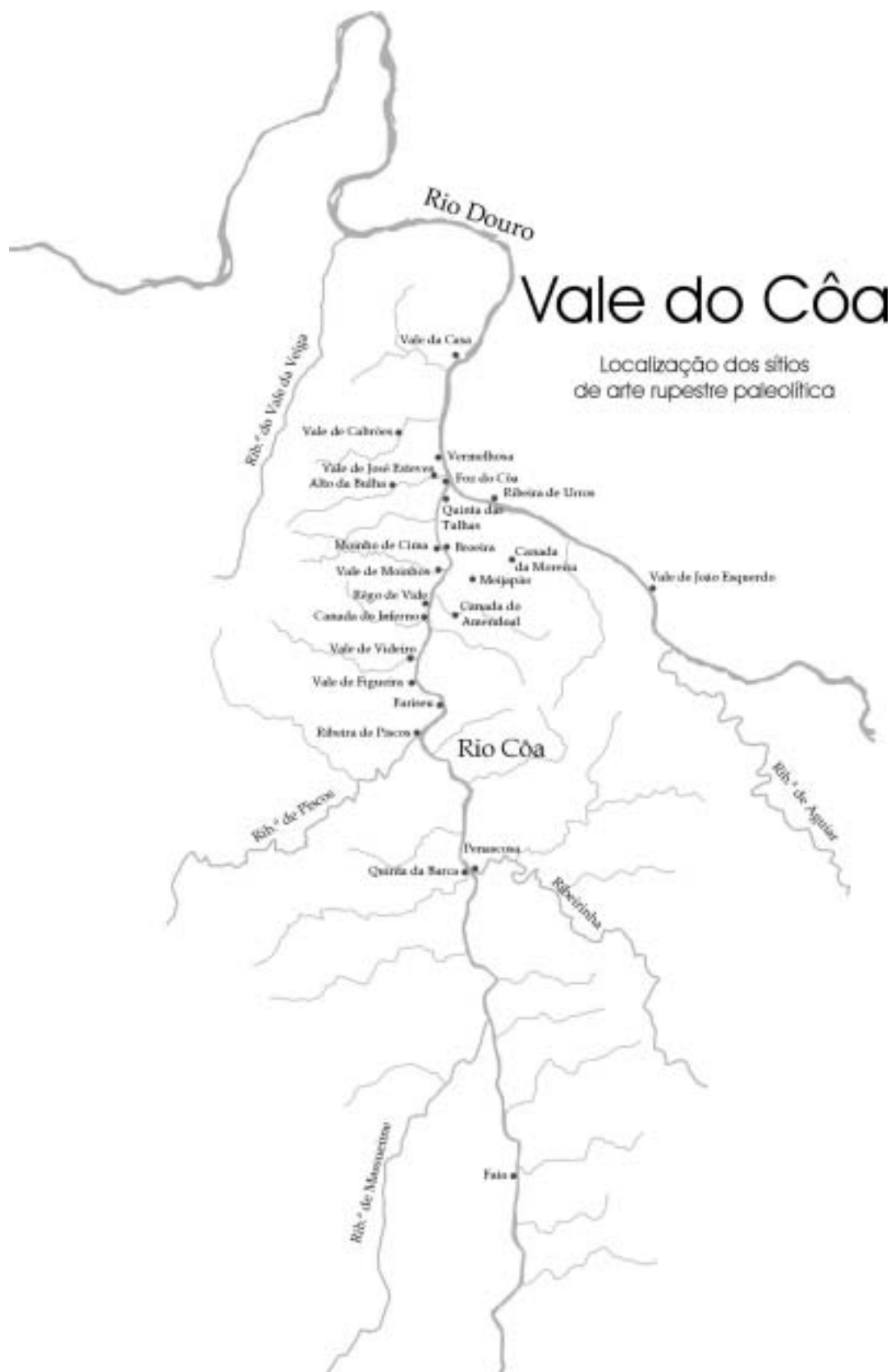
Fig. 3 Localização dos SARAL do Vale do Côa (mapa de Luís Luís).