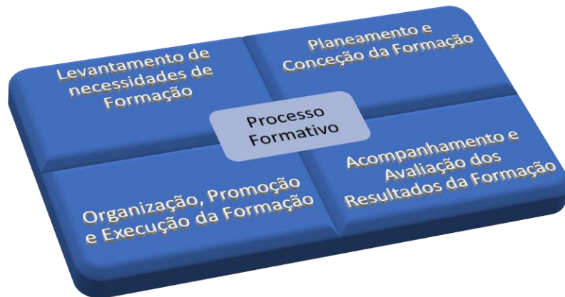
Figura 1 - Processo Formativo