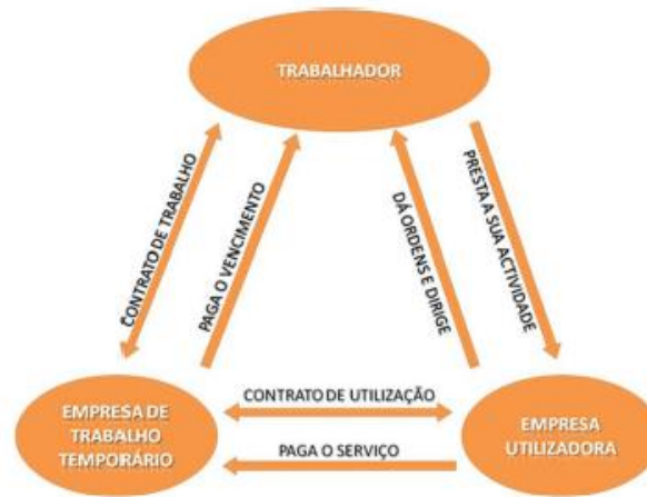
Figura 3 - Triângulo do trabalho temporário