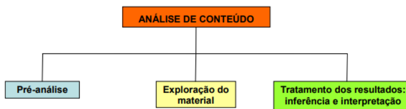
Figura 5 - Três fases da Análise de Conteúdo

A análise de conteúdo é uma das técnicas de tratamento de dados. Segundo Bardin (2011) este tipo de análise prevê 3 fases importantes: pré-análise, exploração do material e tratamento dos resultados, a inferência e a interpretação.