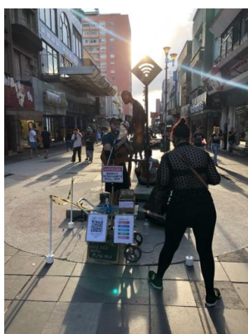
Figura 4 - Exemplo de atuação