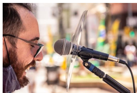
Figura 3 - Barreiras de distanciamento/ espaço adequado