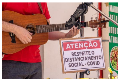
Figura 2 - Aviso de distanciamento (Fonte: Entrevistado B) Entrevistado B)

Através das imagens abaixo, temos exemplos de como o músico utiliza essas opções durante suas atuações.