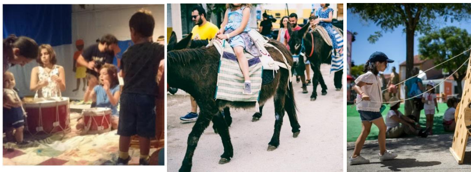
Ilustração 6 Atividades para os mais jovens durante o evento