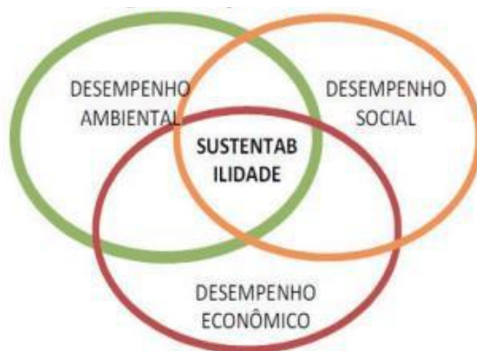
Ilustração 1 três dimensões da sustentabilidade

Ademais, salienta-se que o maior desafio para as organizações está no sentido de manter essas linhas em equilíbrio e focadas nas metas e objetivos (Becker et al., 2015). Esta citação destaca um dilema enfrentado pelas organizações para equilibrarem as três dimensões, económica, social e ambiental, e continuarem a conseguir manter os seus objetivos e metas, sem favorecer uma dimensão em prol de outra, ou seja, manter o lucro financeiro sem prejudicar o impacto social e ambiental positivo.