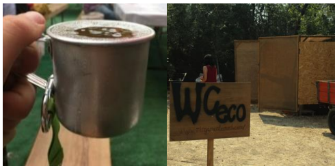
Ilustração 5 medidas adotadas no festival para minimizar impacto ambiental

Fonte: foto cedida por um participante (2018)