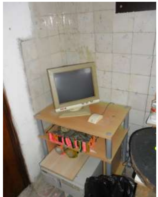
Figura 76 - Escritório