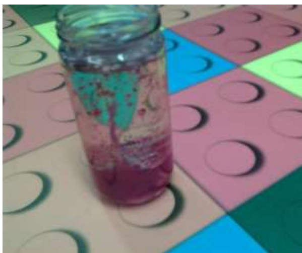
Figura 54 – Experiência “lâmpada de Lava”