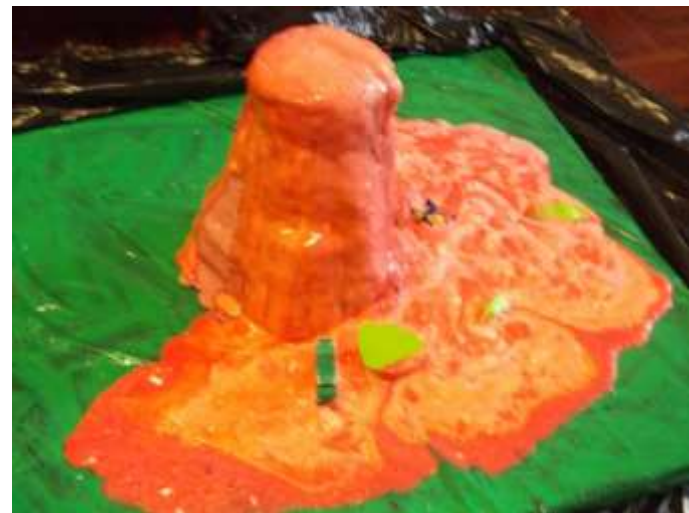
Figura 37 – Experiência do vulcão