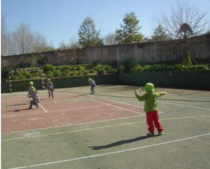
Figura 8 – Jogo “Raposa e do Caçador”