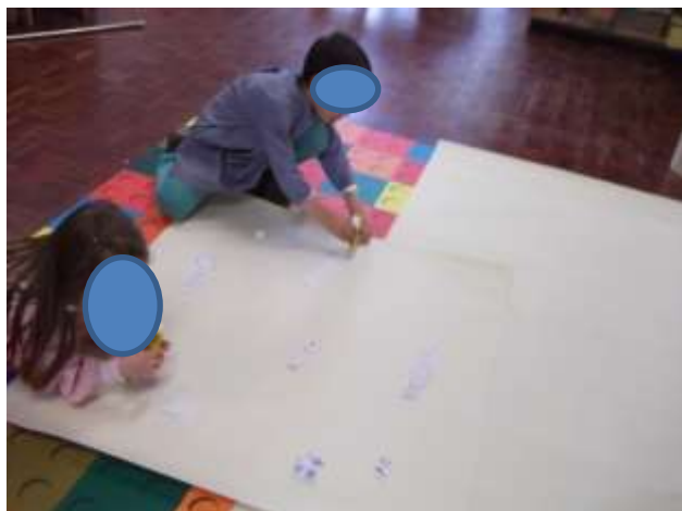
Figura 39 – Teia de ideias