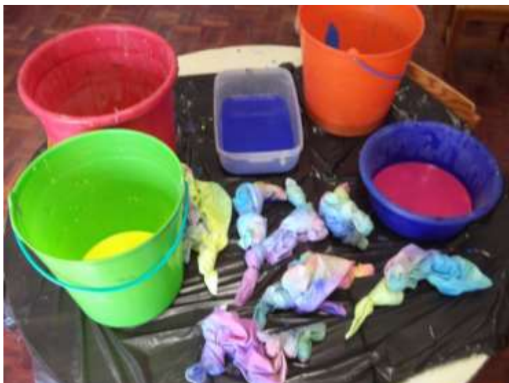
Figura 68 – Almofadas tingidas