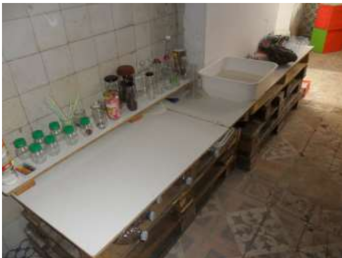
Figura 75 – Banca das ciências