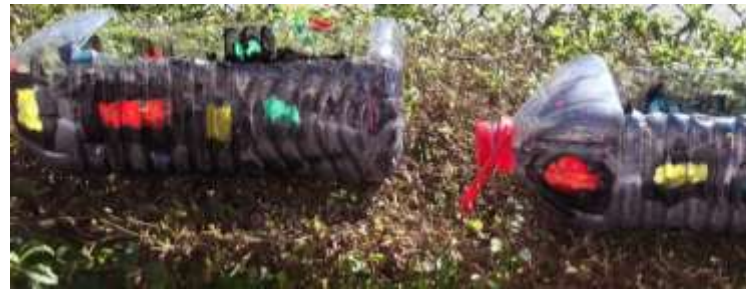
Figura 65 – Terrário