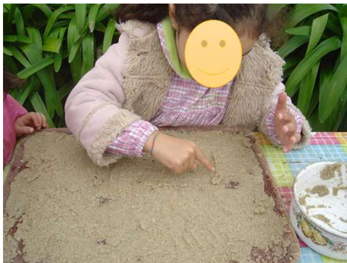
Figura 14 – Escrita por parte das crianças do nome do pai