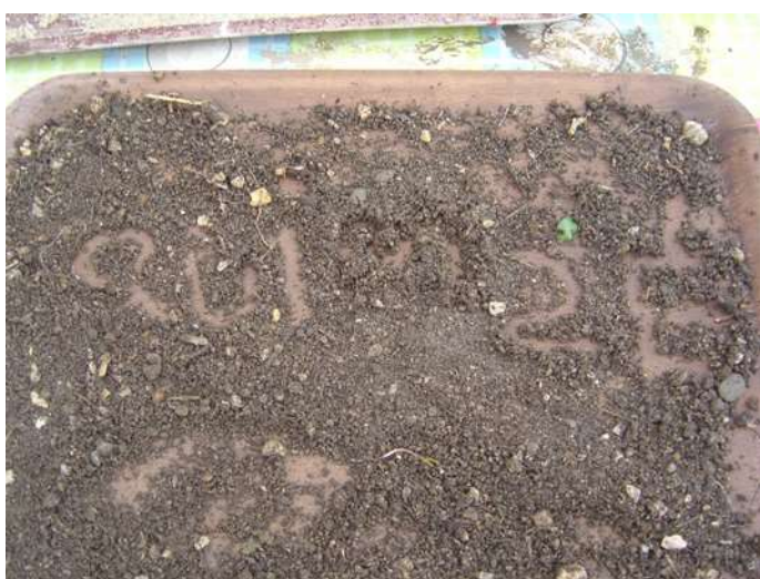
Figura 15 – Trabalho final do “Nome do meu Pai”