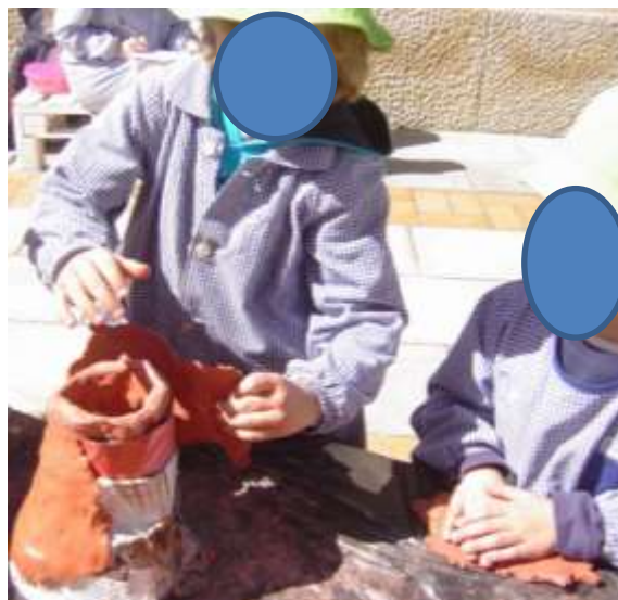
Figura 29 – Construção do vulcão