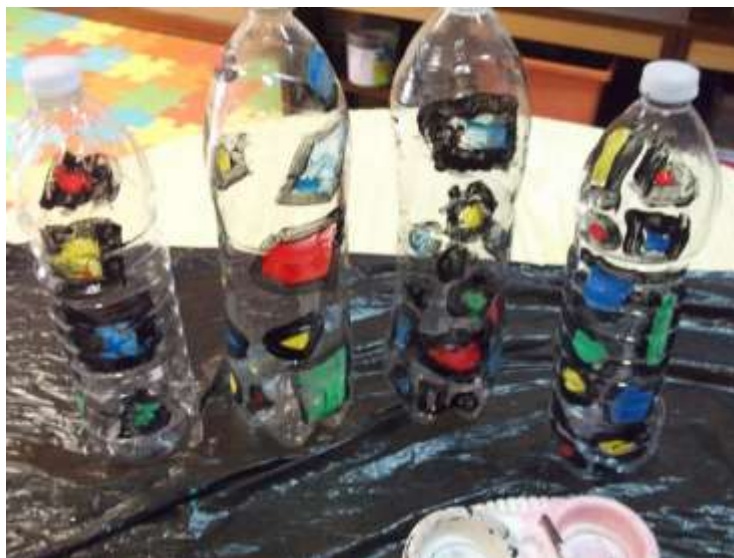
Figura 61 – Estufa e Terrário