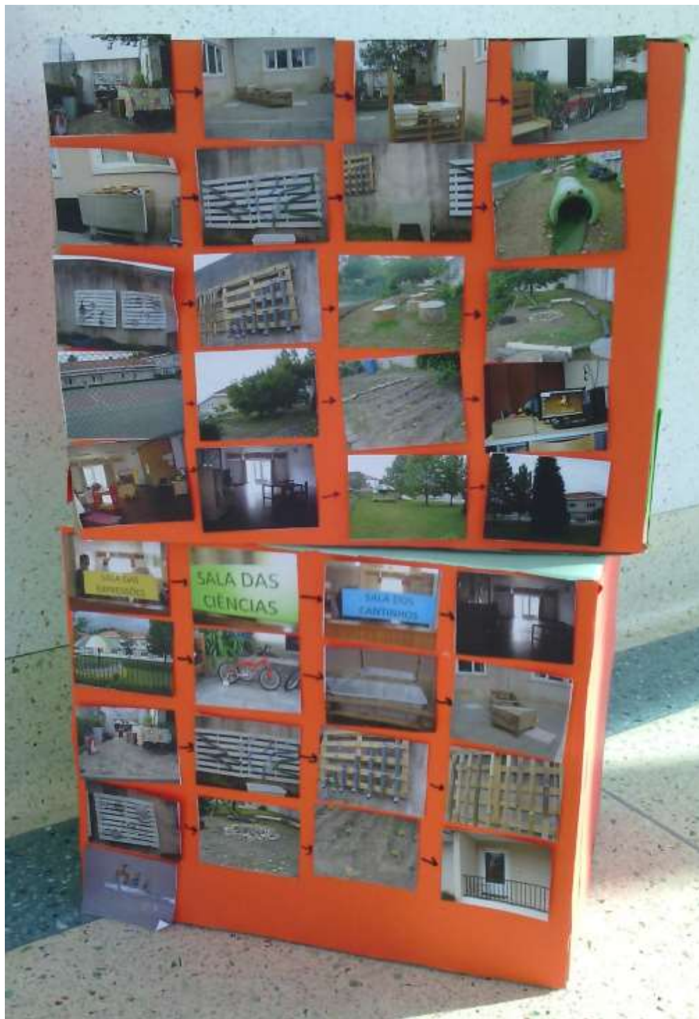
Figura 80 – Manta Mágica