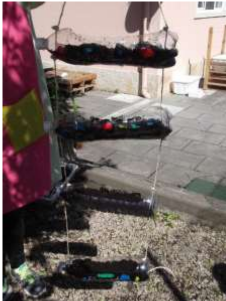
Figura 64 - Estufa