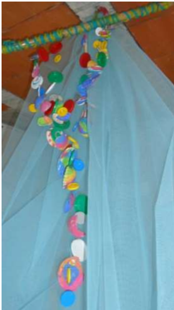
Figura 72 – Espanta espíritos