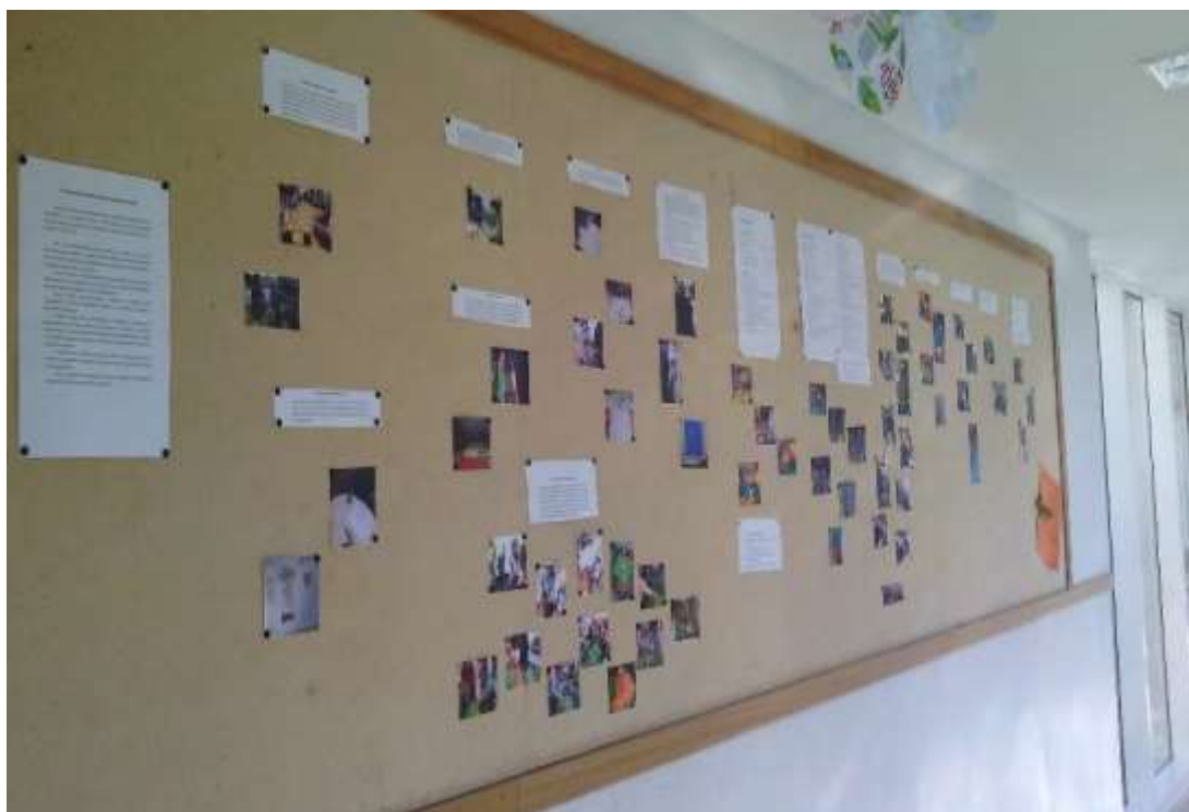
Figura 79