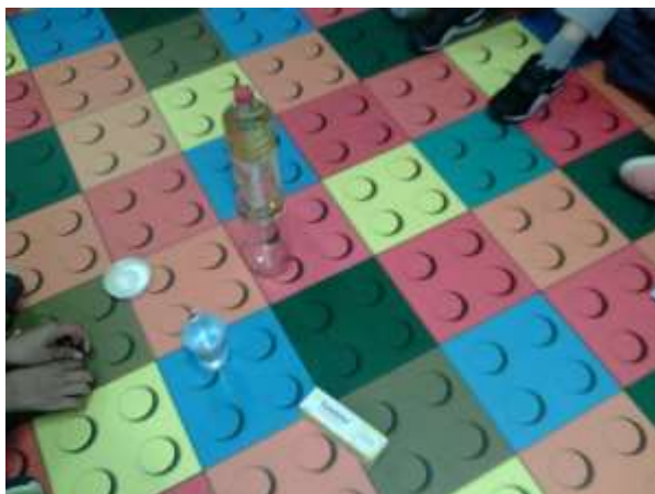
Figura 50 – Experiência “Lâmpada de Lava”