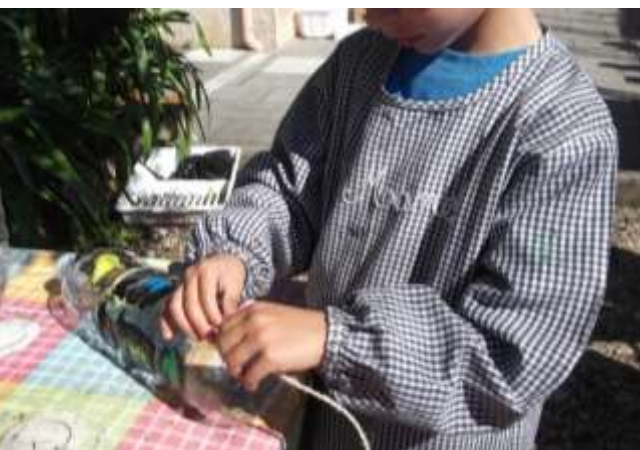
Figura 62 – Preparação da estufa