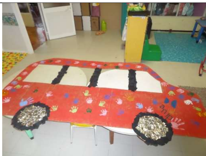
Figura 7 – Atividade “O autocarro” (resultado Final)