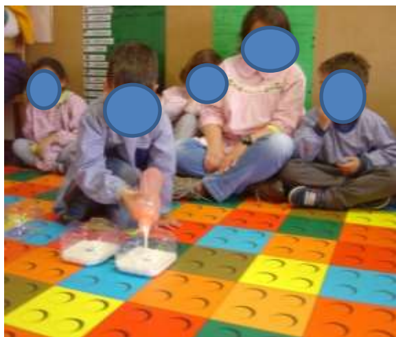
Figura 46 – Experiência “Explosão de Cores”