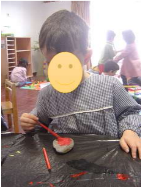
Figura 16 – Pinturas das peças do jogo do galo