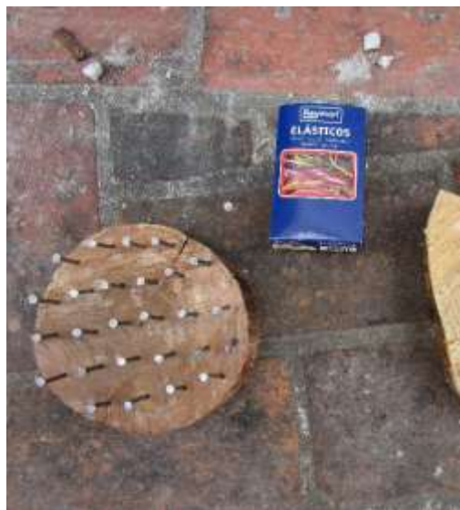
Figura 58 - Geoplano