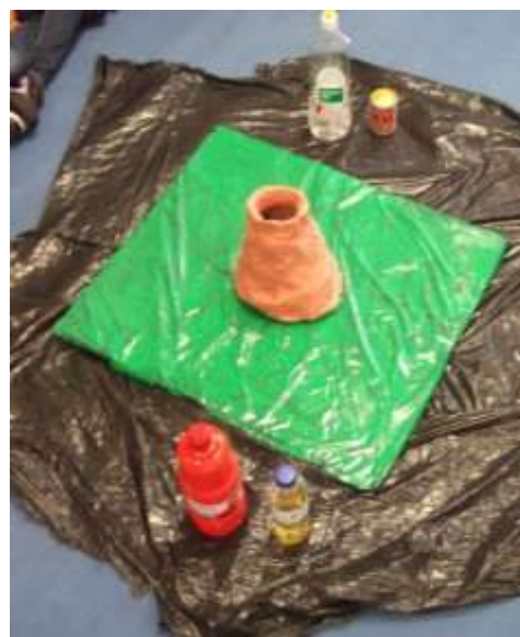
Figura 31 – Experiência do vulcão