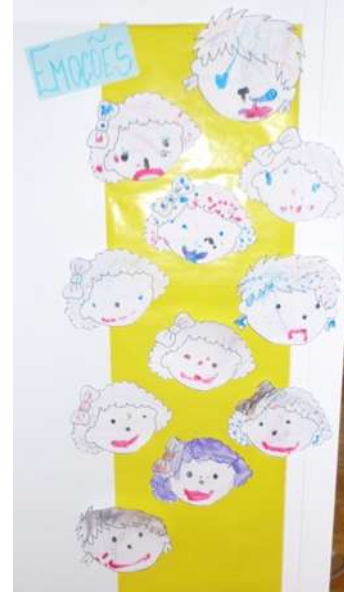
Figura 4 – Atividade “As emoções”