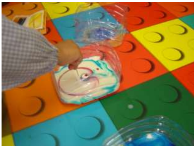
Figura 47 – Experiência “Explosão de Cores”