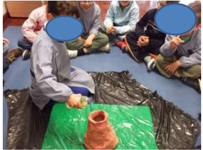
Figura 35 – Experiência do vulcão