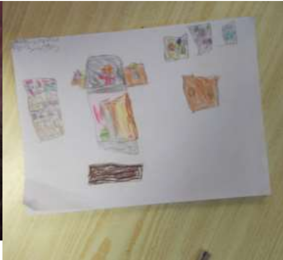
Figura 23 – Grafismo das divisões da casa