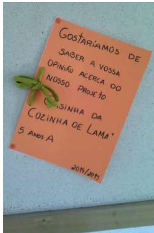
Figura 78 – Livro de opiniões