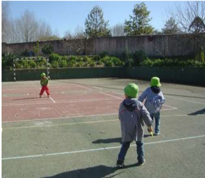
Figura 9 – Jogo do “Camaleão”