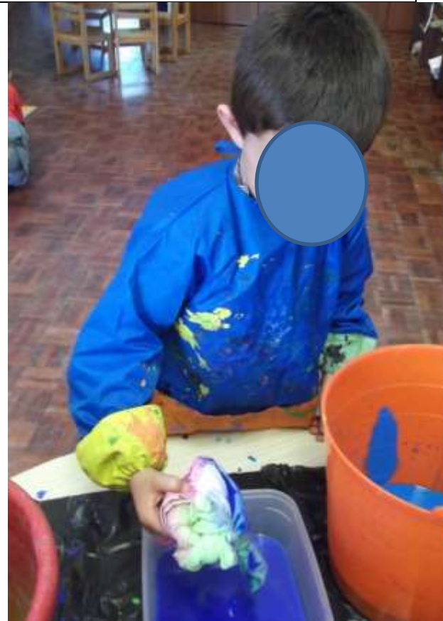
Figura 67 – Almofadas tingidas