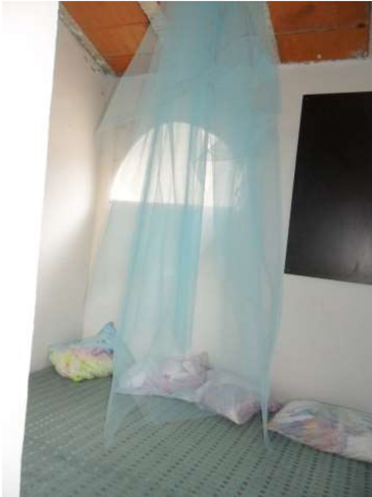
Figura 73 – Quarto relaxante