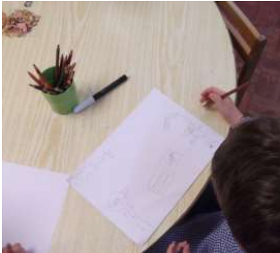
Figura 22 – Grafismo das divisões da casa