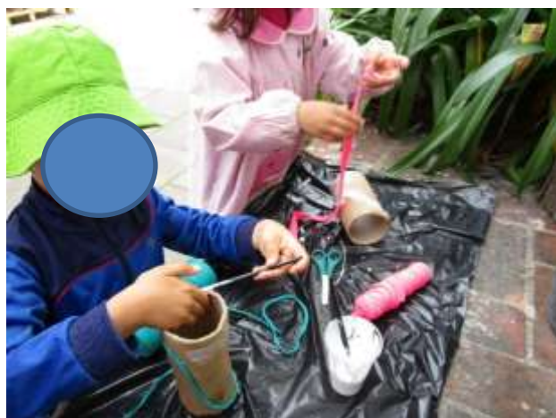
Figura 55 – Jogo da soma