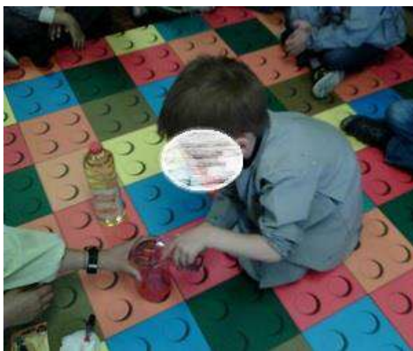
Figura 52 – Experiência “Lâmpada de Lava”