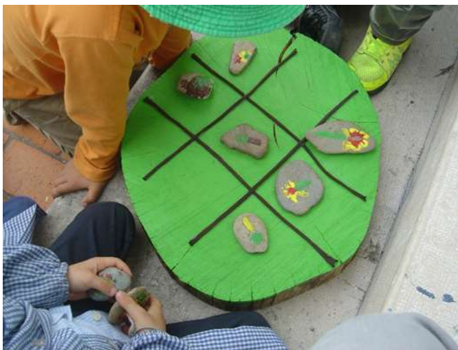
Figura 18 – Resultado Final