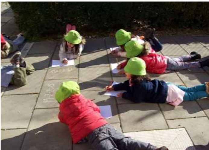
Figura 12 – Grafismo da história no exterior