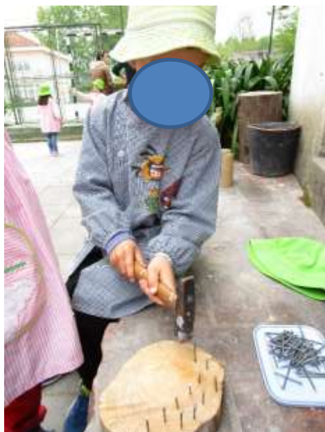
Figura 57 - Geoplano