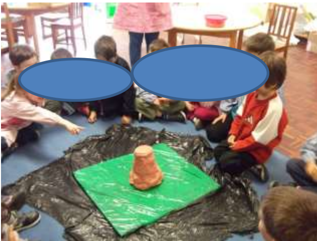
Figura 36 – Experiência do vulcão