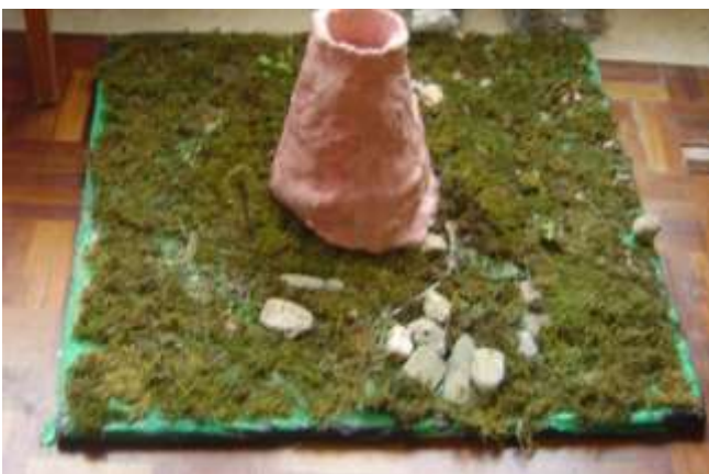
Figura 38 – Experiência do vulcão