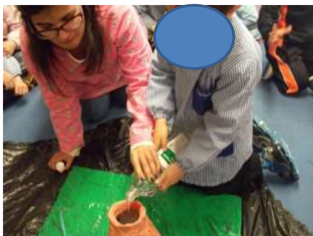
Figura 33 – Experiência do vulcão