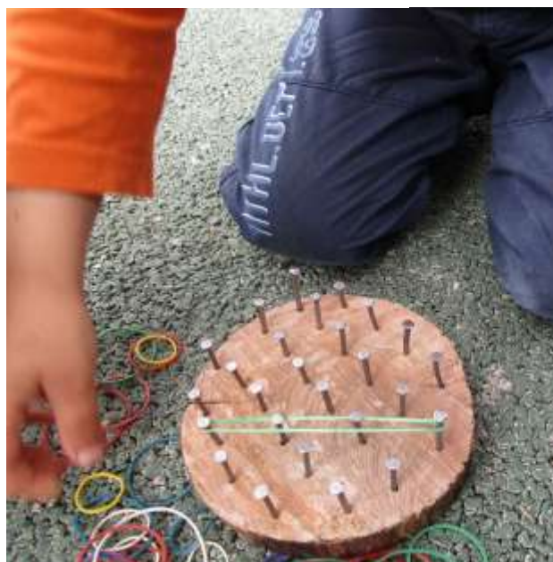
Figura 59 - Geoplano