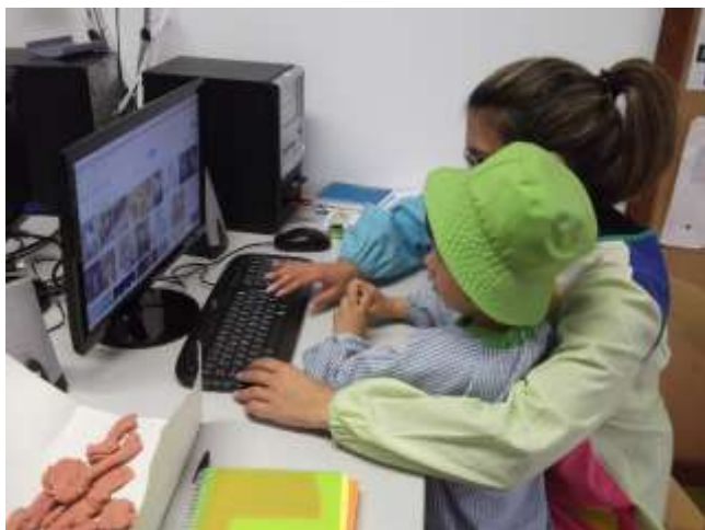
Figura 43 – Pesquisa para os quadros para decoração