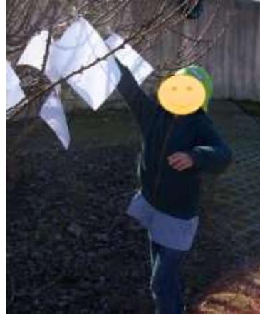
Figura 11 – Recolha das folhas A4 na árvore