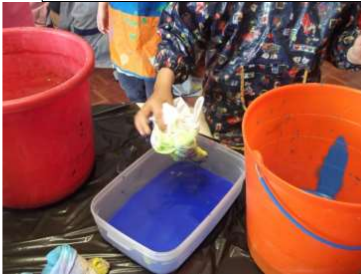
Figura 66 – Almofadas tingidas