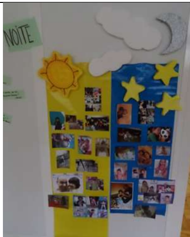
Figura 3 – Atividade “O dia e a noite”