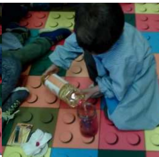
Figura 53 – Experiência “lâmpada de Lava”