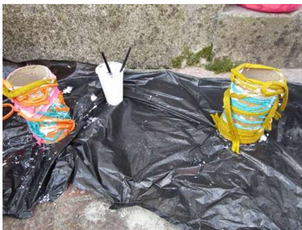
Figura 55 – Jogo da soma