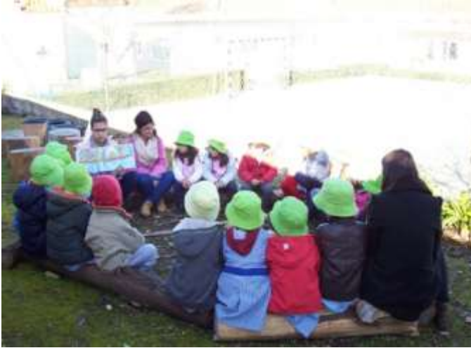
Figura 10 – Leitura da história “A Árvore das folhas A4”