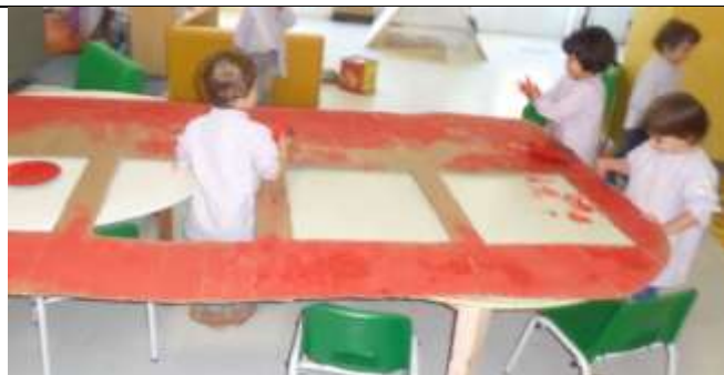
Figura 5 – Atividade “O autocarro” (pintura)