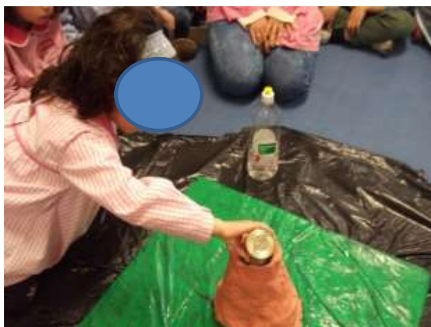
Figura 32 – Experiência do vulcão