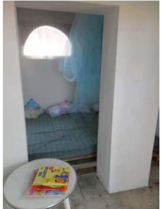
Figura 74 – Quarto relaxante