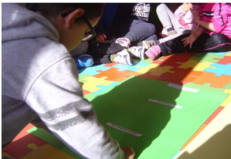
Figura 26 – Semáforo de ideias