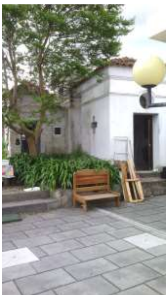
Figura 21 – Local exterior da Casinha da Cozinha de Lama