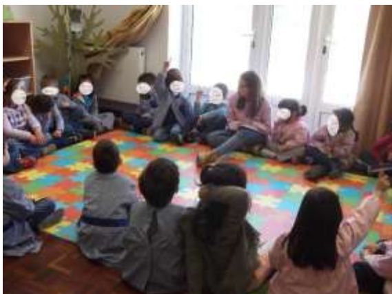
Figura 19 – Negociação para o projeto