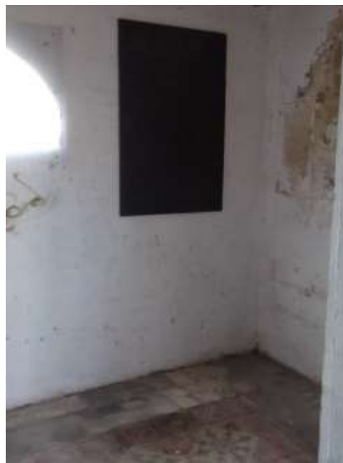
Figura 20 – Local interior da Casinha da Cozinha de Lama