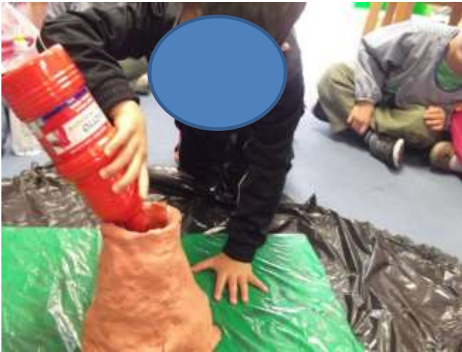
Figura 34 – Experiência do vulcão