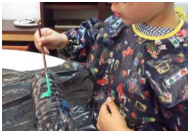
Figura 60 – Estufa e terrário