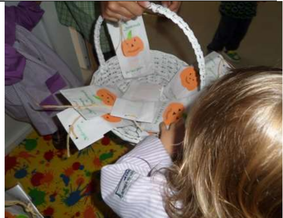
Figura 2 – Atividade do Dia das Bruxas