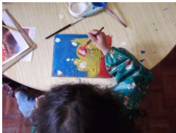
Figura 44 – Elaboração dos quadros