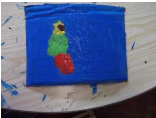
Figura 45 – Um dos resultados finais