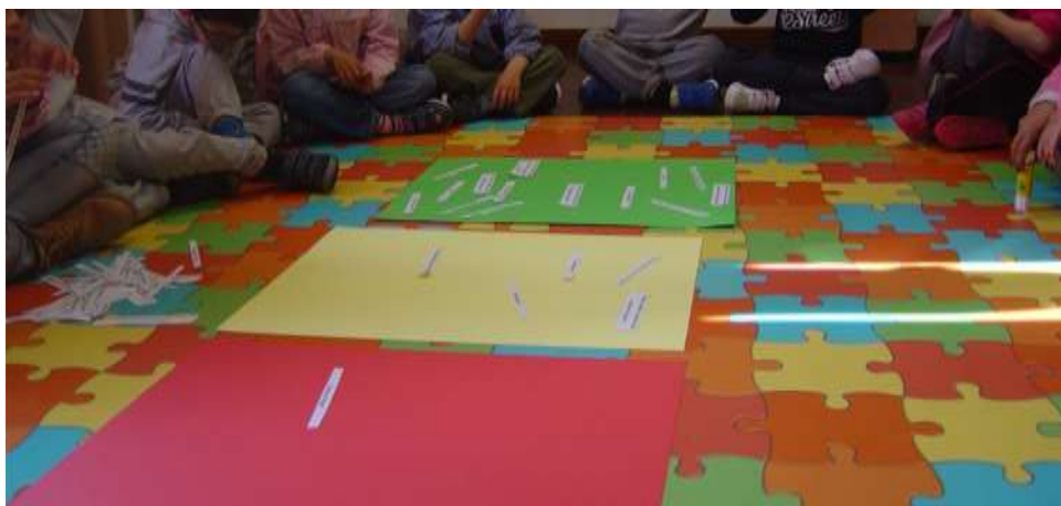
Figura 27 – Semáforo de ideias