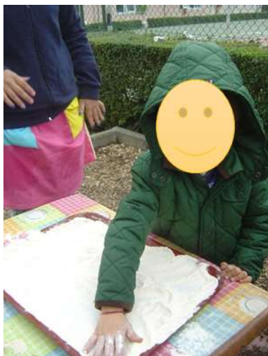
Figura 13 – Preparação da atividade “Nome do meu Pai”