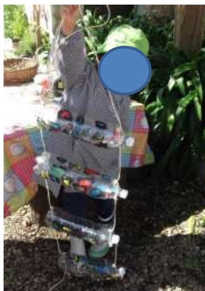
Figura 63 - Estufa