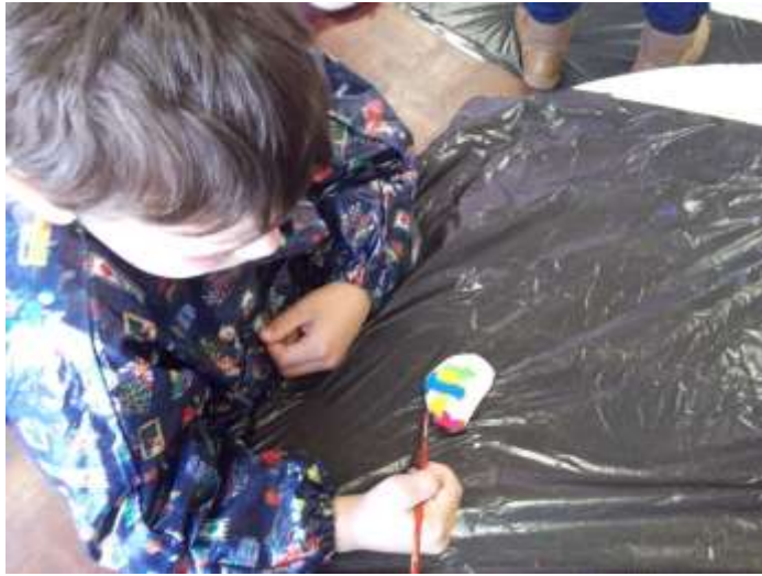
Figura 70 – Pintura de conchas para o espanta espíritos