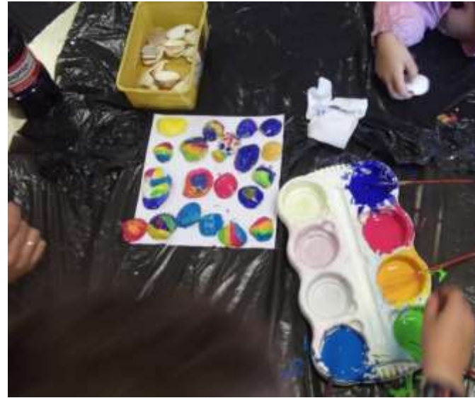
Figura 71 – Pintura de conchas para o espanta espíritos