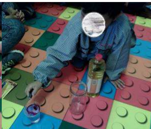
Figura 51 – Experiência “Lâmpada de Lava”