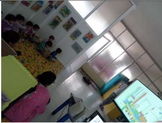
Figura 1 – Atividade do Dia das Bruxas