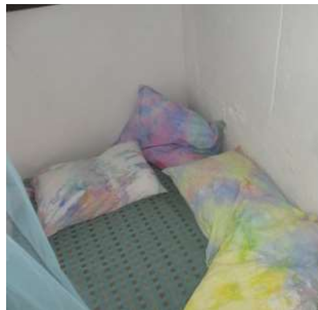
Figura 69 – Almofadas tingidas