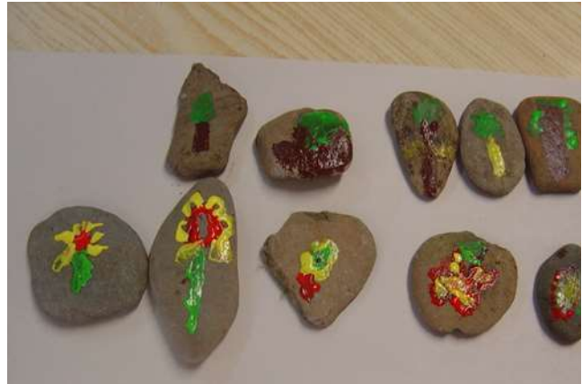
Figura 17 – Algumas peças já pintadas