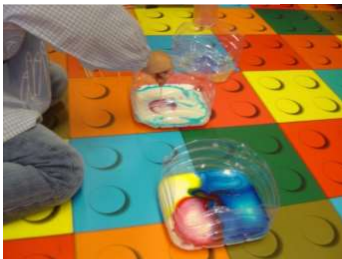
Figura 48 – Experiência “Explosão de Cores”