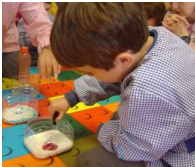
Figura 46 – Experiência “Explosão de Cores”