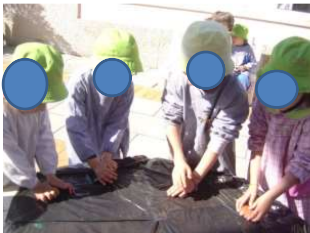
Figura 28 – Construção do vulcão