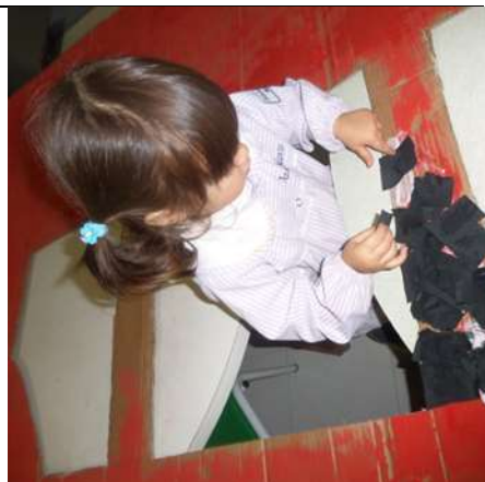
Figura 6 – Atividade “O autocarro” (colagem)