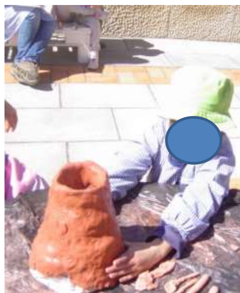
Figura 30 – Construção do vulcão