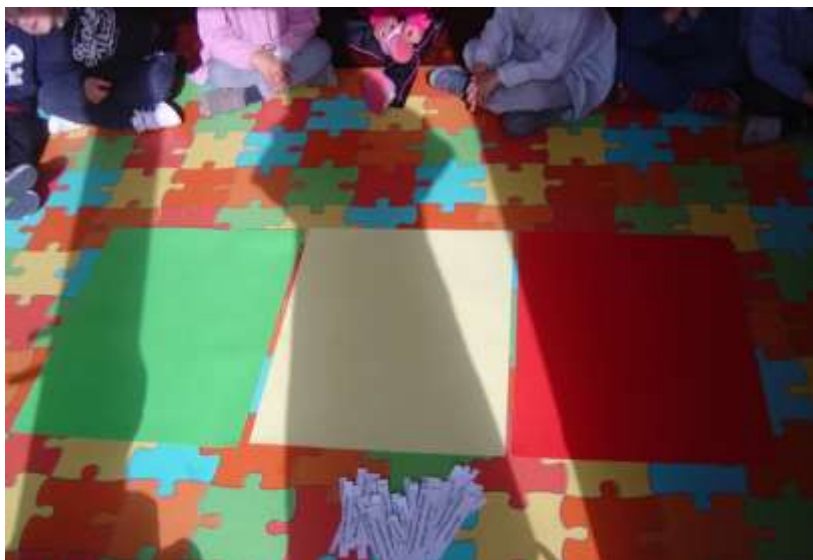
Figura 25 – Semáforo de ideias