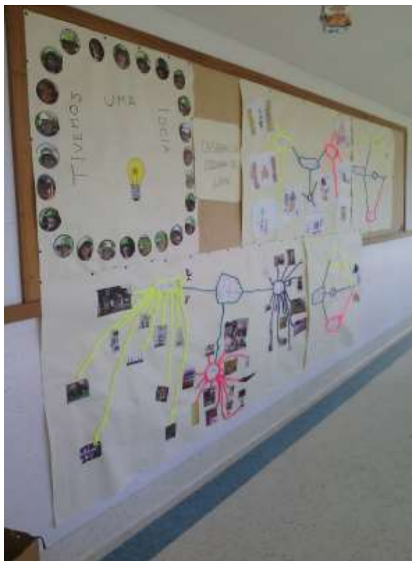
Figura 77