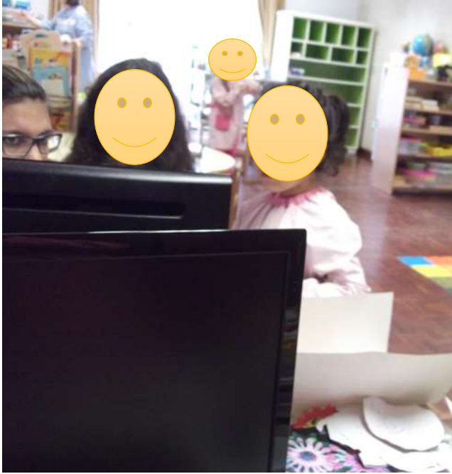
Figura 24 – Pesquisa