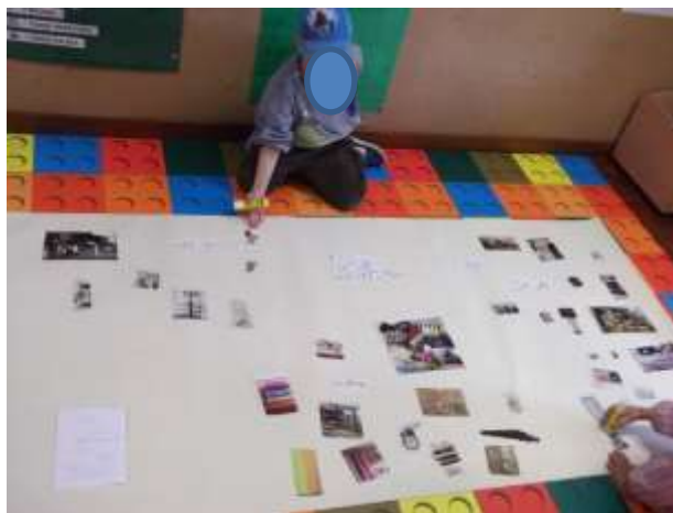
Figura 40 – Teia de ideias