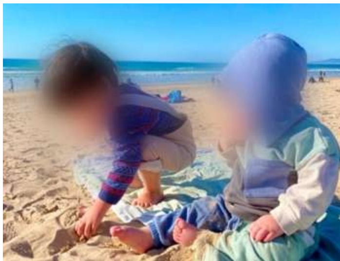
Apêndice 6 – Fotografia apresentada na atividade de Creche: Conexões visuais Fotografias das Famílias