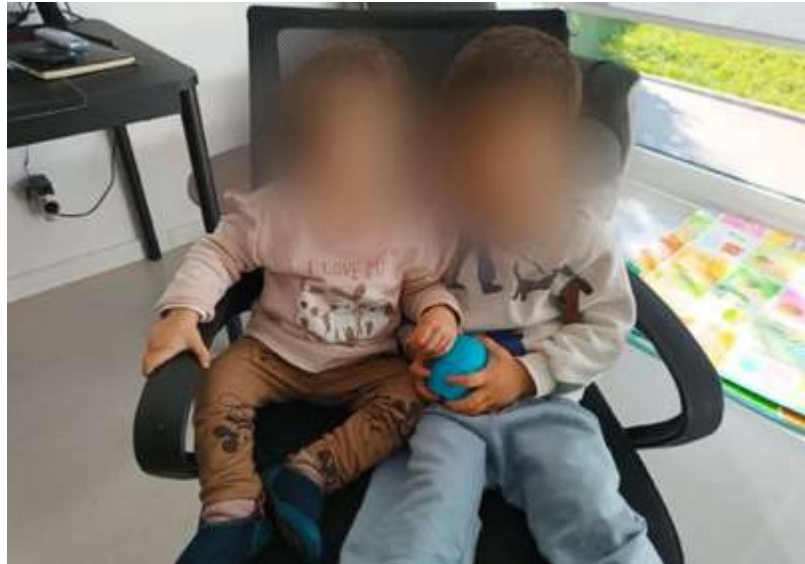
Apêndice 8– Fotografia apresentada na atividade de Creche: Conexões visuais Fotografias das Famílias