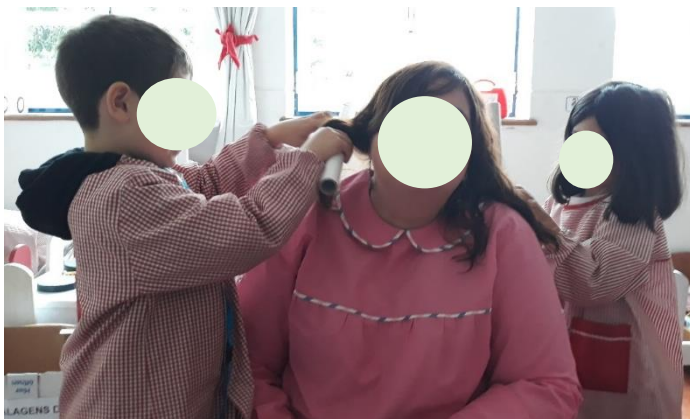
Figura 21 - Salão de Cabeleireiro