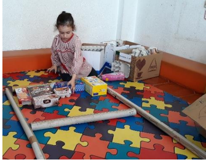
Figura 23 - Delimitação e Preenchimento de um Espaço