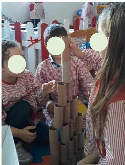
Figura 15 - Pirâmide