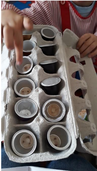
Figura 24 - Atribuição de Objetos a um Espaço