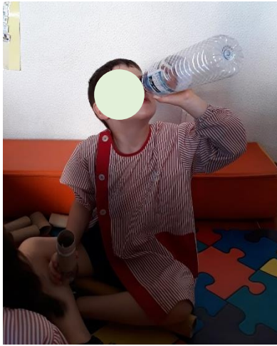
Figura 12 - Observar através de Objetos