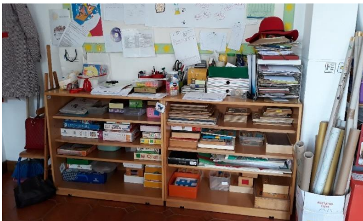
Figura 4 - Área dos Jogos de Mesa