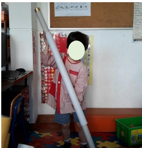
Figura 9 - Manipulação de Objetos com Várias Dimensões