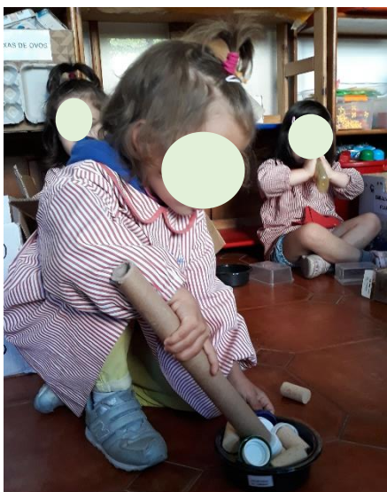
Figura 22 - Cozinhar