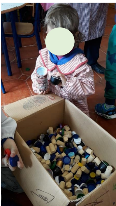
Figura 11 - Seleção de Objetos