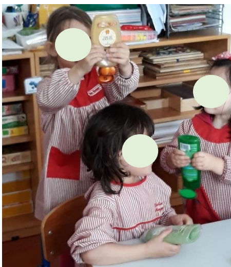
Figura 19 – Hábitos de Higiene