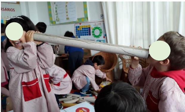
Figura 14 - O Som através de Objetos