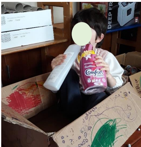
Figura 8 - O Cheiro