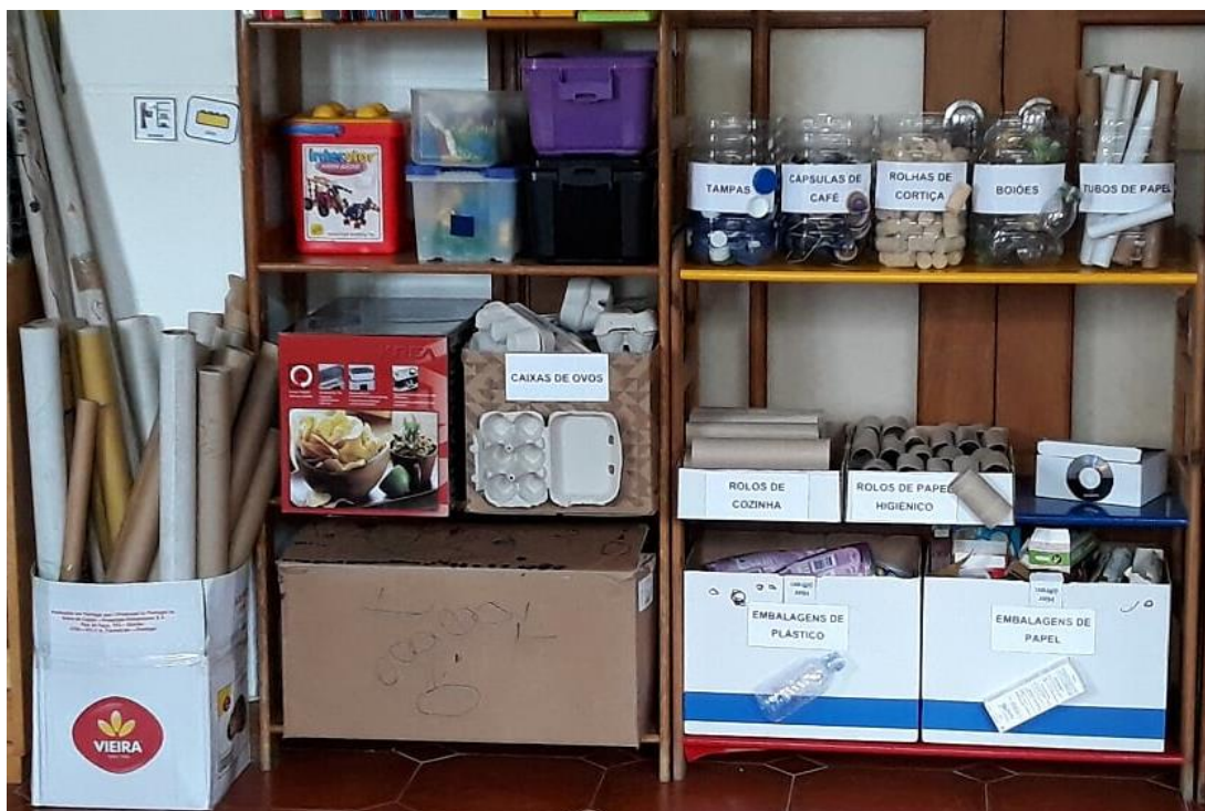
Figura 6 - Materiais Organizados na Nova Área