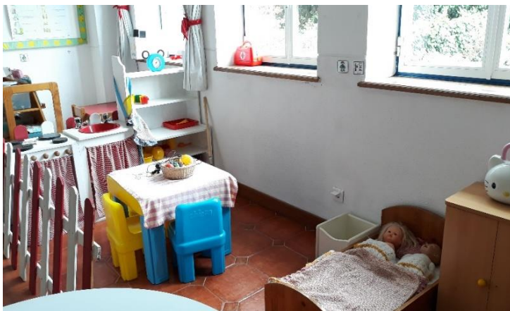
Figura 2 - Área da “Casinha das Bonecas”