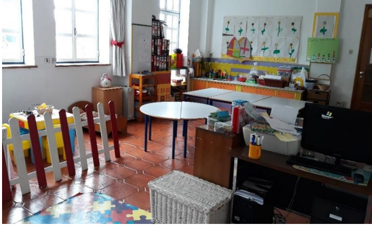
Figura 1 - Área das Mesas