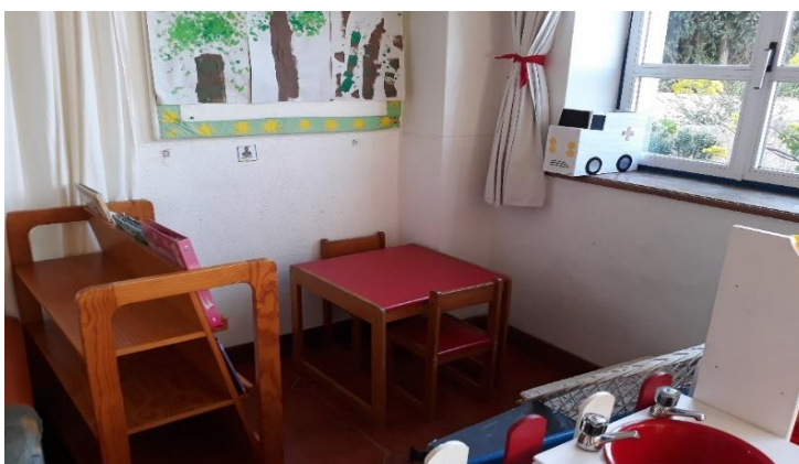
Figura 3 - Área da Biblioteca