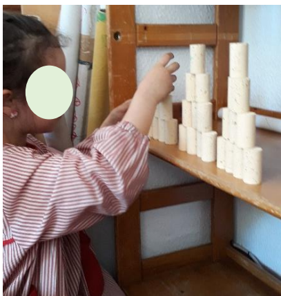
Figura 16 - Pirâmides