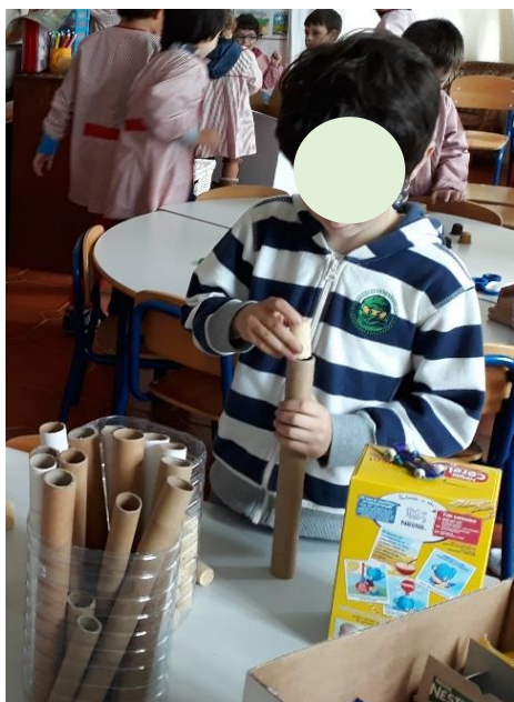
Figura 10 - Manipulação de Objetos com Várias Dimensões