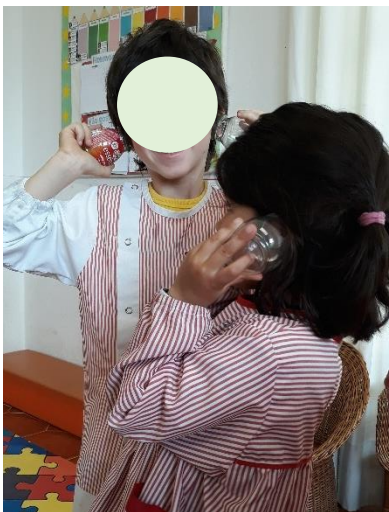
Figura 13 - O Som do Mar