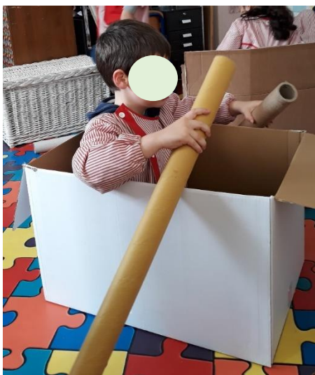
Figura 20 - O Barco