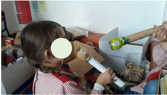
Figura 18 - Microfone