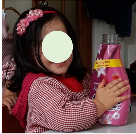
Figura 7 - Apertar Objetos