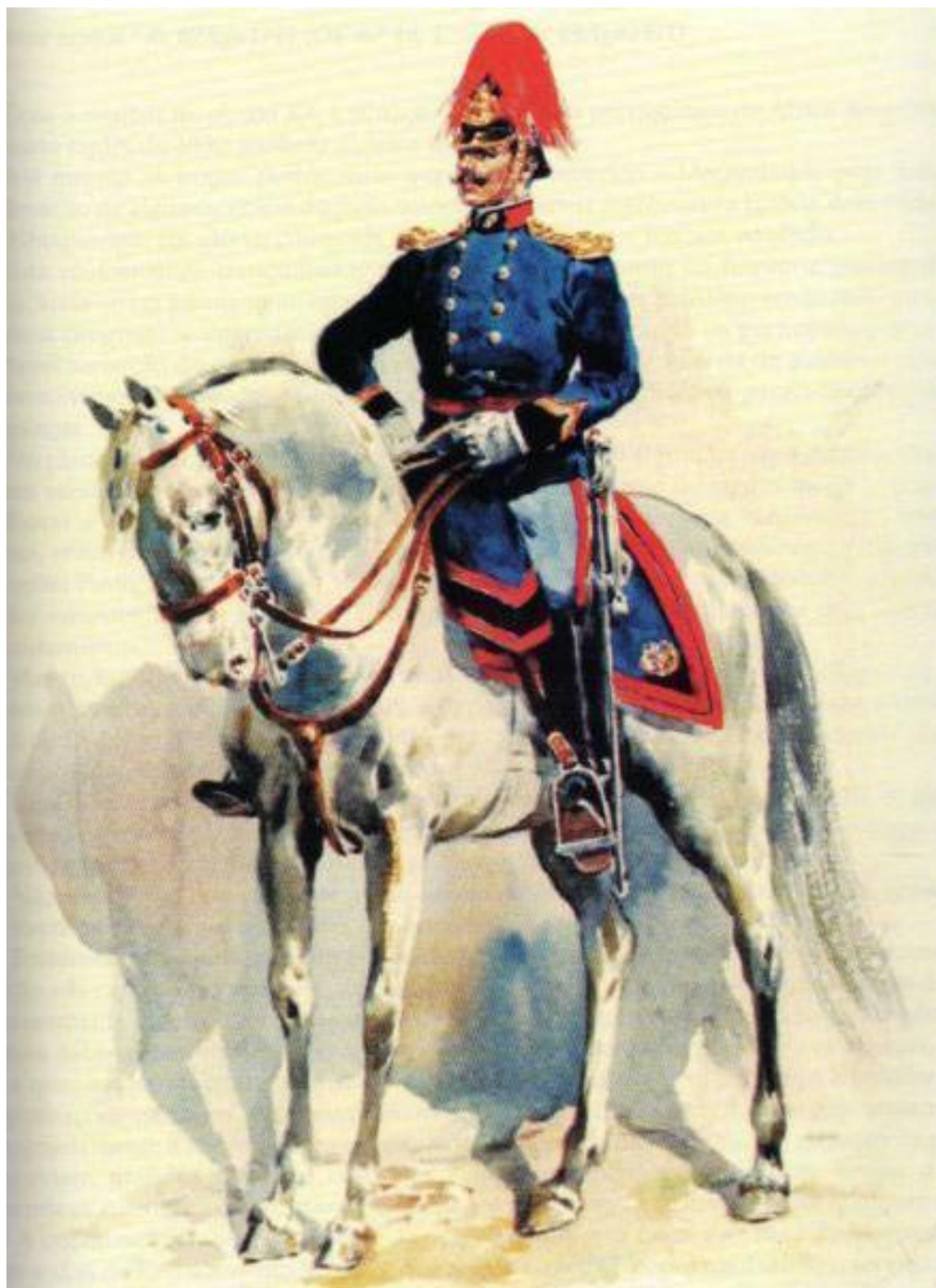
Figura 1- Capitão de Artilharia em 1903

MATOS, José Alberto da Costa, Os Uniformes da Artilharia Portuguesa , p. 120