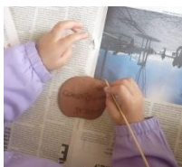
Figura 1 – Construção de relevos

A utilização de diferentes formas de linguagens (...) para representar o mesmo tema ou conceito, permite à criança desenvolver e aprofundar os seus conhecimentos acerca do mesmo (...) as crianças envolvidas num projeto são encorajadas a representar a mesma ideia através de diversas formas de representação... (Lino, 1996, p.102)