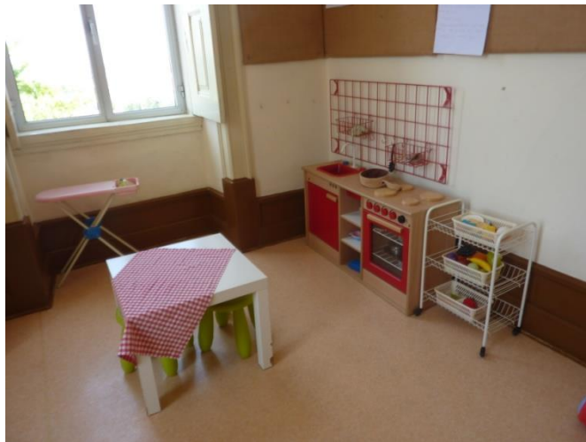
(Fotografia tirada pelo/a M., retratando o gosto pela casinha)

"Tem a casinha e o tapete, é diferente das outras salas!" (M)