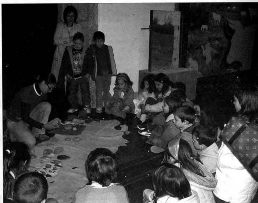
Oficina de Arqueologia experimental realizada na Guarda, no âmbito da Exposição "A Arte Que o Côa Guarda" (promovida pela Câmara Municipal da Guarda em colaboração com o PAVC).

Uma outra linha de actuação é a articulação com Siega Verde e a procura de uma maior ligação ao público do outro lado da raia. Neste contexto foi inaugurada recentemente uma exposição conjunta com a Junta de Castilla y León, subordinada ao tema da arte rupestre paleolítica ao ar livre, incluindo os sítios do Vale do Côa e de Siega Verde.