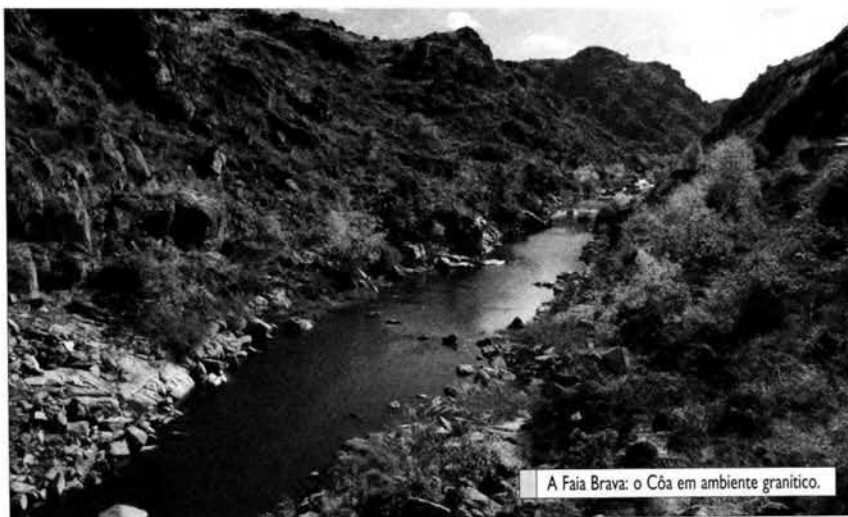
A Faia Brava: o Côa em ambiente granítico.

[ver referências desenvolvidas em Bibliografia final]