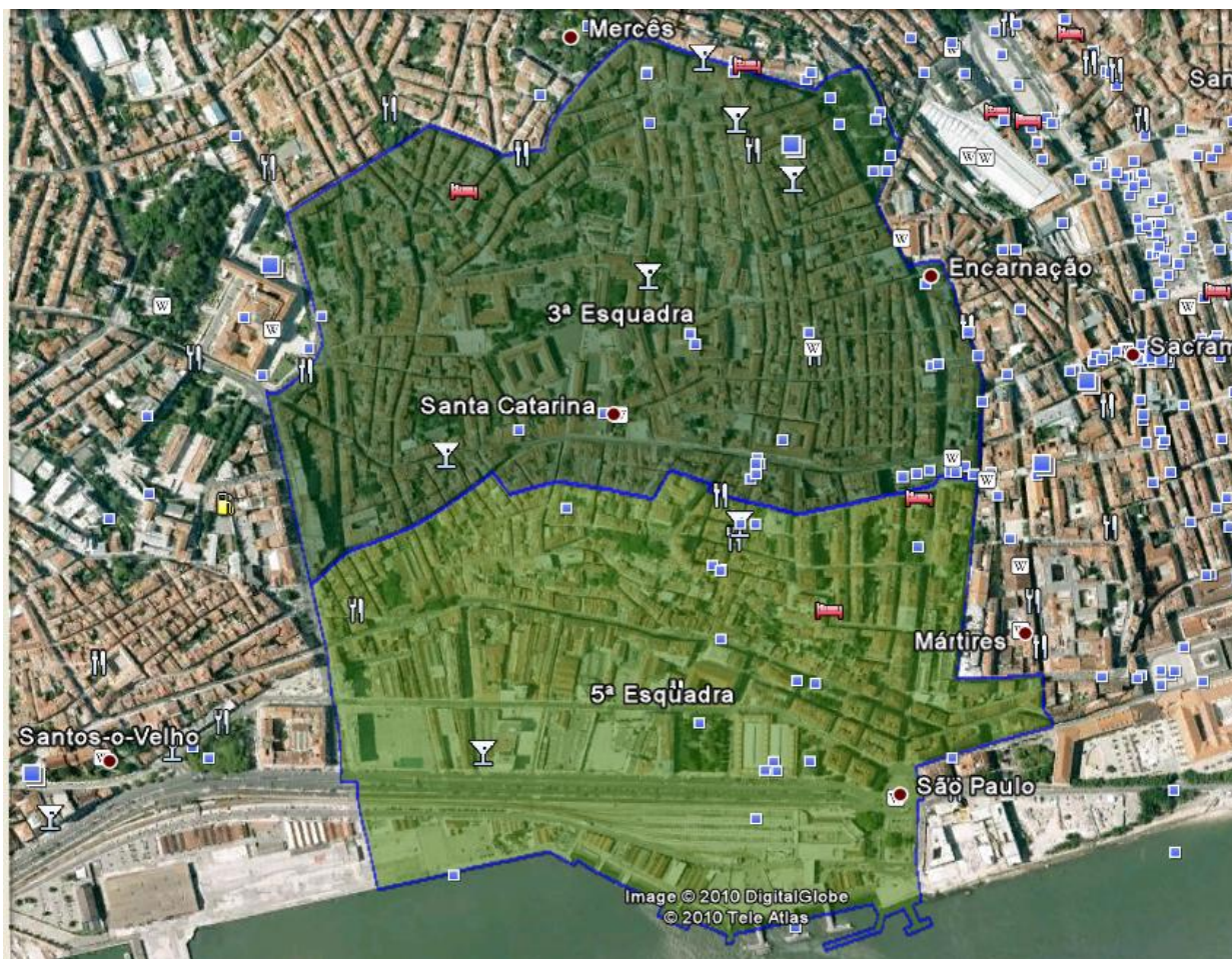
Legenda: Área da 3ª e da 5ª Esquadra (3ª. Bairro Alto; 5ª. Cais Sodré)