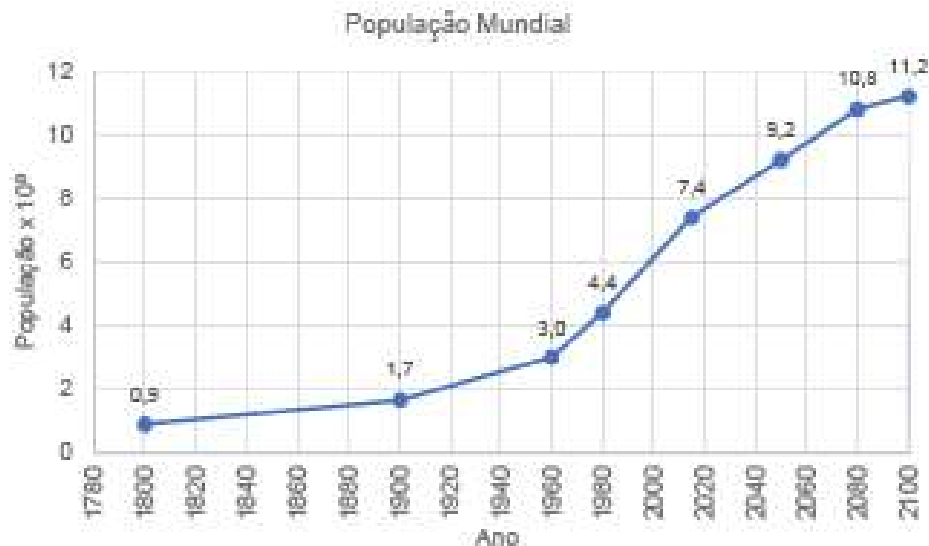
Figura 2 – Evolução da população mundial

prosperidade e bem-estar estão a ser utilizados a um ritmo que não permite a sua substituição. Por esta razão torna-se necessário insistir na eficiência dos recursos, ou seja, na necessidade de utilizar os recursos de forma mais sustentável. De um modo geral, as matérias-primas devem ser geridas de forma mais eficiente ao longo de todo o seu ciclo de vida, da extração à eliminação final.