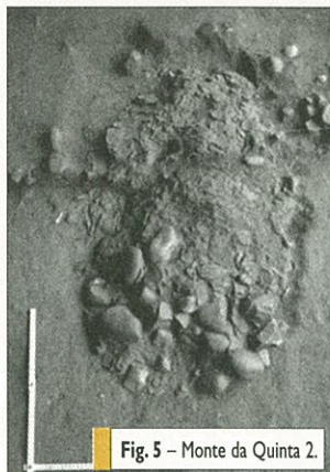
Fig. 5 - Monte da Quinta 2.

Susana Gómez Martínez [Campo Arqueológico de Mértola]