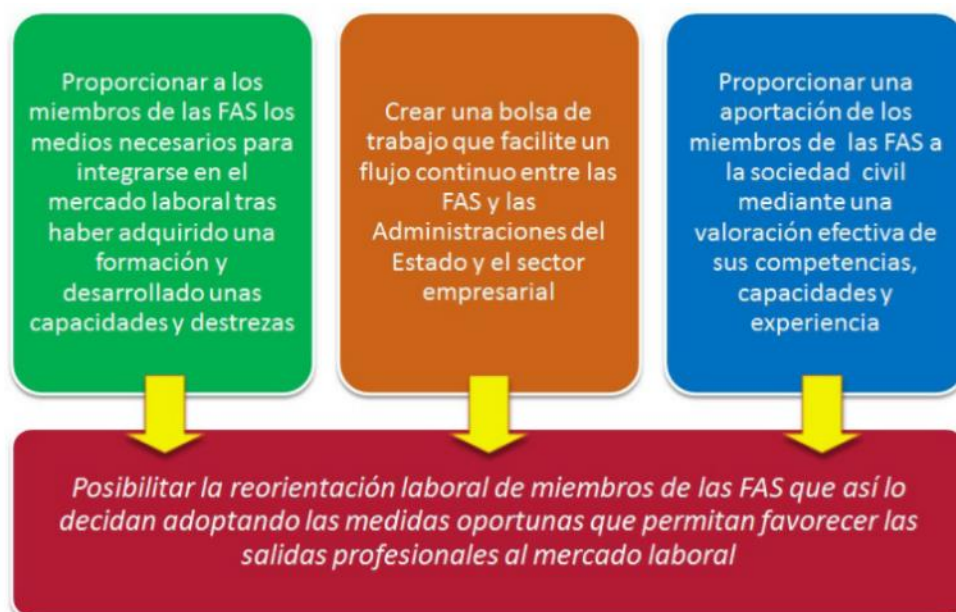
Figura 4 – Modelo de atuação do SAPROMIL

Este sistema tem por objetivo fornecer orientação profissional aos militares na fase final do seu contrato, através da aplicação de medidas de apoio e aconselhamento que facilitem a reinserção destes militares no mercado de trabalho civil. O SAPROMIL, como se pode verificar na Figura 4, tem o seu objetivo assente em três pilares: (i) proporcionar aos militares em final de contrato os meios necessários para se integrarem no mercado de trabalho civil, tendo em conta a formação, capacidades e experiência adquiridas durante o tempo ao serviço das FFAA; (ii) criar uma bolsa de trabalho que facilite o fluxo contínuo entre as FFAA, a Administração do Estado e o setor empresarial; (iii) proporcionar uma aproximação entre as FFAA e a sociedade civil, mediante uma valorização e certificação efetiva das formações, competências, capacidades e experiência adquiridas durante o período de prestação de serviço nas FFAA ( Ministerio de Defensa , 2013).