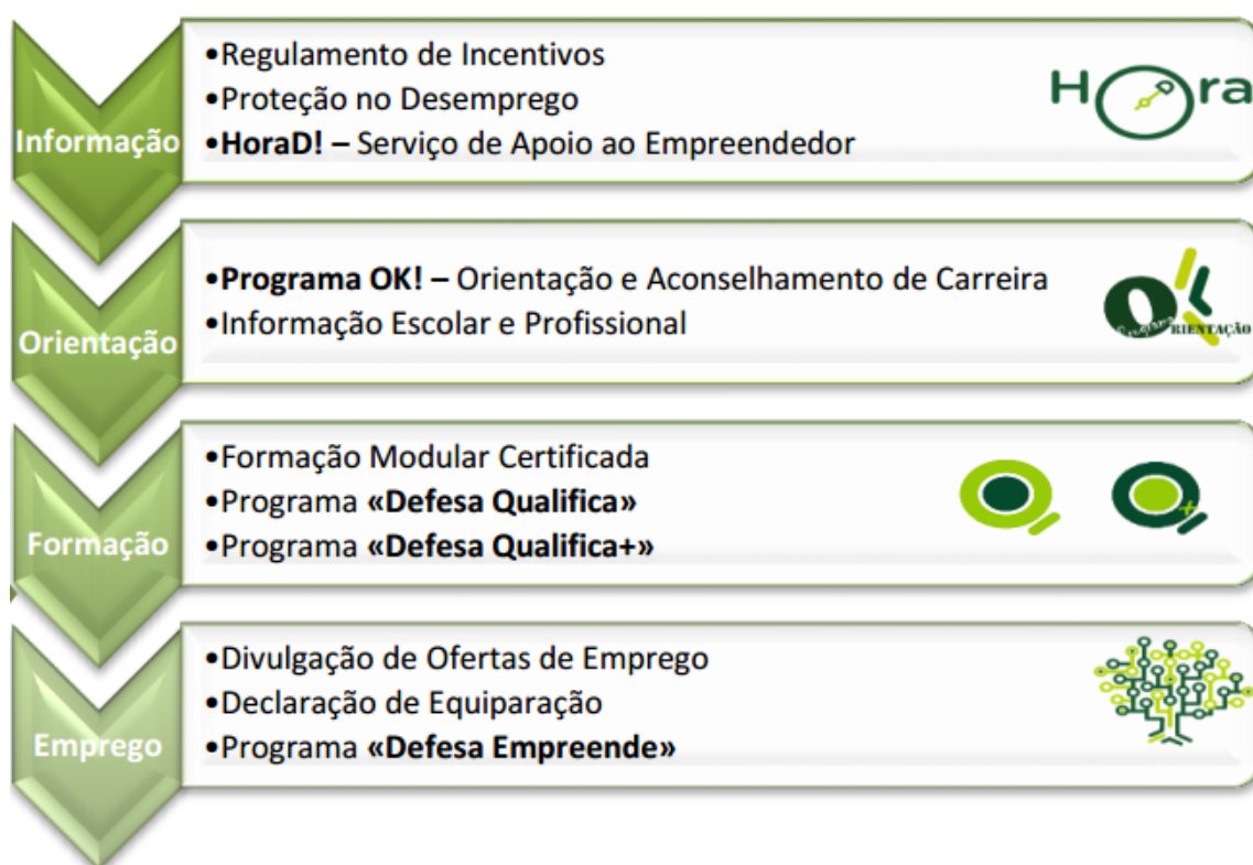
Figura 5 – Serviços e Programas do CIOFE