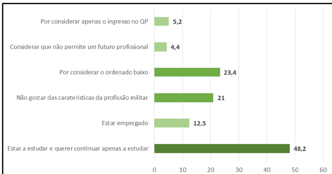
Figura 3 – Motivações de não ingresso na PSM em RV/RC em %