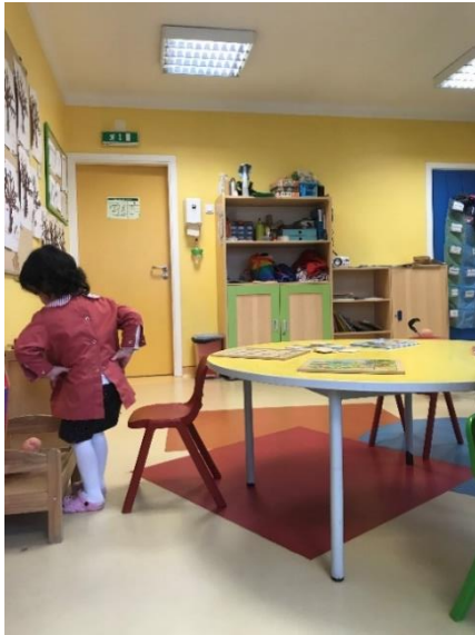
Figura 1 Espaço sala (entrada)