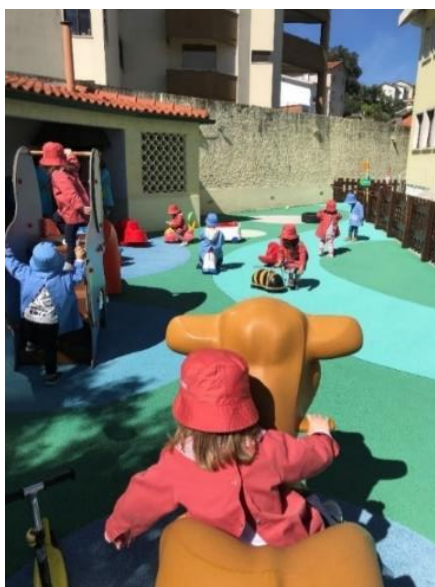
Figura 3 Espaço exterior (traseira)