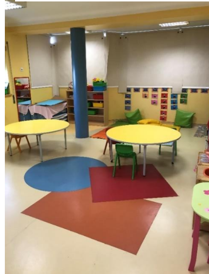
Figura 2 Espaço sala (fundo)