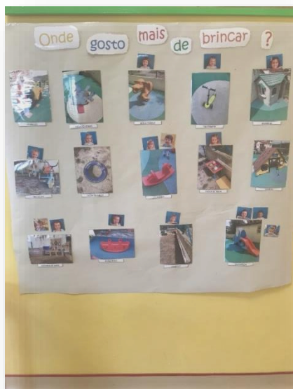
Figura 8 Painel