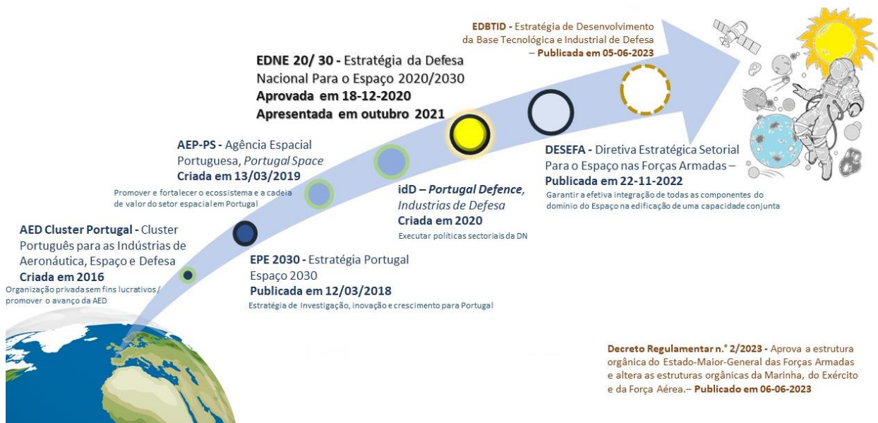
Figura 1 - Evolução do enquadramento do setor Espaço em Portugal

de Iniciativas Estratégicas Setoriais para o Espaço (PIESE), a elaborar pelo Departamento do Estado em colaboração articulada e coerente com os ramos das FFAA (EMGFA, 2022).