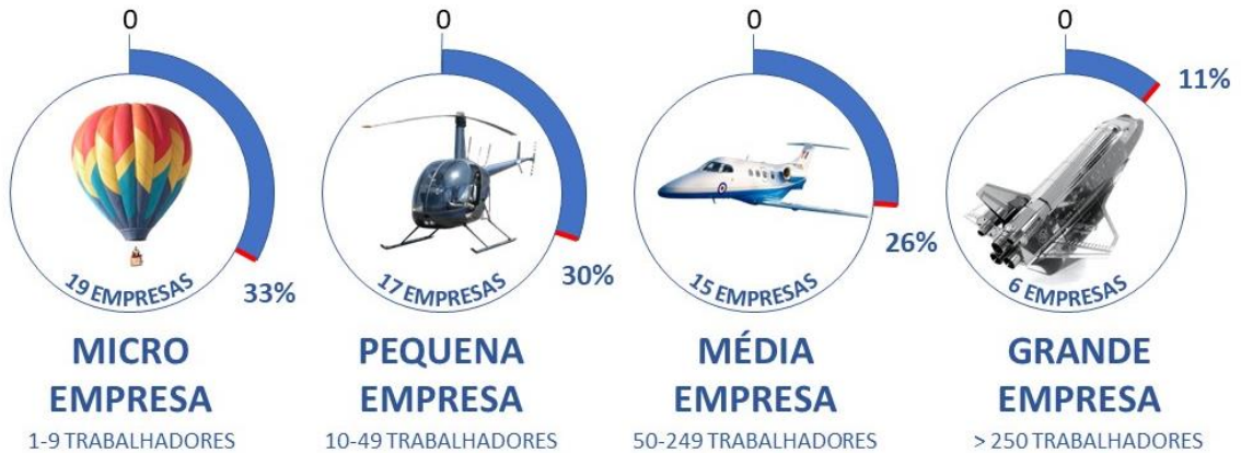
Figura 2 - Caracterização das empresas ligadas ao setor Espaço em Portugal

Conjugando a informação fornecida pela idD-PD, entidade que gere a BTID e comparada com os dados da AEP,PS (AEP,PS, 2021) e da AED-CP (AED-CP, 2020), concluiu-se que as empresas estão segmentadas da seguinte forma: