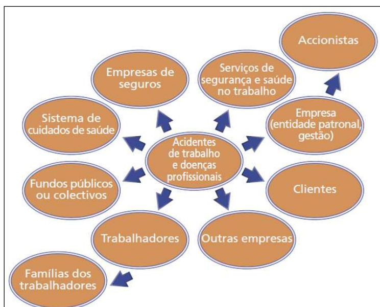
Custos socioeconómicos resultantes de acidentes de trabalho 3

Os custos totais 1 e os benefícios devem incluir quer os custos visíveis quer os custos ocultos, juntamente com os custos que podem ser facilmente quantificáveis e os que apenas podem ser expressos em termos qualitativos 2 , conforme as figuras abaixo: