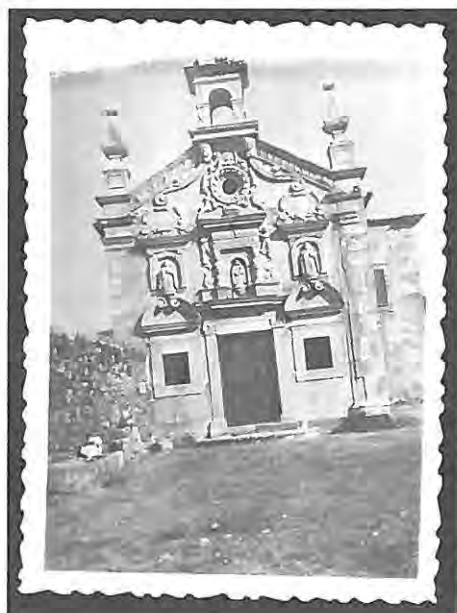
Fig. 2 - Capela Nossa Senhora do Amparo (finais anos 50)