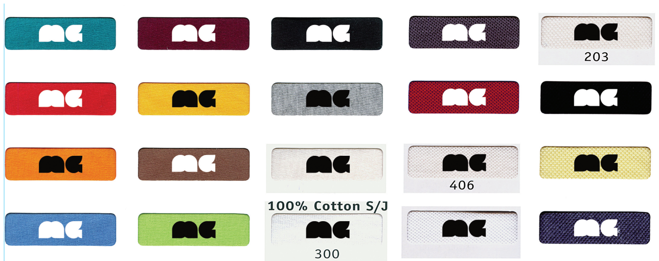
Figura / 13. Versão monograma, em positivo e em negativo, sobre fundos de cor.