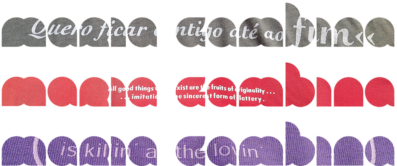
Figura / 12. Aplicação de texturas, versão monograma e nome.