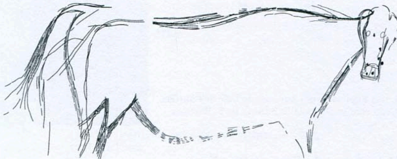
Representação do Auroque (espécie de touro/boi selvagem de grande porte extinto desde a idade média) encontrada em Ribeira de Piscos (2).

Este painel é dedicado à figura do touro, enquanto habitante protagonista do vale do Côa que tem estabelecido, ao longo dos séculos, uma relação privilegiada com os humanos e, conseqüentemente, um imaginário nestes que o interpreta, documenta ou simplesmente conceptualiza através de propostas artísticas múltiplas e alternativas.