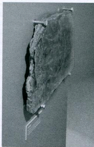
Fig. pc4 Réplica de um Auroque de Vale de Cabrões. Incisão contemporânea de autoria de F. Barbosa.

Reprodução com base na gravura incisa (auroque) da rocha 32 de Vale de Cabrões, Vila Nova de Foz Côa, de autoria de Fernando Barbosa.