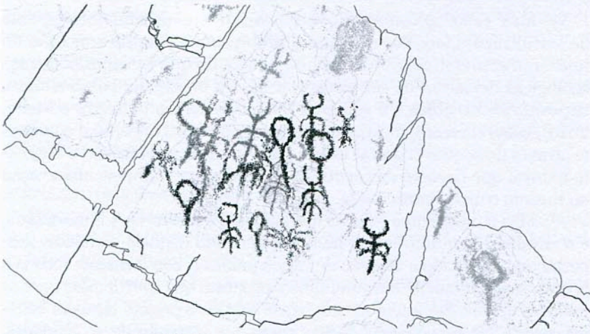
Fig. g1 – Namorados . Vila Nova de Foz Côa, Castelo Melhor; Gravura(s) incisa(s) na rocha 1 (II/IIIº milénio a.C.), detalhe.

No caso particular deste núcleo interpretativo, o discurso retórico longo seria ainda mais problemático no sentido em que o seu focus são imagens. Imagens que muitas vezes a ciência consegue desvendar o que denotam e conotam, mas que, outras vezes, contêm significados intrans-