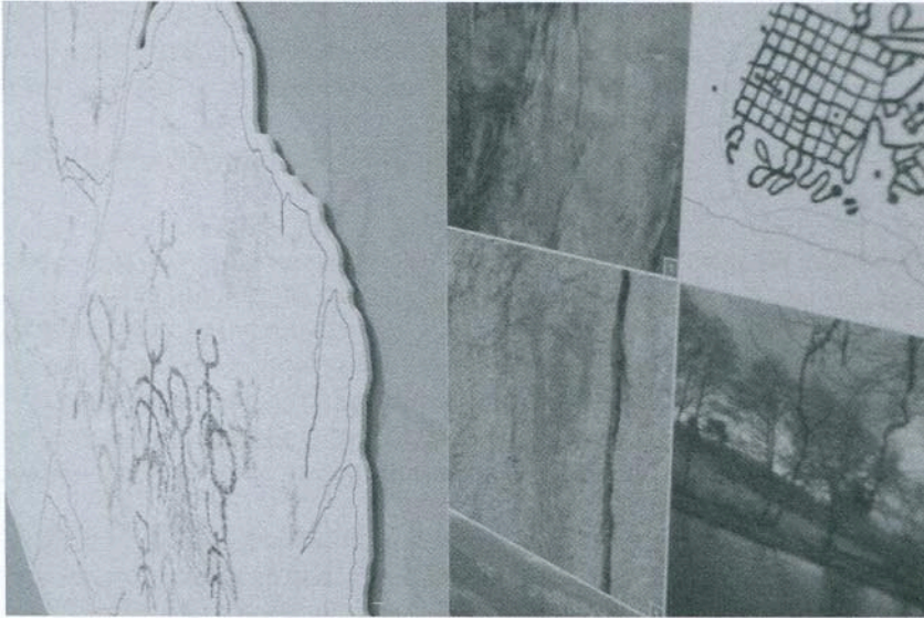
Fig. pc2 - "Côa: reinventar a arte da nascente à foz"- detalhe de um dos painéis onde são visíveis soluções de design.

Gravam-se os mesmos animais, agora com uma maior abundância dos cervídeos, o que se explica também pela sua maior expansão fruto de um gradual reaquecimento climático. Os painéis podem agora ser historiadados com menos motivos que galgam as encostas e se espalham também pelos vales laterais do Côa, mas também do Douro. A Foz do Côa é o local com a maior concentração de painéis gravados com estas incisões, algumas hoje extremamente difíceis de identificar devido ao seu desgaste. Em muitas rochas há sobreposições destas gravuras por motivos da Idade do Ferro. Este segundo período da arte paleolítica é também caracterizado pelo aparecimento da Arte Móvel, pequenas placas com motivos incisos, estilisticamente menos naturalistas e mais sensoriais. A maioria destas placas têm sido encontradas em contexto arqueológico nas escavações do sítio do Fariseu, o que forneceu excelentes dados de cronologia relativa para os mesmos tipos de motivos figurados nas centenas de painéis do curso terminal do Côa.