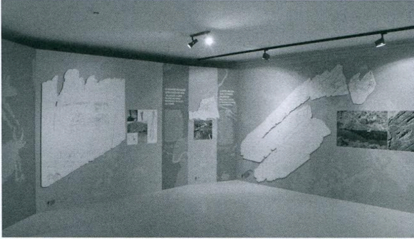
Fig. pc1 - “Côa: reinventar a arte da nascente à foz”- uma vista geral da exposição.

Por outro lado a arquitetura e o design deveriam configurar um projeto que ultrapassasse os obstáculos do site em termos de estrutura e espaço de atividades pré-existente, mas também ultrapassar as limitações das verbas disponíveis para a sua conceção e produção, através de opções de baixo custo, mas eficazes.