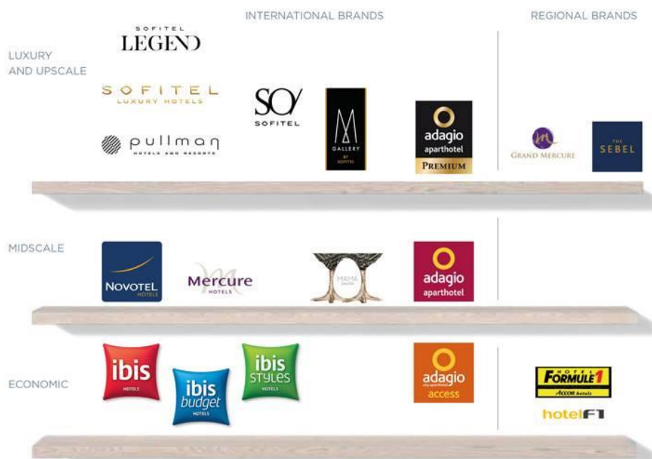
Figura 2: Marcas do grupo Accor, divididas por região e por segmento.