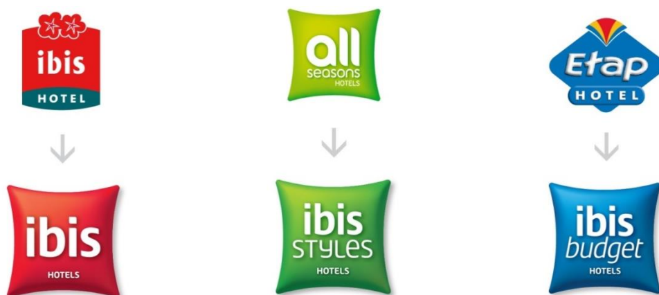
Figura 3: Nova arquitetura de marca e nova identidade visual da marca ibis – família ibis .

processo o grupo englobou dois dos seus hotéis do segmento económico - Etap Hotel e All Seasons, que passaram a chamar-se, respetivamente de ibis budget e ibis STYLES (figura 3). Assim, a marca ibis tornou-se uma marca umbrela dos hotéis económicos do grupo, que passou a ter à data mais de 1.500 unidades espalhados por aproximadamente 60 países 4 .