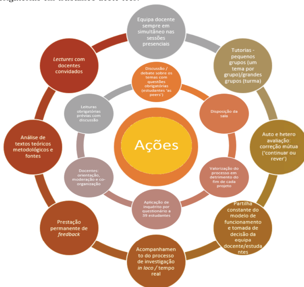
Figura 1: Síntese da ações implementadas

que mais tempo consumiram neste processo. Como trabalhos finais os/as estudantes apresentaram projetos sobre nove temas, seguindo todas as regras que metodologicamente são obrigatórias em trabalhos deste teor.