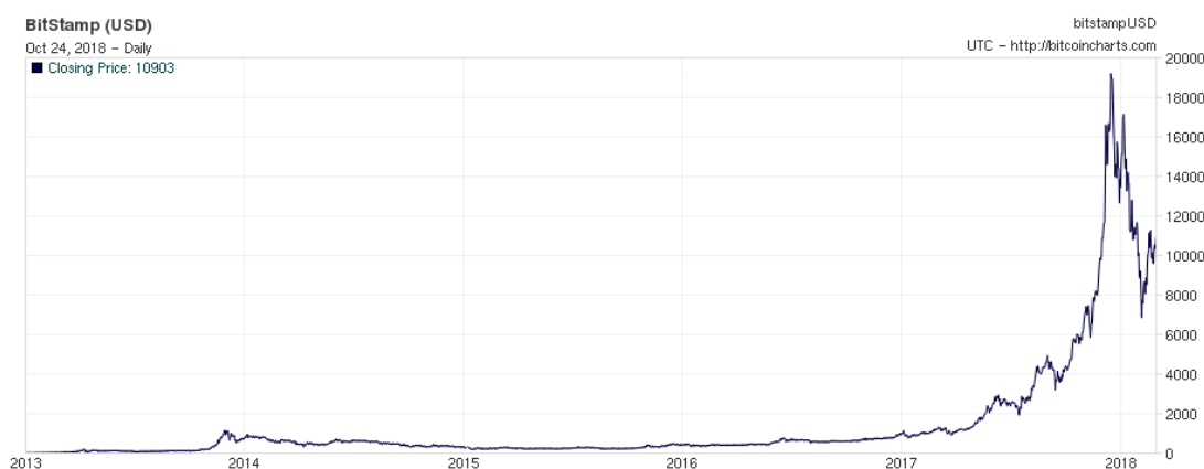
Figura 3 – Cotação diária da Bitcoin, em dólares americanos (USD), entre 1 de Janeiro de 2013 e 28 de Fevereiro de 2018.

As transações comerciais através da Internet começaram por ocorrer quase exclusivamente em instituições financeiras, as quais servem como intermediários de confiança para processar pagamentos eletrónicos (Nakamoto, 2008).