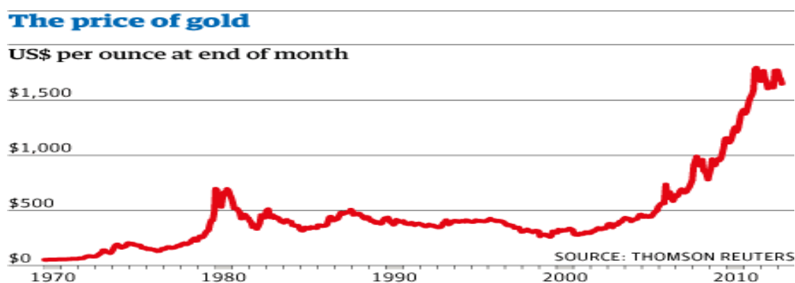
Figura 2 - Variação do preço do ouro em dólares entre 1970 e 2012.

Em 1980, surge a bolha do ouro, pouco tempo depois do Presidente Nixon decretar o fim da convertibilidade do dólar americano em ouro (ou seja, o fim do gold standard que era o que conferia base de valor ao dólar). Em Janeiro de 1980, o ouro atinge o seu máximo histórico ao ser transacionado a 850$, visto que os investidores começaram a adquirir enormes quantidades do metal devido a uma inflação elevadíssima provocada pelos elevados preços do petróleo e a intervenção soviética no Afeganistão. Mas tão depressa quanto atingiu o seu máximo, rapidamente retornou ao seu preço anterior a esse pico, como podemos ver na figura 2.