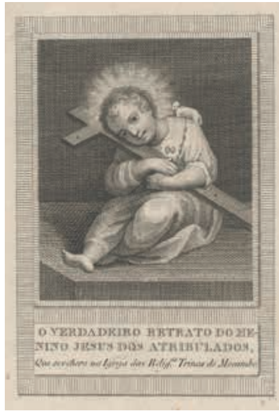
Fig. 26 - O Verdadeiro Retrato do Menino Jesus dos Atribulados, gravura sobre papel, primeira metade do século XIX, Sociedade Martins Sarmiento, inv. 868

Posterior deverá ser a gravura da autoria de Manuel Correia 23 que apresenta uma moldura mais decorativa, recortada, encimada por um cristograma, com festões de flores pendentes ( fig. 27 ). Esta apresenta duas variantes na cor: a tinta preta e a tinta vermelha. Um exemplar de tinta preta deu entrada na roda dos expostos acompanhando um menino que nasceu a 20 de abril de 1821 24 o que contribui para aferir a sua cronologia. Já o exemplar em tinta vermelha 25 ( fig. 28 ) tem os contornos mais tênues pelo que poderá ser uma edição posterior.