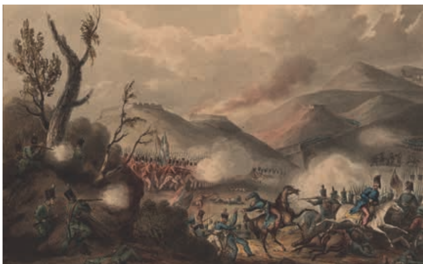
Fig. 3 - Batalha do Buçaco, W. Heath, gravura sobre papel, 1815, Arquivo Histórico Militar, PT/AHM/FE/010/A07/MD/12