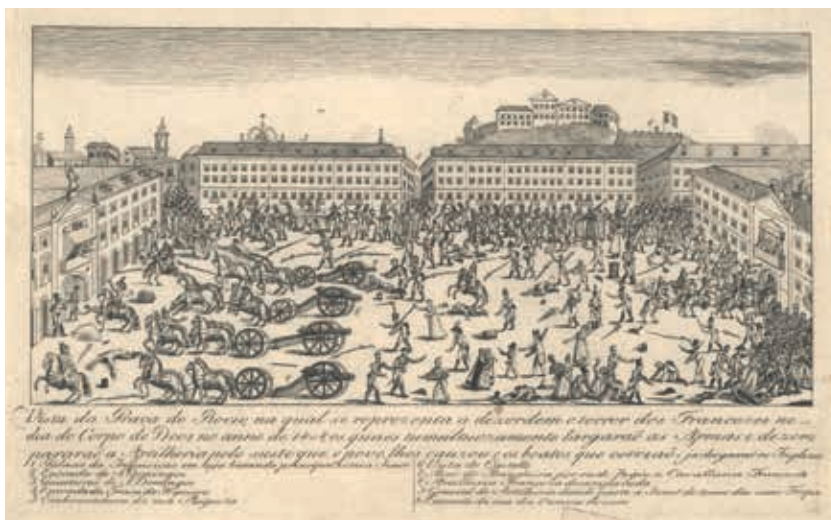
Fig. 2 - Vista da praça do Rossio onde representa a desordem e terror dos franceses no dia de Corpo de Deus em 1808, gravura sobre papel, Arquivo Histórico Militar, PT/AHM/FE/010/A07/MD/04