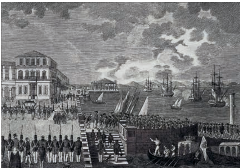
Fig. 9 - Desembarque d'El Rei Dom João VI, Constantino de Fontes (1777-c. 1838), gravura sobre papel, c. 1821, Museu de Lisboa, inv. GRA 1350