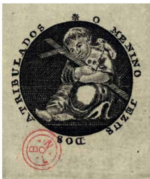
Fig. 38 - O Menino Jesus dos Atribulados, gravura sobre papel, primeira metade do século XIX, Biblioteca Nacional de Portugal, Iconografia, inv. RS 3645