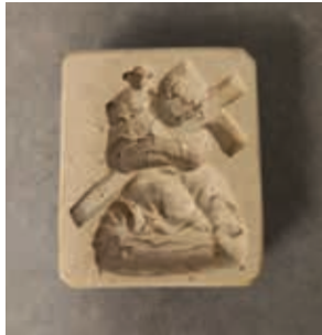
Fig. 48 - Molde para impressão representando o Menino Jesus dos Atribulados proveniente do convento de São João Evangelista, de freiras carmelitas, pasta cerâmica, primeira metade do século XIX, Museu de Aveiro, inv. 39 EM

(Museu de Aveiro, inv. 39 EM) 39 com a representação da imagem do Menino Jesus dos Atribulados ( fig. 48 ), sem qualquer referência ao orago ou à sua localização. Aparenta ter servido para moldar pasta fresca em momento anterior à cozedura (massa alimentar ou cerâmica), eventualmente para a produção de pequenos artefactos para venda, tal como bolachas, doces de ovos moles ou peças de barro. Seria uma forma das freiras de Aveiro granjearem receitas numa época de crise. Neste contexto, reconhece-se uma valorização desta figuração peculiar do Menino Jesus, enquanto ícone de proteção ou protagonista de milagres, e não necessariamente uma devoção especial à pintura das Trinas ou ao painel do Loreto.