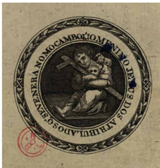
Fig. 32 - O Menino Jesus dos Atribulados que se venera no Mocambo, gravura sobre papel, primeira metade do século XIX, Biblioteca Nacional de Portugal, Iconografia, inv. RS 3647