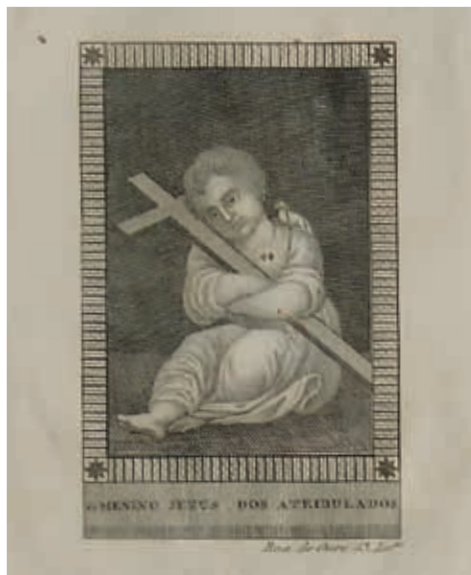
Fig. 35 - O Menino Jesus dos Atribulados, gravura sobre papel, primeira metade do século XIX, Museu dos Biscainhos, inv. DEP 5261 MEP, proveniente do Museu Etnográfico do Porto