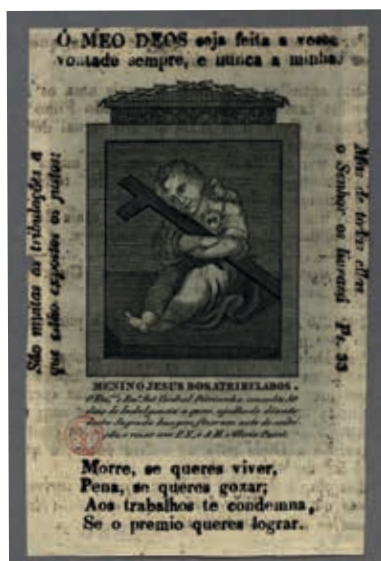
Fig. 57 - Menino Jesus dos Atribulados, gravura sobre papel, c. 1853, Biblioteca Nacional de Portugal, Iconografia, inv. RS 3665