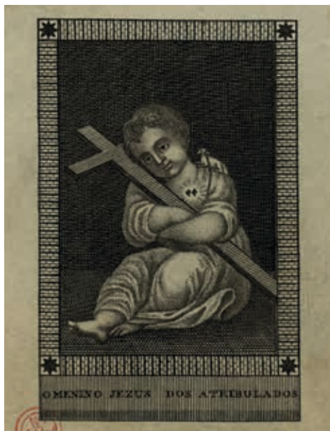
Fig. 36 - O Menino Jesus dos Atribulados, gravura sobre papel, primeira metade do século XIX, Biblioteca Nacional de Portugal, Iconografia, inv. RS 3663