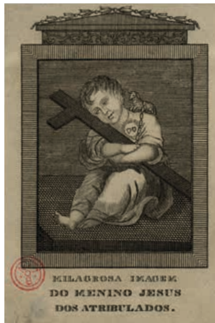
Fig. 39 - Milagrosa imagem do Menino Jesus dos Atribulados, gravura sobre papel, c. 1853, Biblioteca Nacional de Portugal, Portugal, Iconografia, inv. RS 3664

A procura e difusão deste orago na cidade de Lisboa foi de tal forma intensa que, em breve, a igreja de Nossa Senhora do Loreto, pertencente à comunidade italiana, também manifestou estar na posse de um Menino Jesus dos Atribulados. A imagem consiste num quadro, tal como nas Trinas, mas o do Loreto é em madeira recorrendo à técnica da marchetaria, com a aplicação tridimensional de um resplendor de prata ( fig. 40 ). Está datado de 1819 e assinado por Francesco Abbiati ( Franco Abbiati fecit 1819 ), mestre marceneiro natural de Mondelo, perto do Lago Como, na Lombardia, mas ativo em Roma nos finais do século XVIII e início do XIX, conhecido pelos seus trabalhos artísticos em marchetaria, presentes em mobiliário nas cortes de Madrid (onde trabalhou temporariamente) e de Nápoles 32 . No verso, o quadro do Loreto ostenta a seguinte inscrição manuscrita sobre papel colado na madeira: