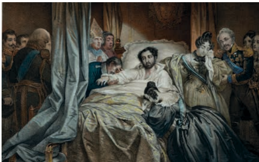
Fig. 16 - D. Pedro no Leito da Morte, Nicolas-Eustache Maurin, litografia colorida sobre papel, 1836, Parques de Sintra, Monte da Lua, inv. PNQ 2090

O novo regime liberal alterou profundamente a sociedade e a organização institucional do país. Os conventos foram extintos e os seus bens vendidos em hasta pública, os morgadios foram suprimidos, acabaram-se os privilégios e as isenções, extinguiram-se diversas instituições seculares e uniformizou-se a legislação, a gestão do território e os direitos das populações. Porém, a 24 de setembro de 1834, D. Pedro morreu prematuramente com 35 anos de idade. (fig. 16)