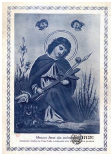
Fig. 59 - Menino Jesus dos Atribulados, A.B., gravura sobre papel, c. 1920, Biblioteca Nacional de Portugal, Iconografia, inv. RS 3661

A outra gravura 61 , ainda mais posterior, datável da década de 1920, está assinada com a sigla "A.B." ( fig. 59 ). Nela, o Menino Jesus surge representado como um jovem rapaz, pré-adolescente, sentado sobre uma pedra, com capa, segurando nos braços não só a cruz mas também outros instrumentos da Paixão, como os cravos, a lança e a vara com a esponja. A seu lado, à esquerda, emergem uns lírios, em cuja base está uma pomba, e, do lado direito, um espinheiro. Há uma aproximação iconológica à imagem original do Menino Jesus dos Atribulados meditando sobre a sua Paixão futura, mas reconhece-se um afastamento estético em relação ao quadro original das Trinas ou o do Loreto. Repete-se o ambiente exterior e a insistência noutros instrumentos da Paixão, tal como aconteceu com o desenho brasileiro, mas aparentemente apenas por coincidência. Em baixo, uma inscrição afirma: "Menino Jesus dos atribulados, ensina-me a meditar na Vossa Paixão e ajudai-me a levar a minha com paciência". A sobrevivência destas pagelas, mais recentes indica um ressurgimento desta devoção no primeiro quartel do século XX, talvez potenciado pelos tempos atribulados que então se viveram com a queda da Monarquia e a I República (1910-1926).