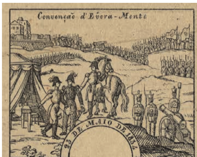
Fig. 15 - Convenção d'Évora-Monte, Manuel Luiz, litografia sobre papel, 1835, Biblioteca Nacional de Portugal, Iconografia, inv. E. 999 V.