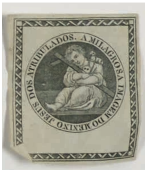
Fig. 55 - A Milagrosa imagem do Menino Jesus dos Atribulados, tecido impresso, c. 1865, Arquivo Distrital do Porto, cota atual: A/7/2/1-4.30, PT/ADPRT/ACD/CRPRT/AE/001/18301

Também no Porto, há registo de uma criança ser exposta em 1865 com este amuleto 44 . É um dos raros casos em que a inscrição refere “a milagrosa imagem do Menino Jesus dos Atribulados” ( fig. 55 ) exaltando-se a natureza milagreira do ícone e omitindo-se a sua localização. Certamente as respetivas mães acreditavam que, de alguma forma, esta pequena imagem poderia proteger os seus recém-nascidos abandonados, pelo que o Menino Jesus dos Atribulados ganhou foros de proteção à infância, talvez pela idade da rapariga alvo do milagre inicial.