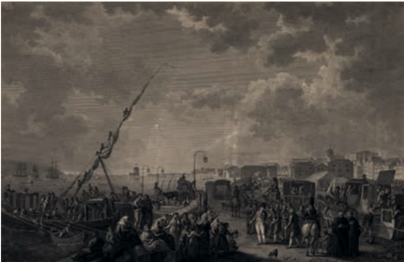
Fig. 1 - S.A.R. o Príncipe Regente de Portugal e toda a família real embarcando para o Brasil no Cais de Belém, Henri L'Eveque (1769-1832), gravura sobre papel, c. 1813, Biblioteca Nacional de Portugal, Iconografia, inv. E. 265 A.

Até à restauração dos Bourbons em Espanha, em dezembro de 1813, Portugal viveu uma perspectiva de nova invasão. Só com a derrota de Napoleão em 1814 (definitiva em 1815), Portugal pôde respirar de alívio, mas permaneceu sob governo militar inglês.