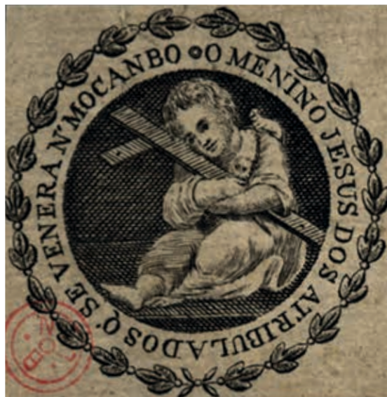
Fig. 31 - O Menino Jesus dos Atribulados que se venera no Mocambo, gravura sobre papel, primeira metade do século XIX, Biblioteca Nacional de Portugal, Iconografia, inv. RS 3643