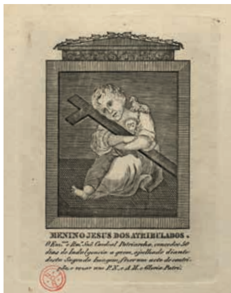
Fig. 56 - Menino Jesus dos Atribulados, gravura sobre papel, c. 1853, Biblioteca Nacional de Portugal, Iconografia, inv. RS 3662