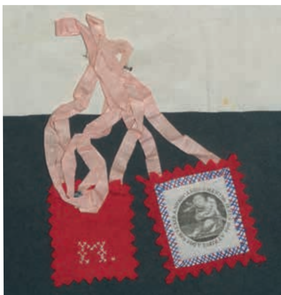
Fig. 54 - Sinal do exposto Domiciano com o Menino Jesus dos Atribulados, tecido impresso, 1877, Santa Casa da Misericórdia de Lisboa, Arquivo Histórico, inv. PT-SCMLSB SCML/CE/EE/EB/08/088/069