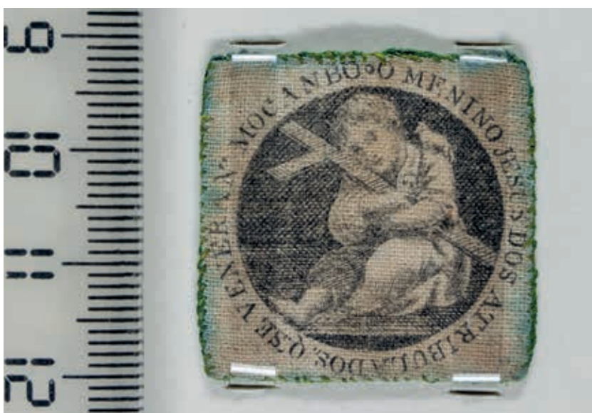
Fig. 52 - Sinal do exposto Manuel Jerónimo da Trindade com o Menino Jesus dos Atribulados, tecido impresso, Lisboa, 1831, Santa Casa da Misericórdia de Lisboa, Arquivo Histórico, inv. PT-SCMLSB SCML/CE/EE/EB/08/042/588