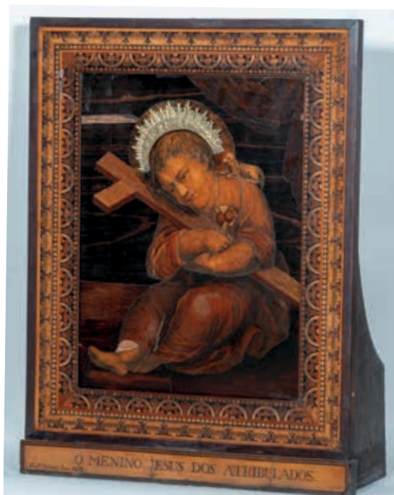
Fig. 40 - O Menino Jesus dos Atribulados, Francesco Abbiati, madeira marchetada, 1819, igreja italiana de Nossa Senhora do Loreto, Lisboa

Na base, possui uma inscrição em português identificativa: "O Menino Jesus dos Atribulados", denunciando que se destinava ao público nacional. Provavelmente, baseou-se numa das numerosas pagelas que circulavam, quase de certeza nas de Manuel Correia, e que terão chegado à sua posse em Itália na sequência da encomenda das peças maiores.