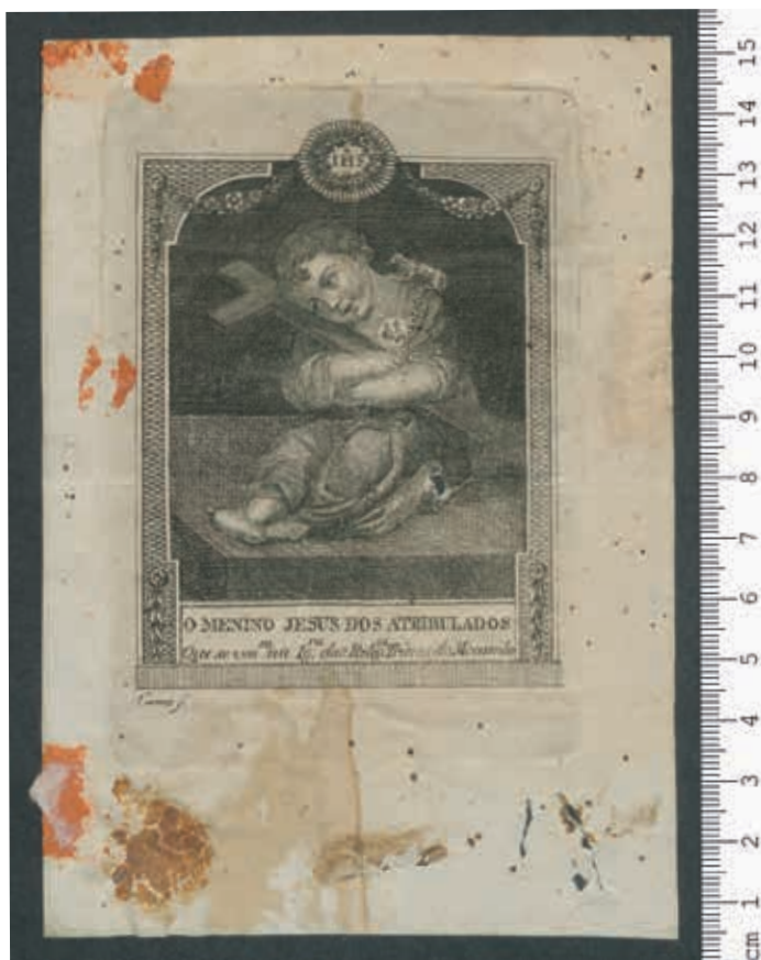
Fig. 50 - Sinal do exposto Antônio José Branco com o Menino Jesus dos Atribulados, gravura sobre papel, 1822, Santa Casa da Misericórdia de Lisboa, Arquivo Histórico, inv. PT-SCMLSB SCML/CE/EE/EB/08/033/243

Destes, apenas um 43 (datável de 1822) é uma gravura em papel da autoria de Manuel Correia, de acordo com o protótipo das Trinas ( fig. 50 ), sendo os restantes impressões de diminuto tamanho, algumas delas sobre tecido branco, replicando as gravuras, cosidos sobre suporte têxtil ( fig. 51, 52, 53 e 54 ), que serviam como amuleto dissimulado para usar próximo ao corpo.