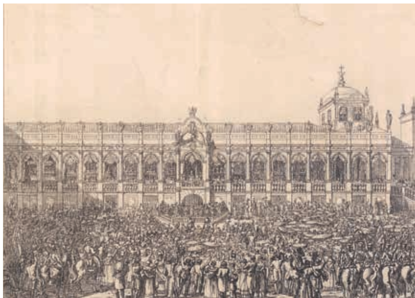
Fig. 4 - Cerimônia da faustíssima Aclamação de Sua Majestade o Senhor D. João VI, rei do Reino Unido de Portugal e do Brasil e Algarves, celebrada no Rio de Janeiro em 6 de fevereiro de 1818, Jean-Baptista Debret (1768-1848), gravura a água forte, c. 1820, Biblioteca Nacional do Rio de Janeiro, Iconografia, inv. 408460

Lá longe, no Brasil, a corte acomodava-se longe destes conflitos. A rainha faleceu em 1816 e o príncipe regente seria aclamado rei. A cerimônia deveria realizar-se em Lisboa, restaurando-se assim a capital nacional e a normalização da monarquia, mas essa não foi a opção tomada. D. João VI foi aclamado no Rio de Janeiro a 6 de fevereiro de 1818 ( fig. 4 ), perspectivando-se que a corte se instalara definitivamente no Brasil. Gera-se em Portugal um ambiente de insatisfação: o reino sente-se uma colônia, dominado pelos ingleses que controlam a Regência. Em 24 de agosto de 1820, eclode uma revolução liberal no Porto ( fig. 5 ) e forma-se a Junta Provisional do Governo Supremo do Reino. Lisboa adere a 15 de setembro, através de uma revolta popular ( fig. 6 ), e os revolucionários entram na capital em cortejo público a 1 de outubro ( fig. 7 ).