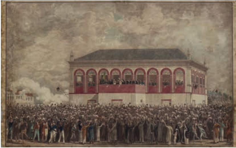
Fig. 10 - Aclamação de Sua Majestade o Senhor D. Pedro I imperador Constitucional do Brasil no dia 12 de outubro de 1822, Felix Emile Taunay (1795-1881), água forte aguarelada, Biblioteca Nacional do Rio de Janeiro, Iconografia, inv. 408461

Um ano depois, em abril de 1824, D. Miguel faz nova tentativa de golpe, a Abrilada, desta vez com pendor ultra-reacionário, com vista ao afastamento de diversas figuras conotadas com o liberalismo e à deposição do próprio rei. O golpe corre mal. D. Miguel é destituído dos seus cargos e é obrigado a exilar-se no estrangeiro. Os seus apoiantes foram presos e os liberais libertados. Em agosto de 1825, Portugal reconheceu a independência do Brasil, mas em março do ano seguinte, D. João VI morreu, precipitando uma crise sucessória: o príncipe herdeiro era soberano de outro país; o segundo na linha era absolutista e estava exilado.