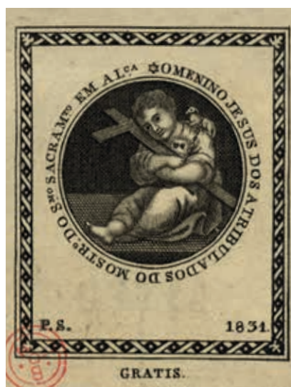
Fig. 45 - O Menino Jesus dos Atribulados do Mosteiro do Santíssimo Sacramento em Alcântara, P.S., gravura sobre papel, 1831, Biblioteca Nacional de Portugal, Iconografia, inv. RS 3644

Uma outra igreja lisboeta, a do mosteiro do Santíssimo Sacramento em Alcântara, um convento feminino dominicano que ainda se encontrava em funcionamento, advogou posteriormente que também possuía uma imagem deste Menino Jesus dos Atribulados ( fig. 45 ), publicando uma gravura 36 da autoria de um gravador que assina com a sigla P. S., aparentemente distribuída gratuitamente no ano de 1831, durante o reinado absolutista de D. Miguel.