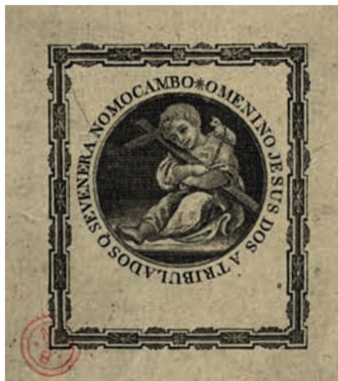
Fig. 33 - O Menino Jesus dos Atribulados que se venera no Mocambo, gravura sobre papel, primeira metade do século XIX, Biblioteca Nacional de Portugal, Iconografia, inv. RS 3648