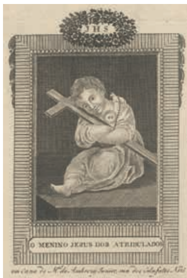
Fig. 44 - O Menino Jesus dos Atribulados, gravura sobre papel, primeira metade do século XIX, Sociedade Martins Sarmento, inv. 867.