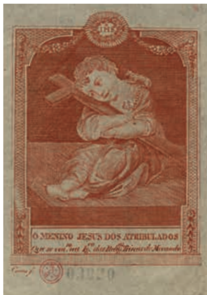
Fig. 28 - O Menino Jesus dos Atribulados, Manuel Correia, gravura sobre papel, primeira metade do século XIX, Biblioteca Nacional de Portugal, Iconografia, inv. RS 3650