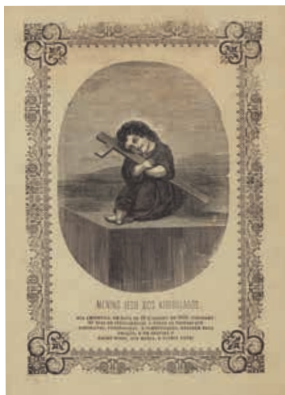
Fig. 58 - Menino Jesus dos Atribulados, gravura sobre papel, finais do século XIX, Biblioteca Nacional de Portugal, Iconografia, inv. E. 5926 P.

Por fim, nos finais do século XIX e no início do XX foram publicadas mais algumas pagelas alusivas ao Menino Jesus dos Atribulados, mas já sem qualquer menção às Trinas ou preocupação em copiar a imagem original. Uma das pagelas identificadas 60 ( fig. 58 ), de finais do século XIX, apresenta uma moldura com motivos vegetalistas esquematizados semelhantes aqueles que encontramos na louça de Sacavém, sua contemporânea. As letras são de imprensa modernas. Alude-se à data da conceção da indulgência demonstrando que se trata de um evento passado. E o Menino Jesus mantém a mesma posição abraçado à cruz, com a cabeça inclinada, mas é representado com uma farta cabeleira, sem cordeiro nem corações em chamas no peito.