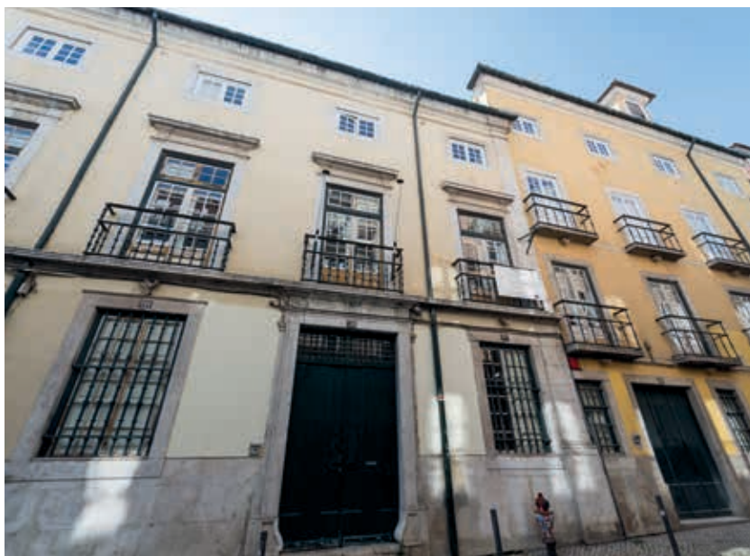
Fig. 20 - Antigo recolhimento da rua da Rosa, instalado no palácio dos Marqueses das Minas, no Bairro Alto, onde ocorreu o milagre com o quadro do Menino Jesus dos Atribulados

O recolhimento localizava-se, desde 1812, no antigo palácio dos Marqueses das Minas ( fig. 20 ), na rua da Rosa das Partilhas, passando a ser gerido pela Santa Casa da Misericórdia de Lisboa em 1928 por via do decreto n.º 15.778 de 23 de julho, que ainda hoje detém a propriedade do imóvel, funcionando nele vários equipamentos de assistência social, entre os quais, a Unidade de Adoção, Apadrinhamento Civil e Acolhimento Familiar.