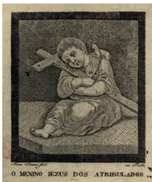
Fig. 34 - O Menino Jesus dos Atribulados, J.M. das Neves e Francisco S. Bruno, gravura sobre papel, primeira metade do século XIX, Biblioteca Nacional de Portugal, Iconografia, inv. RS 3653