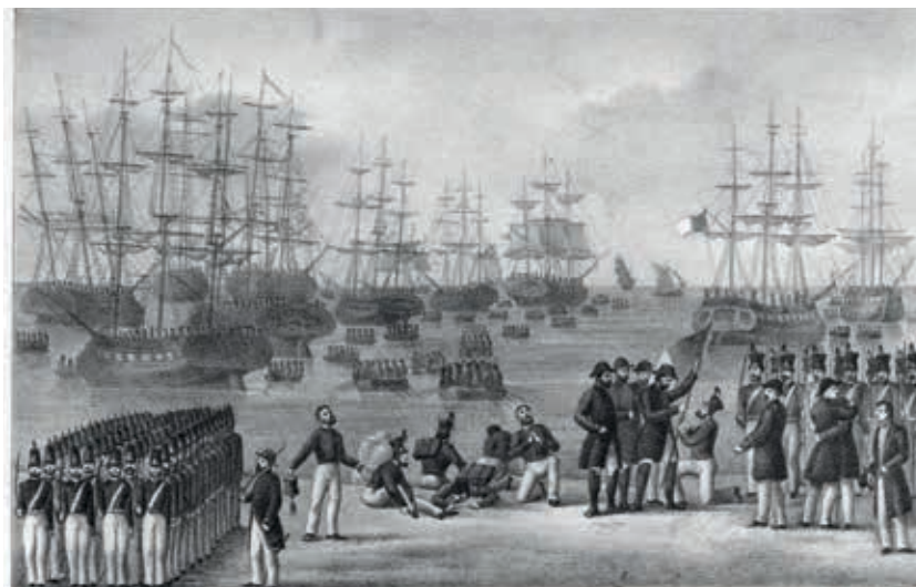
Fig. 13 - Vista da praia de Arnosa de Pampelido, onde desembarcou o senhor Dom Pedro à frente do exército libertador, gravura sobre papel, 1867, Museu do Dinheiro, inv. 42400270040

Em 1830, a Europa experienciou um segundo período revolucionário, substituindo-se governos conservadores por liberais na Inglaterra e na França. D. Miguel perdeu muito do seu apoio internacional. D. Pedro, contestado no Brasil, abdicou em abril de 1831 e passou a dedicar-se exclusivamente à recuperação da coroa portuguesa para a sua filha. Em julho de 1832, os liberais desembarcam no Porto ( fig. 13 ) e foram cercados pelos miguelistas por mais de um ano. Lisboa caiu a 24 de julho de 1833 ( fig. 14 ) e D. Miguel capitulou em 26 de maio de 1834 pela convenção de Evoramonte ( fig. 15 ), tendo-se exilado em Viena de Áustria. A paz assinada não implicou a paz no terreno. No Algarve surgiram as guerrilhas que espalharam o terror até 1840.