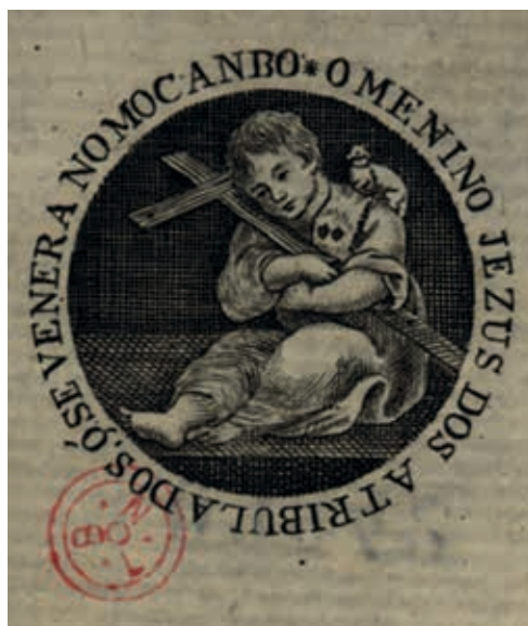
Fig. 30 - O Menino Jesus dos Atribulados que se venera no Mocambo, gravura sobre papel, primeira metade do século XIX, Biblioteca Nacional de Portugal, Iconografia, inv. RS 3642