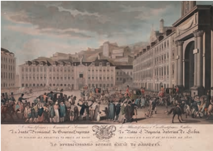
Fig. 7 - A Faustíssima e Memorável Reunião dos Ilustríssimos e Excelentíssimos membros da Junta Provisional do Governo Supremo do Reino e Regência Interina de Lisboa no palácio da Regência na praça do Rossio de Lisboa, Antônio Cândido Cordeiro Pinheiro Furtado, litografia sobre papel, 1820, Museu de Lisboa, inv. GRA 1357

A 26 de janeiro de 1821, são abertas as cortes constituintes ( fig. 8 ). D. João VI não teve outra opção senão aderir e regressar a Lisboa, tendo desembarcado a 4 de julho ( fig. 9 ). O príncipe herdeiro, D. Pedro (1798-1834), desobedeceu e ficou no Brasil. Pouco depois, a 7 de setembro de 1822, proclamou a independência, coroando-se imperador constitucional em 12 de outubro ( fig. 10 ). Portugal perdia, assim, o Brasil.