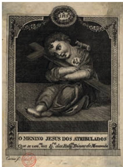
Fig. 27 - O Menino Jesus dos Atribulados, Manuel Correia, gravura sobre papel, primeira metade do século XIX, Biblioteca Nacional de Portugal, Iconografia, inv. RS 3651