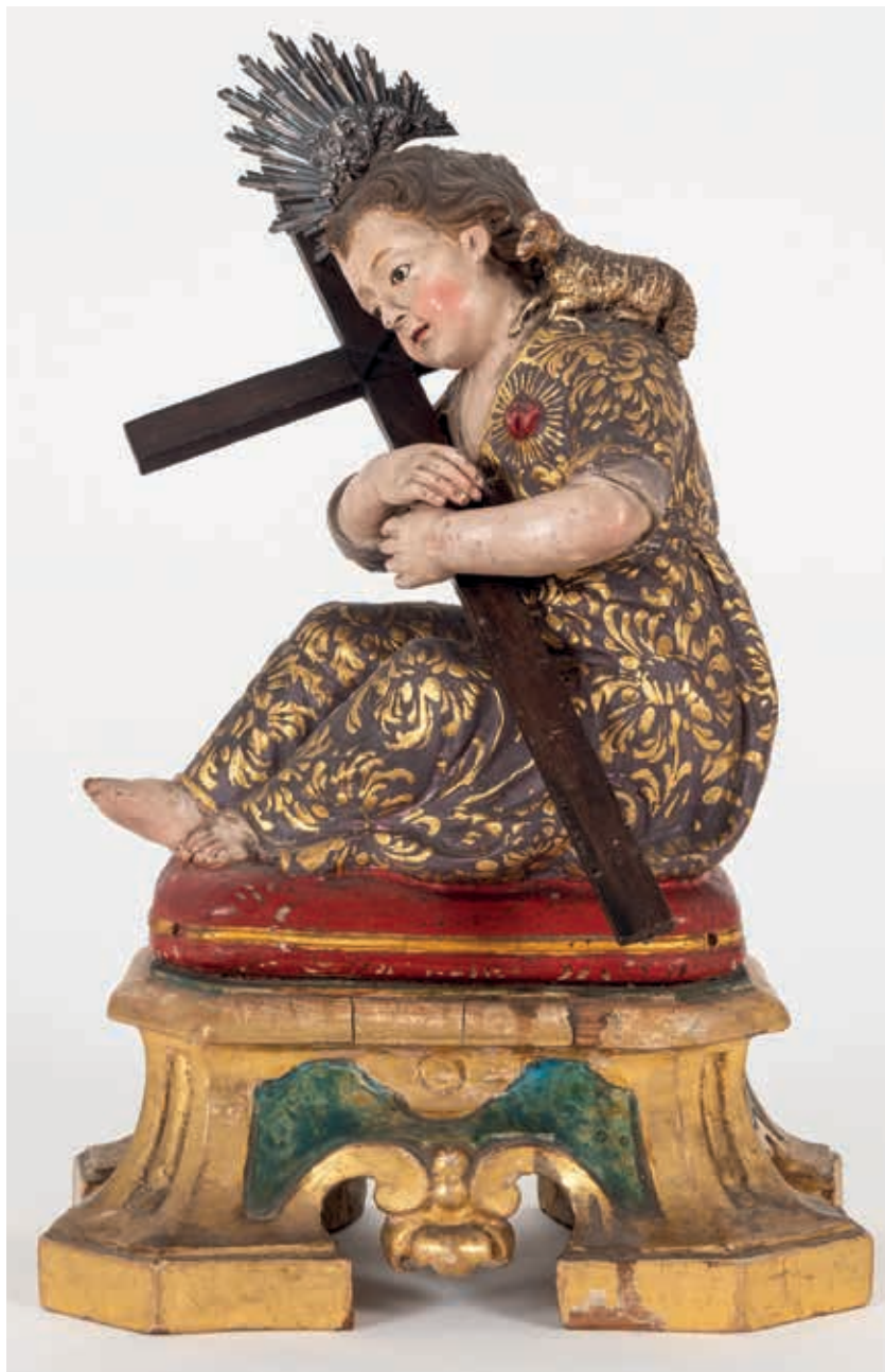
Fig. 18 - Menino Jesus dos Atribulados, terracota e madeira douradas e policromadas, primeira metade do século XIX, Museu de São Roque, inv. ESC. 213