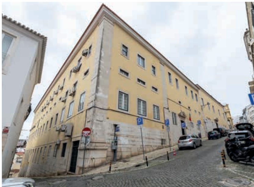
Fig. 19 - Convento das Trinas do Mocambo, onde se localizava o quadro original do Menino Jesus dos Atribulados

nominação de “atribulados” dada ao Menino Jesus deveria ter uma relação direta com esta atividade. Seria um orago protetor ou evocativo dos cativos e das suas famílias que, tal como o Menino Jesus abraçado à sua cruz, eram incentivadas a que aceitassem a realidade do cativo, apesar desta ser, mesmo para a época, injusta e inaceitável. Não se sabe onde estava o quadro originalmente. Como iremos ver adiante, este aparece como orago de uma das capelas laterais da igreja do convento em documentos tardios, mas sabemos que nem sempre esteve ali, pois não comparece numa descrição da mesma igreja publicada em 1794 9 . Só com o incremento do seu protagonismo, ali foi colocado em lugar de maior destaque, substituindo o orago da capela de São João Baptista, cuja imagem todavia permaneceu no mesmo local até finais do século XIX.