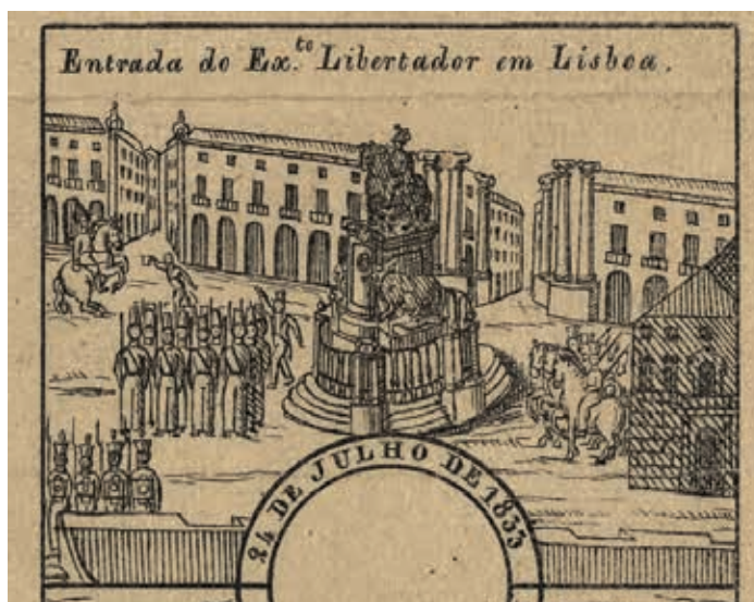
Fig. 14 - Entrada do Exército Libertador em Lisboa, Manuel Luiz, litografia sobre papel, 1835, Biblioteca Nacional de Portugal, Iconografia, inv. E. 999 V.