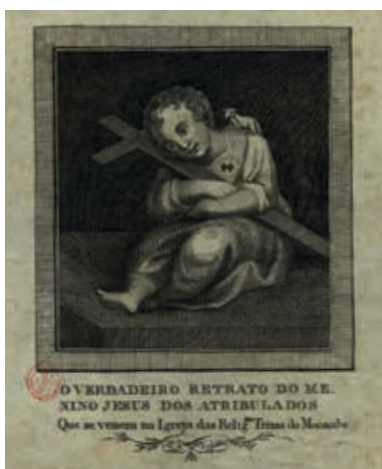
Fig. 25 - O Verdadeiro Retrato do Menino Jesus dos Atribulados que se venera na igreja das religiosas Trinas do Mocambo, gravura sobre papel, primeira metade do século XIX, Biblioteca Nacional de Portugal, Iconografia, inv. RS 3654