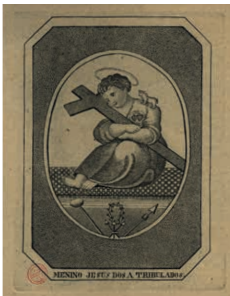
Fig. 37 - Menino Jesus dos Atribulados, gravura sobre papel, primeira metade do século XIX, Biblioteca Nacional de Portugal, Iconografia, inv. RS 3659