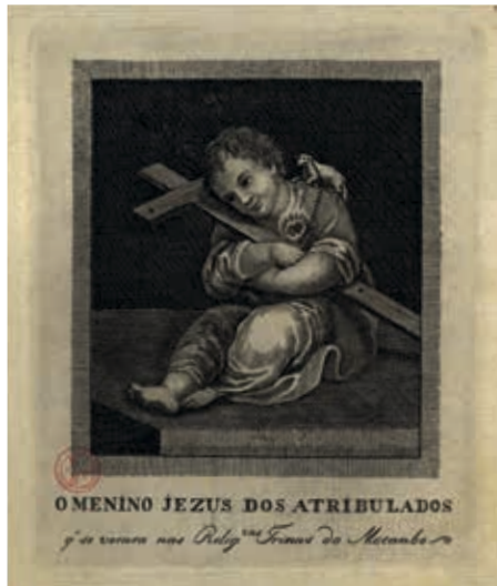
Fig. 23 - O Menino Jesus dos Atribulados que se venera nas religiosas Trinas do Mocambo, gravura sobre papel, c. 1817, Biblioteca Nacional de Portugal, Iconografia, inv. RS 3656

A produção “legítima” parece ter-se iniciado com gravuras anônimas 21 muito próximas ao protótipo autorizado ( fig. 23 ), cujo gravador terá sido contratado diretamente pelas freiras para lhes produzir a totalidade das pagelas para venda, otimizando assim os lucros.