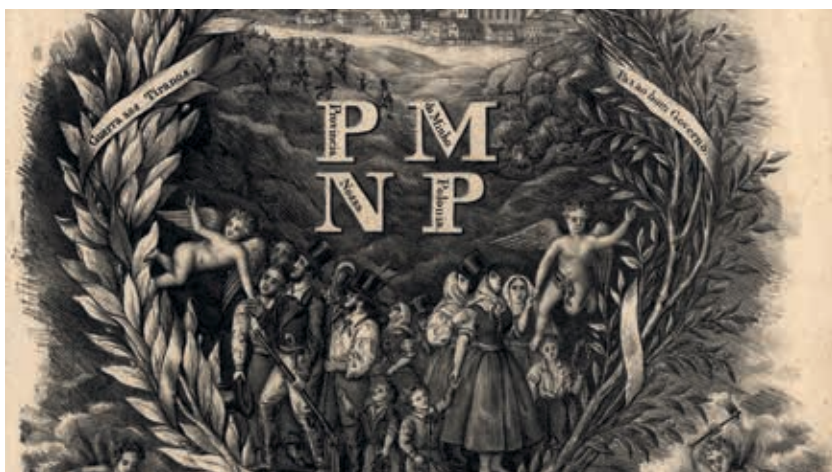
Fig. 17 - 15 de março, 1846. Póvoa de Lenho. Princípio da Revolução, Gregório Naziazeno, litografia sobre papel, 1846, Biblioteca Nacional de Portugal, Iconografia, inv. E. 1140 V.

breve, setembristas e cartistas envolveram-se numa segunda guerra civil, a Patuleia (outubro de 1846 a junho de 1847), que motivou nova intervenção militar externa. A facção cartista venceu, mas os setembristas regressaram ao poder sendo afastados por um golpe militar a 1 de maio de 1851, protagonizado pelo Duque de Saldanha. Iniciou-se, assim, a Regeneração, uma época de estabilidade política marcada pelo rotativismo dos partidos no parlamento, desenvolvimento económico e fomento de infraestruturas que durou até ao final da Monarquia Constitucional.