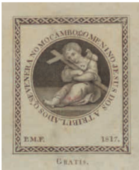
Fig. 29 - O Menino Jesus dos Atribulados, P.M.F, gravura sobre papel, 1817, Biblioteca Nacional de Portugal, Iconografia, inv. E. 241 PQ.