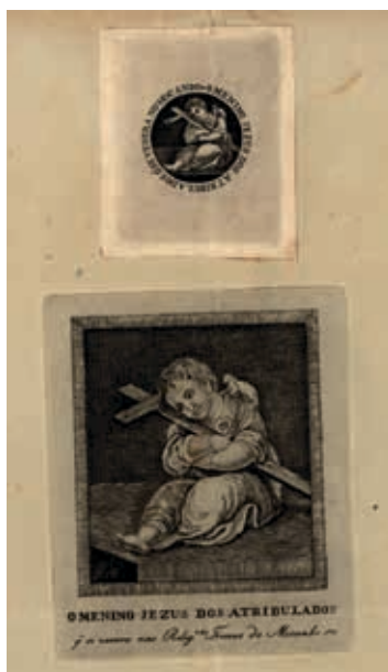
Fig. 22 - Modelo das pagelas do Menino Jesus dos Atribulados proposto ser produzido em exclusividade pelas freiras do convento das Trinas do Mocambo, gravura sobre papel, 1817, ANTT, Desembargo do Paço, Repartição da Corte, Estremadura e Ilhas, mç. 1593, n.º 24, PT/TT/DP/B-A-E/1-1/0009/000024

Assim, esta exclusividade comercial foi-lhes concedida nesse mesmo ano 20 . Porém, tal iniciativa não conseguiu evitar a produção clandestina destas gravuras em massa, das quais muitas ainda hoje existem. A diferença entre as gravuras “legítimas” e as “clandestinas” parece incidir na referência à localização do quadro que é expressa nas primeiras, mas omitida nas segundas.