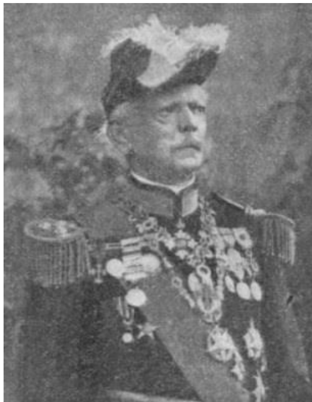
O General Pedro Massano de Amorim em grande uniforme

civil de administrador durante pouco tempo, pois as suas qualidades de liderança e o seu prestígio na colónia, justificaram novamente a sua nomeação para Governador-geral da colónia de Moçambique, em 16 de junho de 1923. Foi promovido a General em 1924 e em 1926 foi convidado para o Governo-geral da Índia, onde serviu com o mesmo espírito muito dedicado, até falecer por doença oncológica em Nova Goa, a 2 de junho de 1929. O seu corpo foi depois trasladado de Goa para Lisboa tendo sido sepultado no cemitério do Alto de S. João em 28 de janeiro de 1930, no talhão dos combatentes.