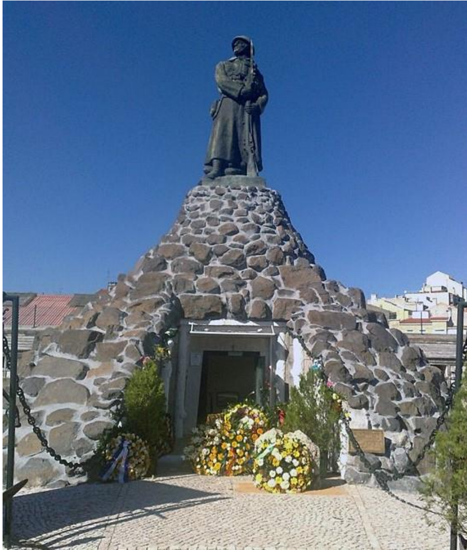
Talhão dos Combatentes no cemitério do Alto de S. João (Lisboa) onde estão os restos mortais do Gen. Pedro Massano de Amorim

O seu prestígio perdurou ao longo de gerações que reconheciam o seu valor e em 1960 a Sociedade de Geografia de Lisboa propôs o seu nome para ficar registado na toponímia de Lisboa, tendo sido dado muito justamente o seu nome, a uma rua na Freguesia da Ajuda em Lisboa.