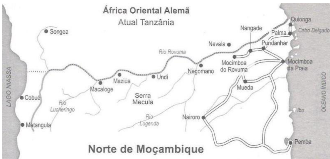
Mapa da fronteira do Rovuma durante a grande guerra (1914-1918)

com a Alemanha, ao contrário do governo anterior que procurava por todos os meios envolver Portugal na guerra ao lado da Inglaterra. Além da situação política, o sensato comandante português sabia que as suas tropas não tinham condições sanitárias perante a ameaça das doenças locais e não dispunham de alimentação adequada.