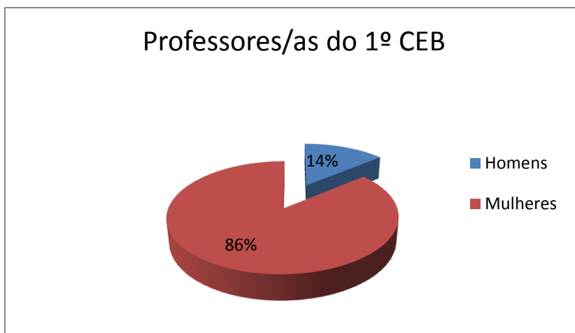
Gráfico 1 – Docentes do 1º CEB em exercício