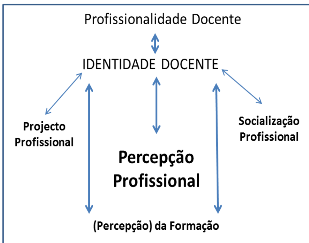
Figura 1 – Dinâmica do processo de construção da identidade docente

Antes de darmos por concluído este ponto do trabalho, sobre os conceitos de identidade profissional e de profissionalidade docente, recorremos a Nascimento (2002) para ilustrarmos, graficamente, o processo dinâmico que conduz à construção da identidade profissional dos docentes e que resulta, essencialmente, da interação entre o projeto, a percepção, a socialização e a formação profissionais.