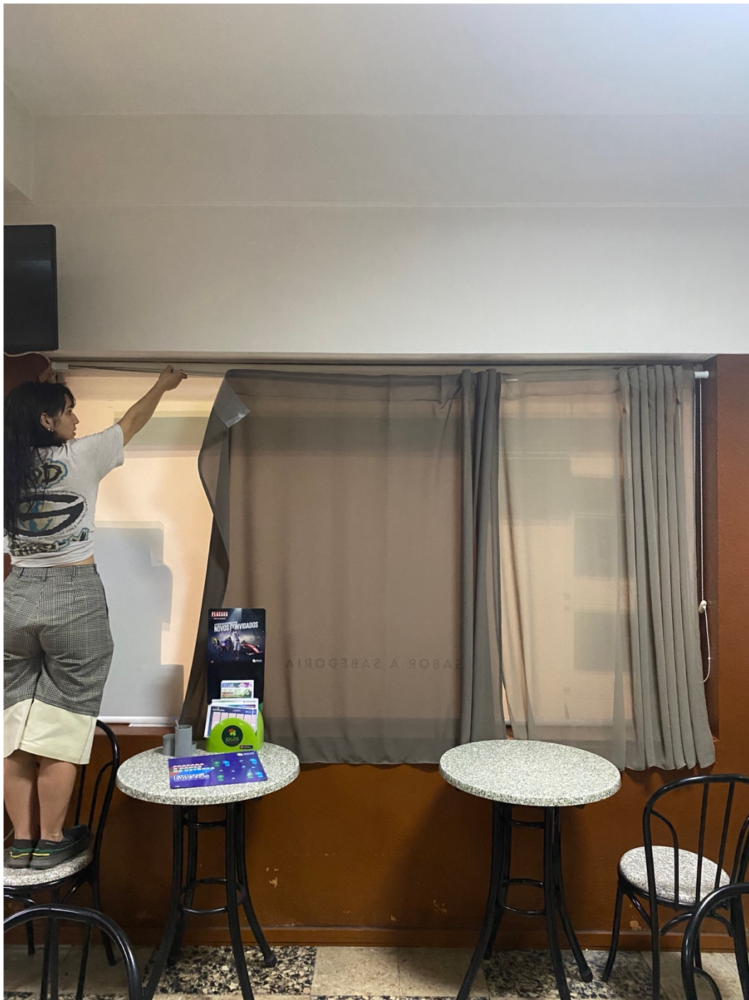
Figura 8: Medições e testes de arte.