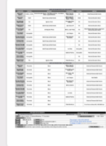
Figura 10: Folha de serviço #1