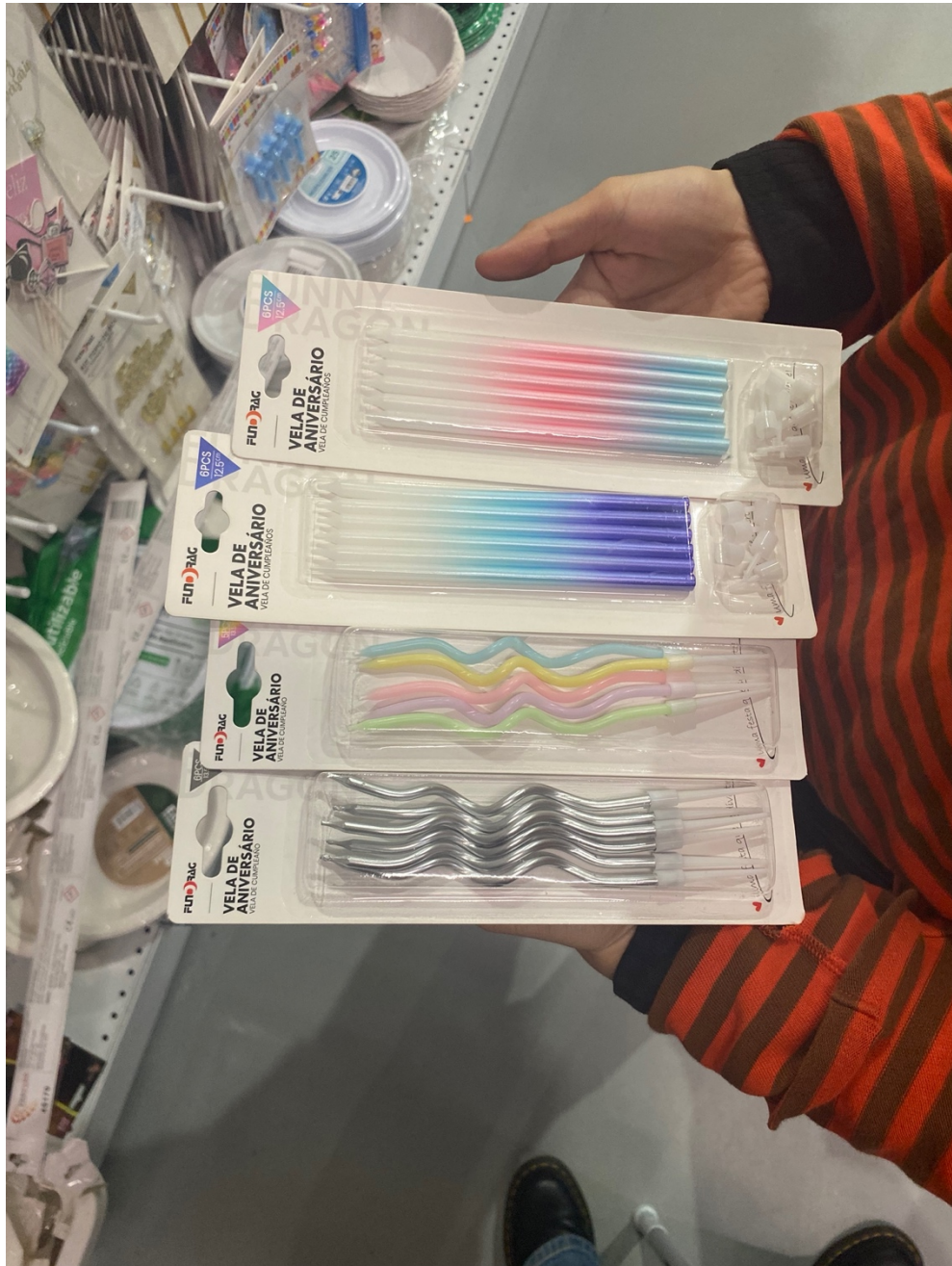
Figura 6: Pesquisa de adereços.