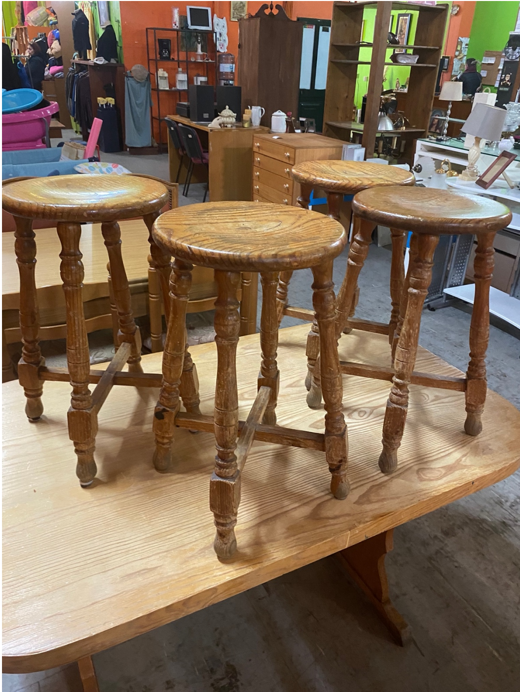
Figura 5: Pesquisa de mobília para arte.