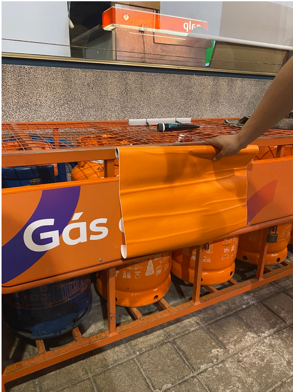
Figura 9: Testes de arte.