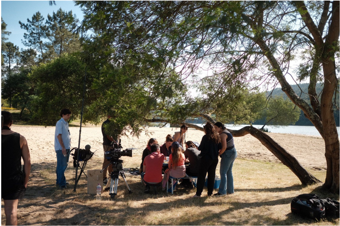
Figura 19: Equipa de arte como decoradoras de set e prop masters.