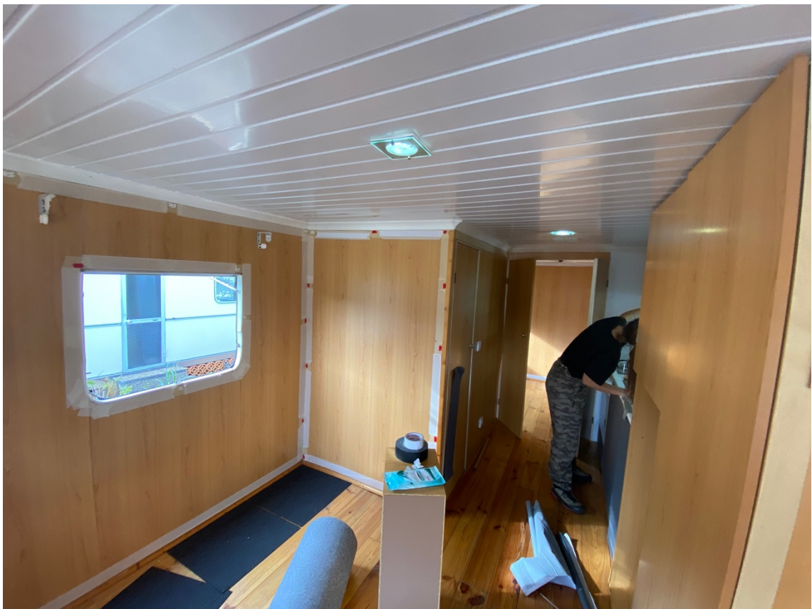
Figura 20: Equipa de arte na construção dos décors.