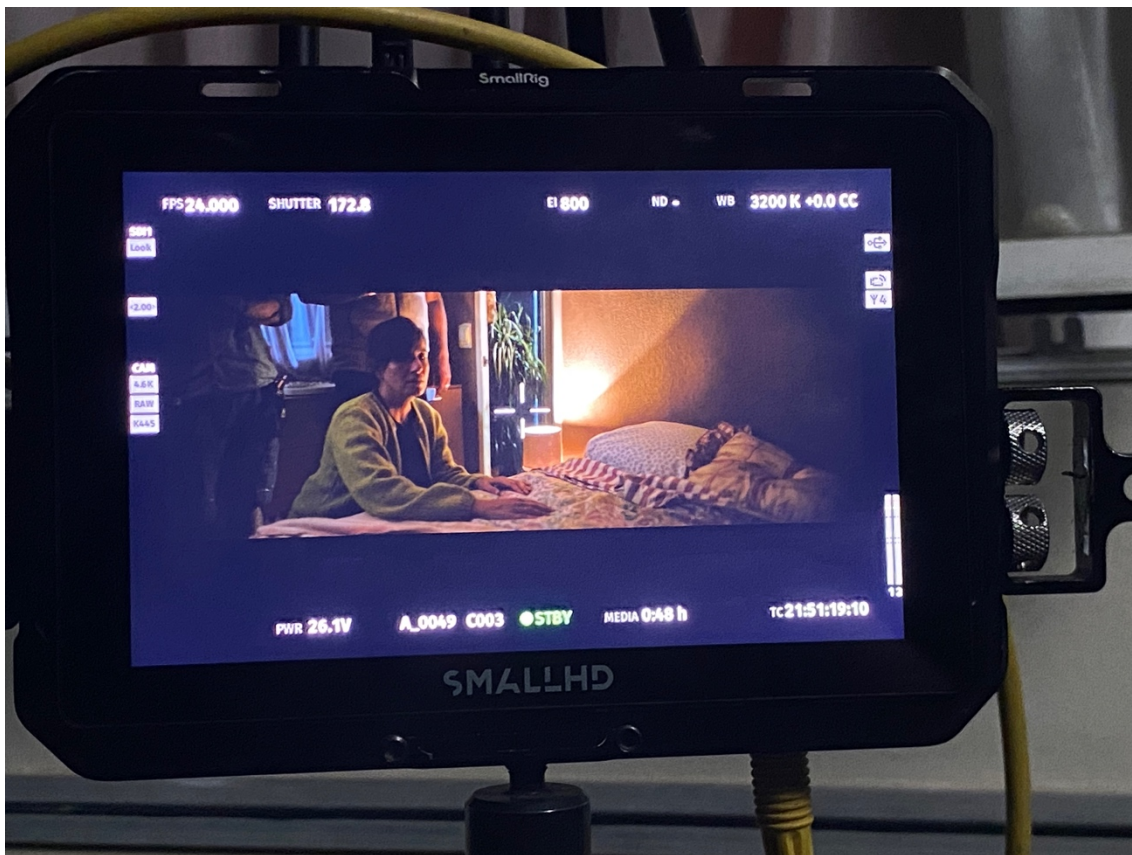
Figura 21: Rodagem na casa de Teresa.