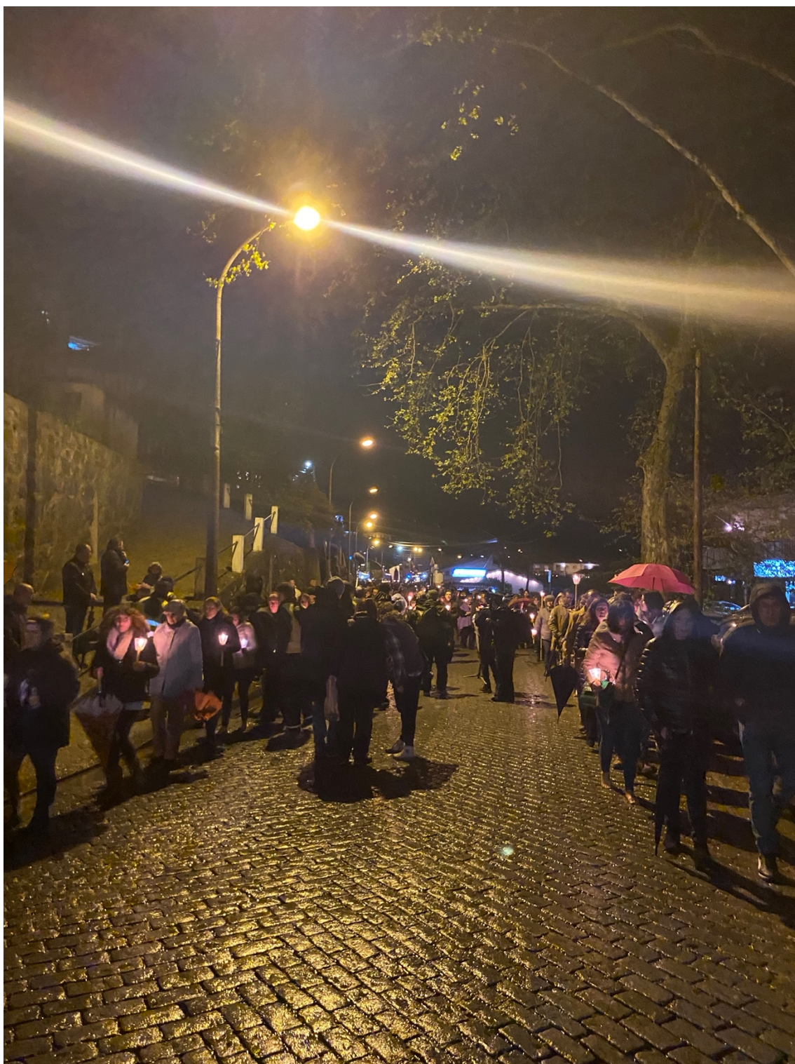
Figura 13: Filmagem da procissão real.