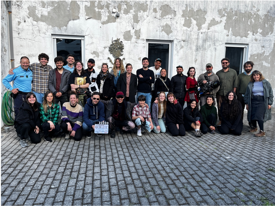
Figura 17: Equipa "Terra Vil".