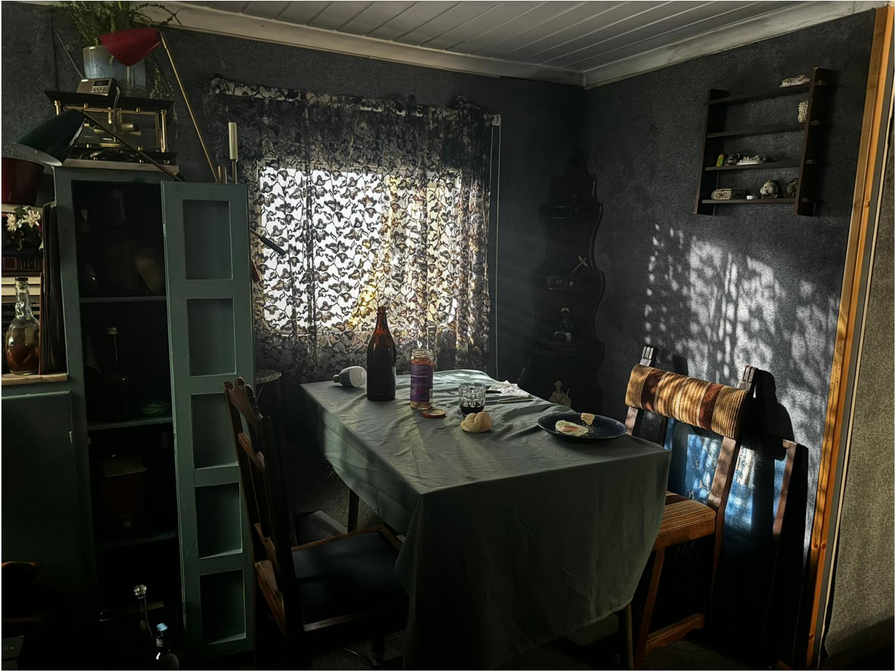
Figura 16: Casa do António pós trabalho de arte.