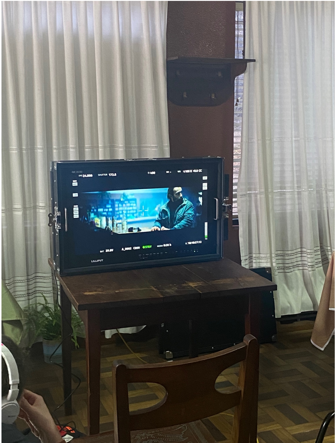
Figura 11: Primeiro dia de rodagem.