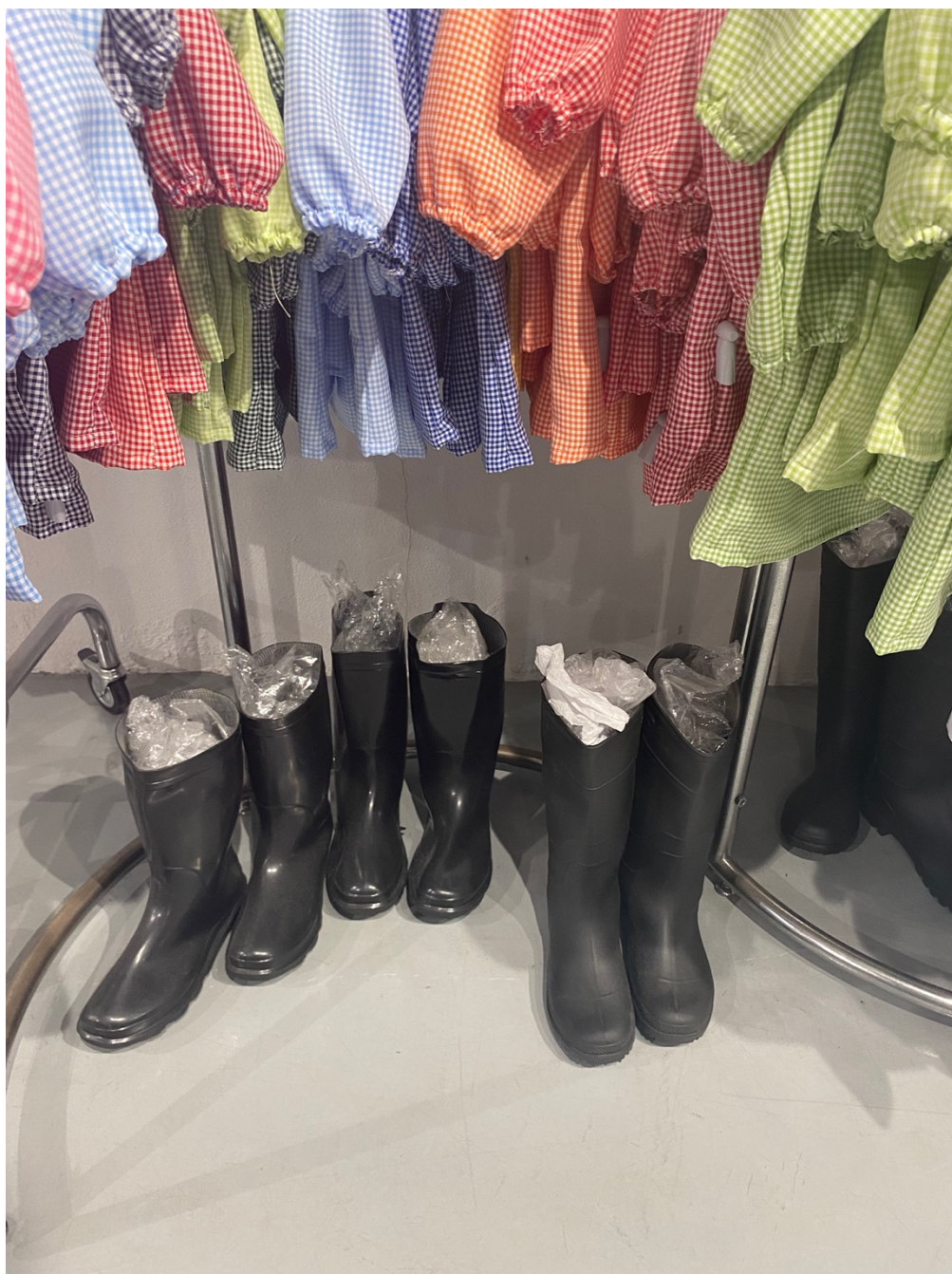
Figura 7: Pesquisa de guarda-roupa.