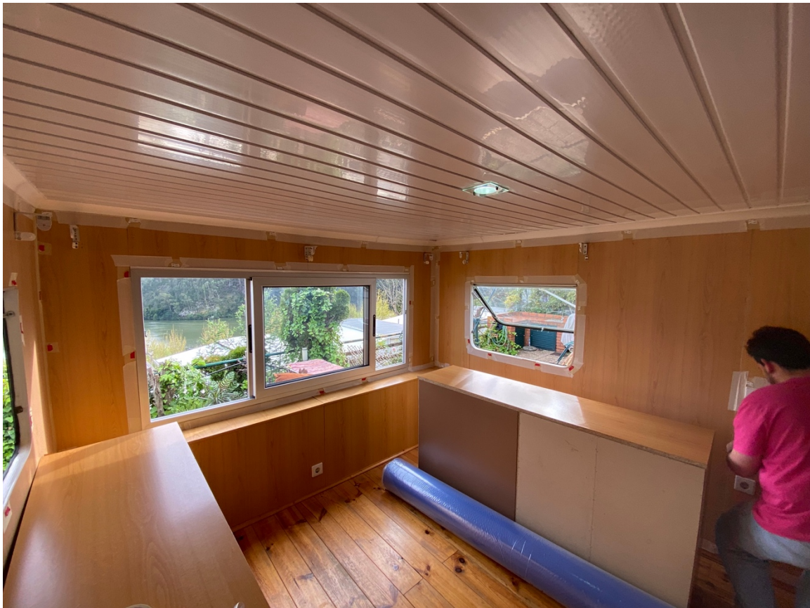
Figura 15: Casa do António pré trabalho de arte.