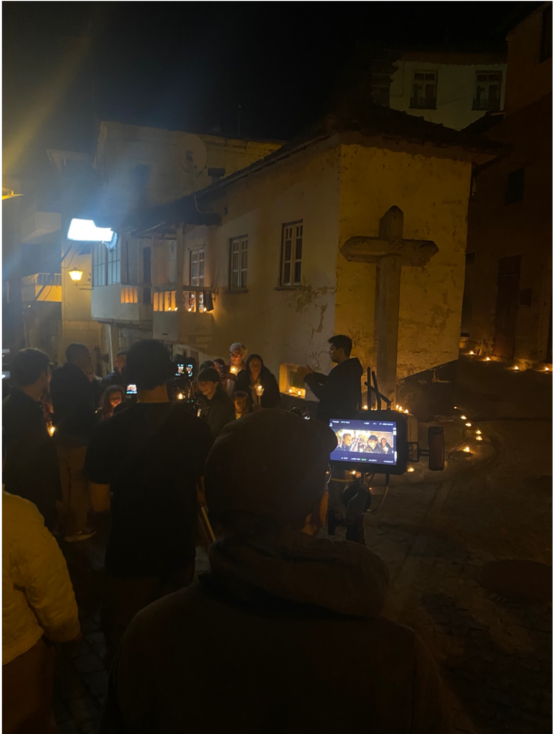
Figura 14: Recriação da procissão.