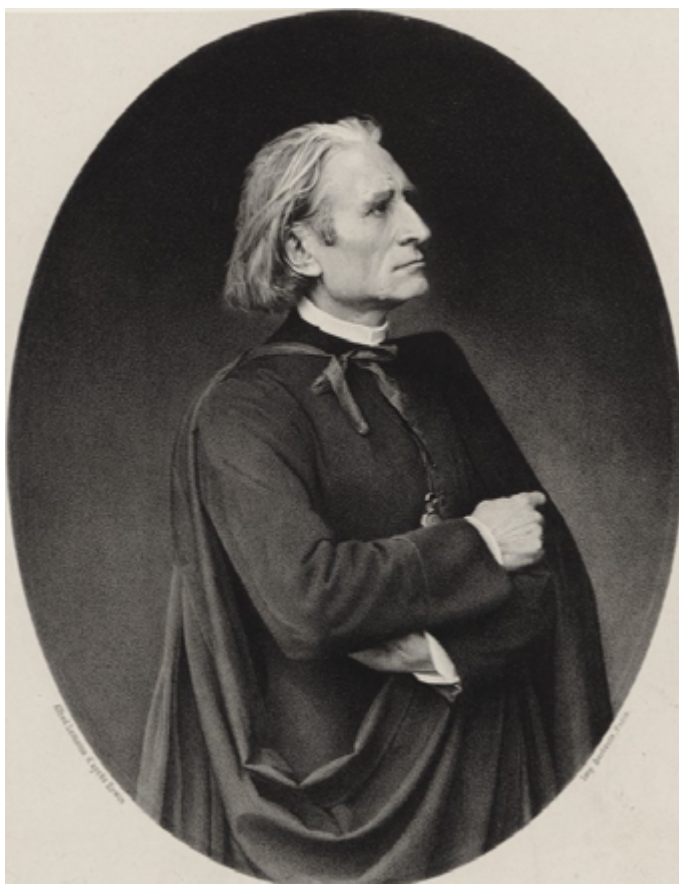
Franz Liszt em 1866

maestro. O segundo foi igualmente estreado em Weimar, dois anos mais tarde, mas desta vez com Liszt à frente da orquestra e o seu aluno Hans von Bronsart como solista. Em qualquer dos casos, o formato Concerto transfigura-se em algo que se aproxima de um poema sinfónico. Nenhum dispensa o virtuosismo da parte solista, mas ambos surpreendem pela alternância entre momentos de afetado lirismo e outros de grande aparato, sem sacrifício da fluência discursiva. Os episódios entrelaçam-se em torno do tema principal, numa estrutura cíclica que percorre dinâmicas contrastantes e diferentes efeitos expressivos. A aparência de uma improvisação perpétua é obtida através da economia de recursos, já que tudo entronca em apenas uma ou duas ideias principais. Procura-se em cada instante imergir o ouvinte num estado de encantamento, condicionado por texturas que evoluem num tempo dramaturgicamente calculado. Era música para cinema muito antes do cinema existir.