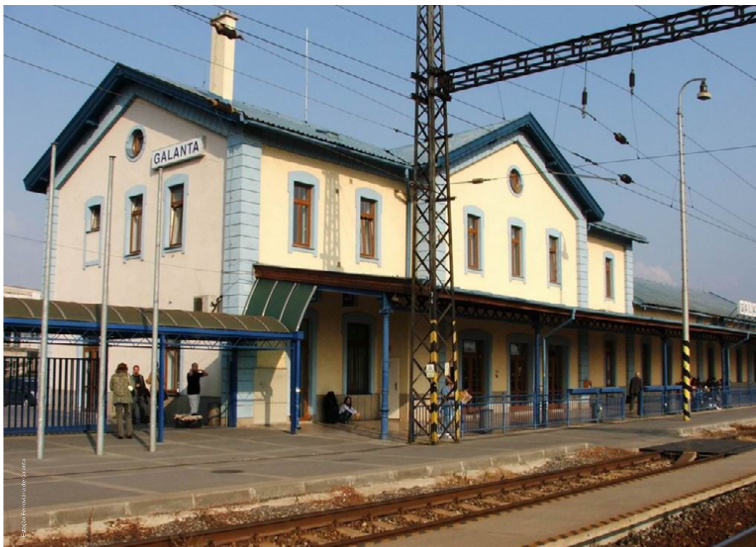
Estação Ferroviária de Galanta