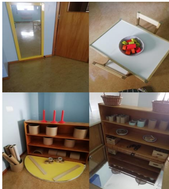
Figura 5 - Disposição da sala de reserva no 2º momento

Num segundo momento, este também realizado na sala de reserva, estavam disponíveis materiais como peças de madeira de várias cores e formatos; tubos de cartão diversificados quer em comprimento quer em largura, alguns divididos ao meio; e um espelho, estes materiais dispostos como mostra a seguinte composição de imagens: