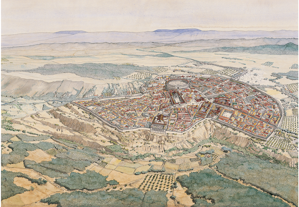
Fig. 1. Conimbriga no fim do séc. II d.C. Ensaio de visualização de Jean-Claude Golvin (1994, 50-55).

Estes aspetos podem hoje ser melhor compreendidos graças, em grande medida, ao desenvolvimento de estudos de arqueometria aplicada a achados já publicados e a alguns novos dados expostos pelo avanço das escavações arqueológicas na cidade 3 .