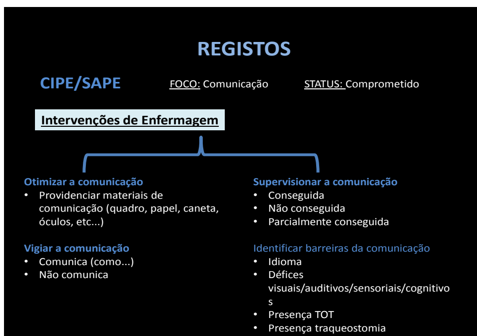
Figura 1 – Registos de enfermagem

Existem intervenções programadas no plano de cuidados de enfermagem (linguagem CIPE) dos doentes desta UCI designadas por «otimizar a comunicação, vigiar a comunicação, supervisionar a comunicação e identificar barreiras da comunicação». Estas intervenções não apresentam qualquer outra especificação sobre que registos se devem efetuar em relação às intervenções referidas. Assim foi objetivo identificar uma forma de abordagem das mesmas: