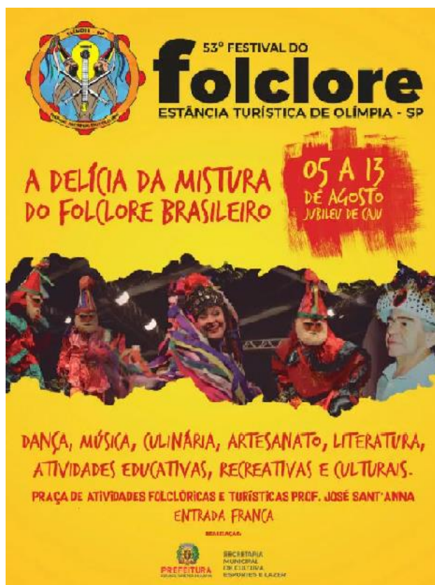
Figura 2 - Cartaz Festival do Folclore 2017

Atualmente, o Festival do Folclore de Olímpia é o maior festival de folclore do país por abranger não só folguedos folclóricos e danças, mas também grande parte do que caracteriza a cultura popular brasileira. Possui uma área de 96.800 metros quadrados e tem capacidade de receber aproximadamente 3 mil pessoas sentadas. Em 2017 será realizado o 53º Festival do Folclore de Olímpia de 5 a 13 de Agosto.