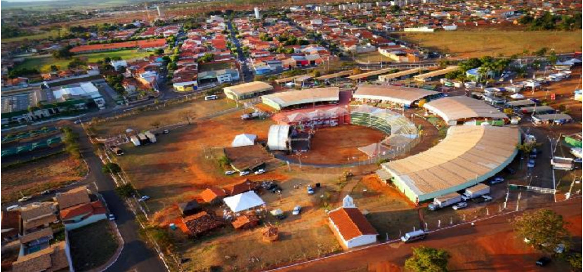
Figura 3 - Praça de Atividade Folclóricas e Turísticas Professor José Sant'Anna