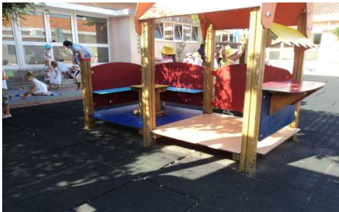
Figura 3 - Cozinha do escorrega

O campo de jogos foi outro local apontado pelas crianças para a realização de jogos com todo o grupo de crianças e com as estagiárias, mas também jogar a bola com os melhores amigos.