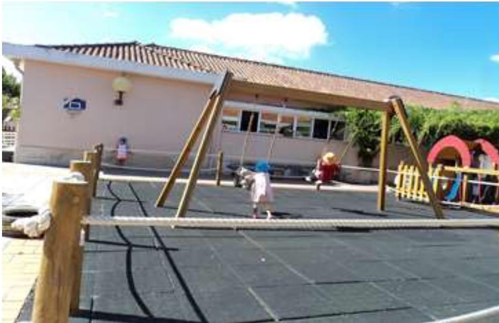
Figura 5 - Baloios

Uma das crianças apontou os baloiços como a primeira brincadeira que realizou no Jardim – de Infância e nunca mais esqueceu, nele elas podiam baloiçar para a frente e para trás como muito força.