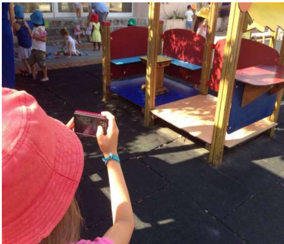
Figura I - Recolha de imagens