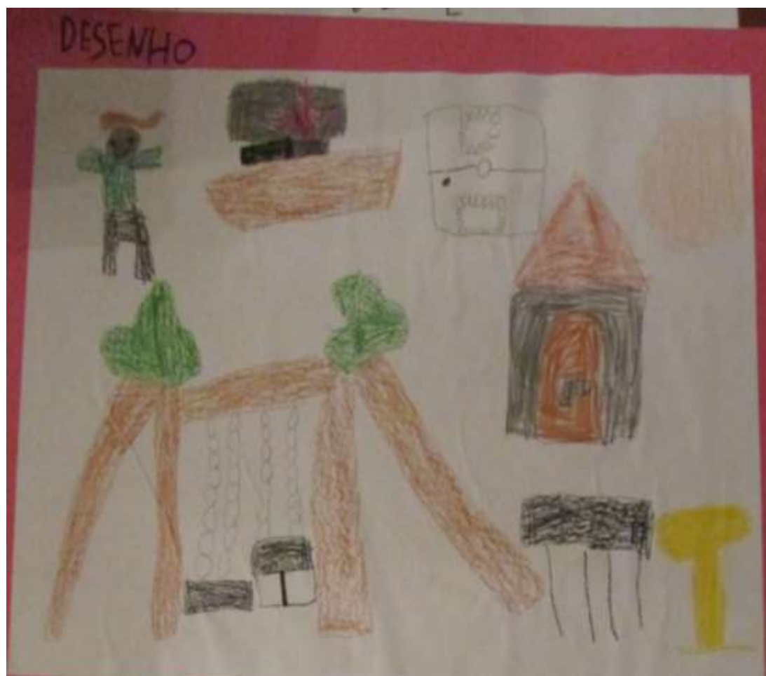
Figura III - Desenhos dos espaços favoritos