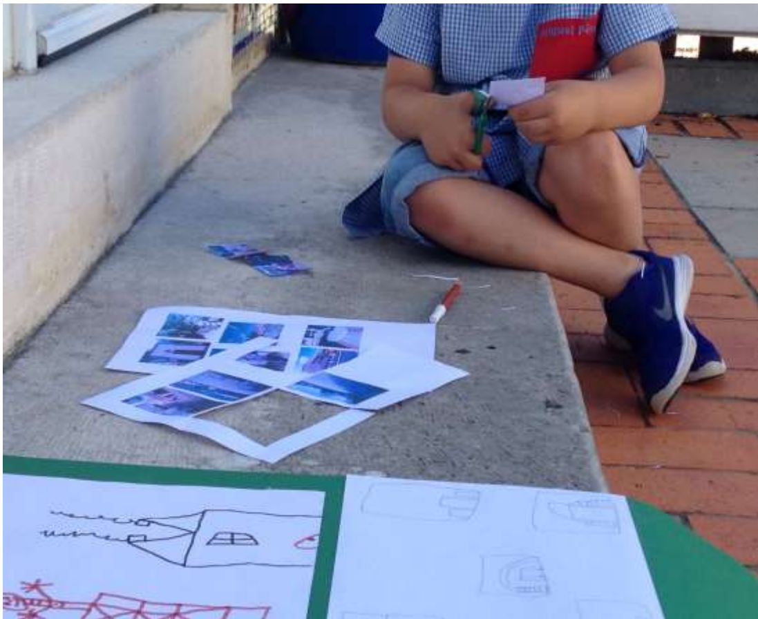
Figura II - Escolha das imagens