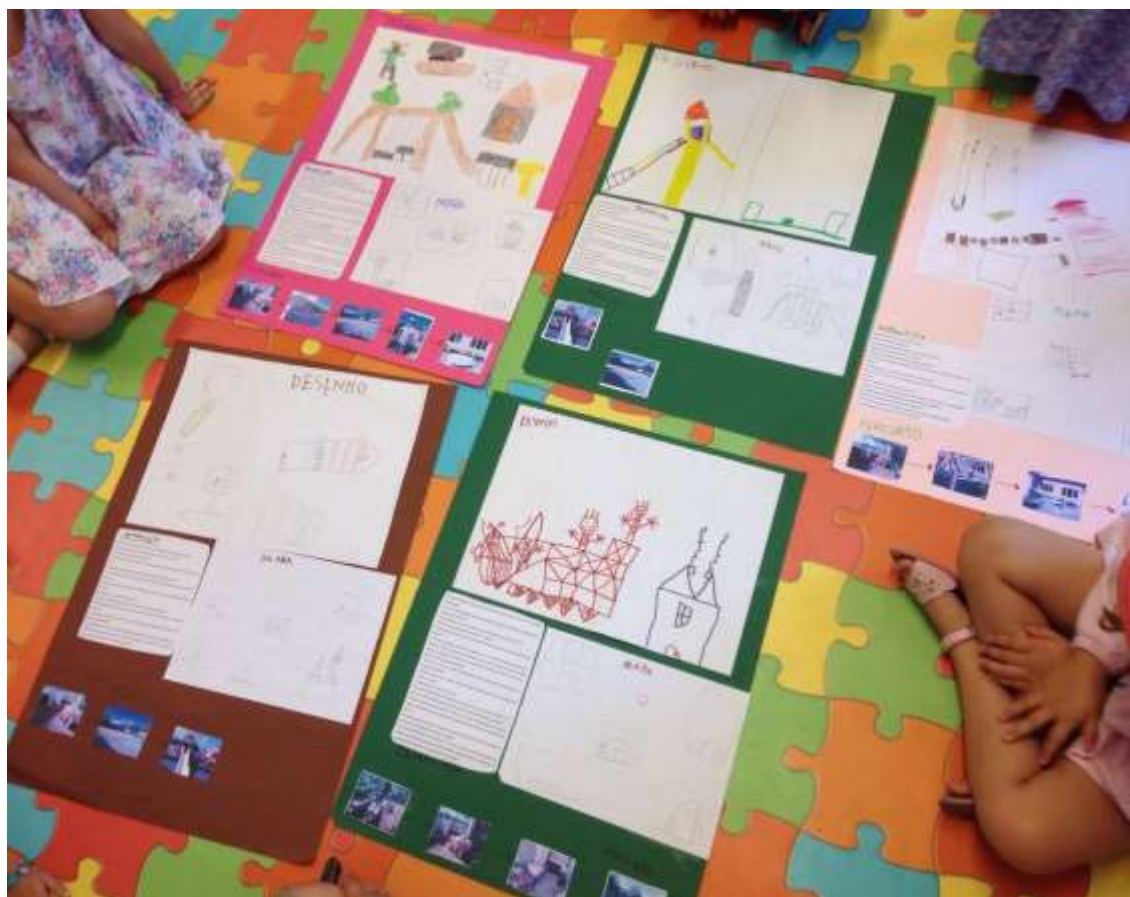
Figura VII – Discussão em grupo da manta mágica