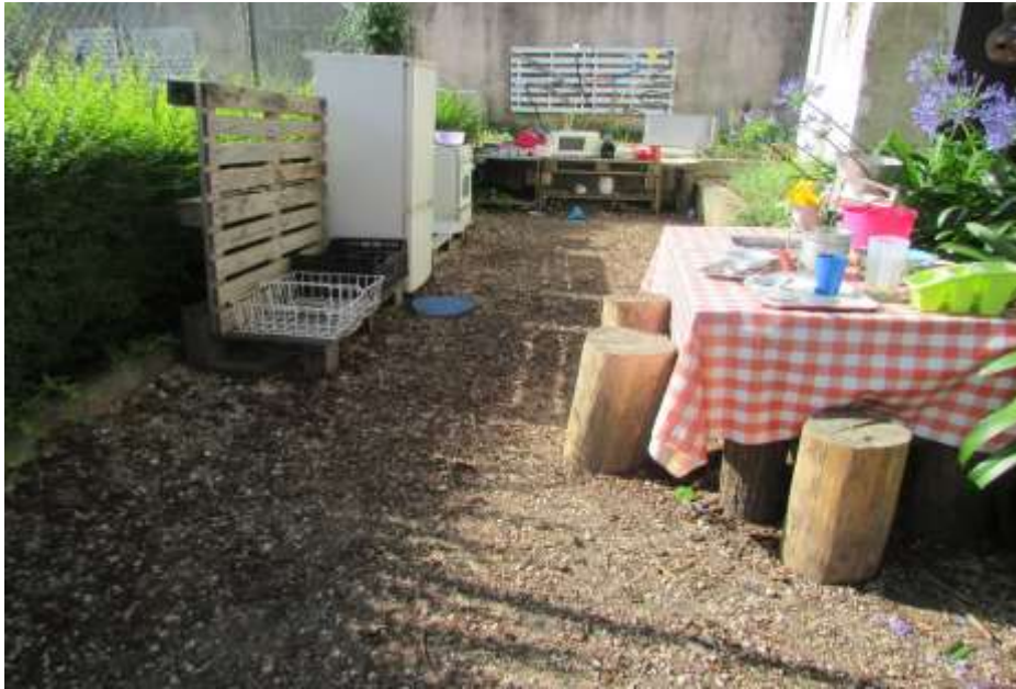
Figura 1 - Cozinha de lama

Já a criança M escolheu o escorrega como sítio preferido, um espaço onde brincavam com frequência “O sítio onde mais gosto de brincar é no escorrega, é divertido com todos os amigos. Este sítio também foi apontado por outras crianças como um espaço onde brincavam com maior frequência e além de escorregarem com os amigos também realizavam jogos como a entrega de pizzas na cozinha do escorrega.