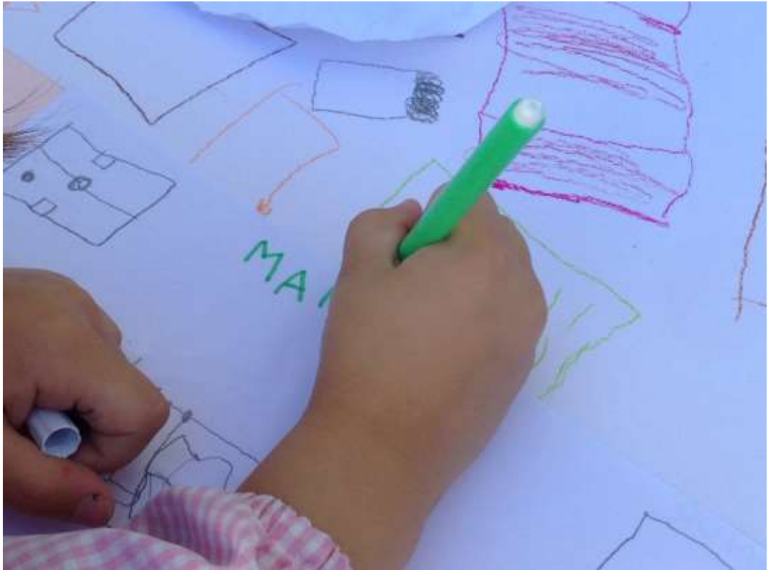
Figura IV - Construção do mapa