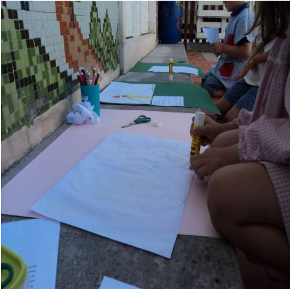
Figura VI - Construção da manta mágica pelas crianças